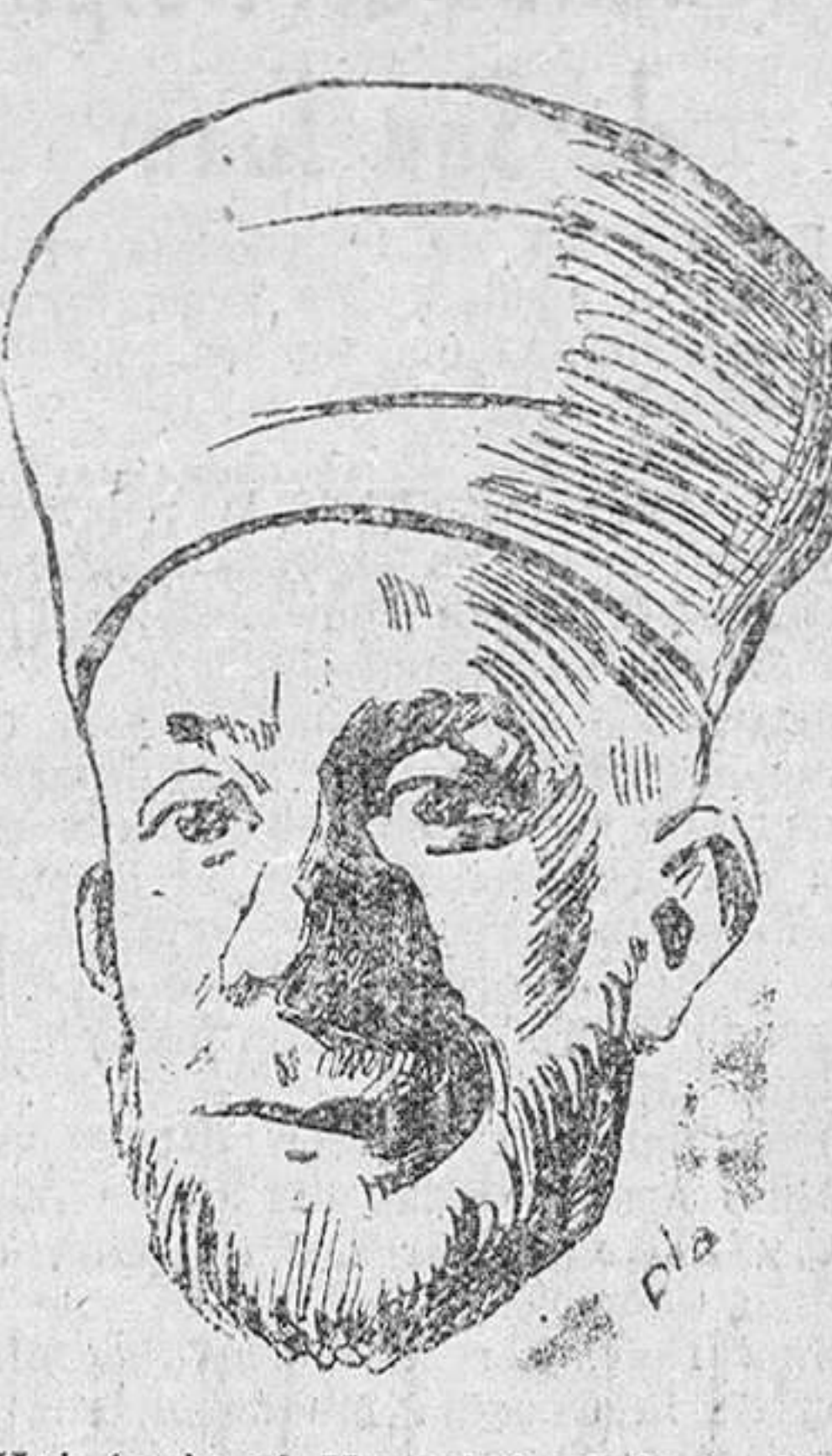
Haj Amin el-Husseini, el Gran Mufti de Jerusalén, vive e inquieta en el exilio.

Haj Amin el-Husseini, el Gran Mufti de Jerusalén, vive e inquieta en el exilio, tras de forzosa pausa, al plano de la actualidad mundial. Las gentes que más hablan olvidado su nombre, tantas veces traído y llevado en estos últimos tiempos de acontecimientos históricos, en plezan a hacer otra vez cabales y conjeturas en torno al famoso personaje, mientras en las cancellerías se guarda secreto, inquietud o sorpresa sobre el fin que ha movido a correr en el "tápij volador" de sus fantásticos viajes al hombre del turbante verde y los ojos azules inespado hoy de honor en la ciudad de Damasco.