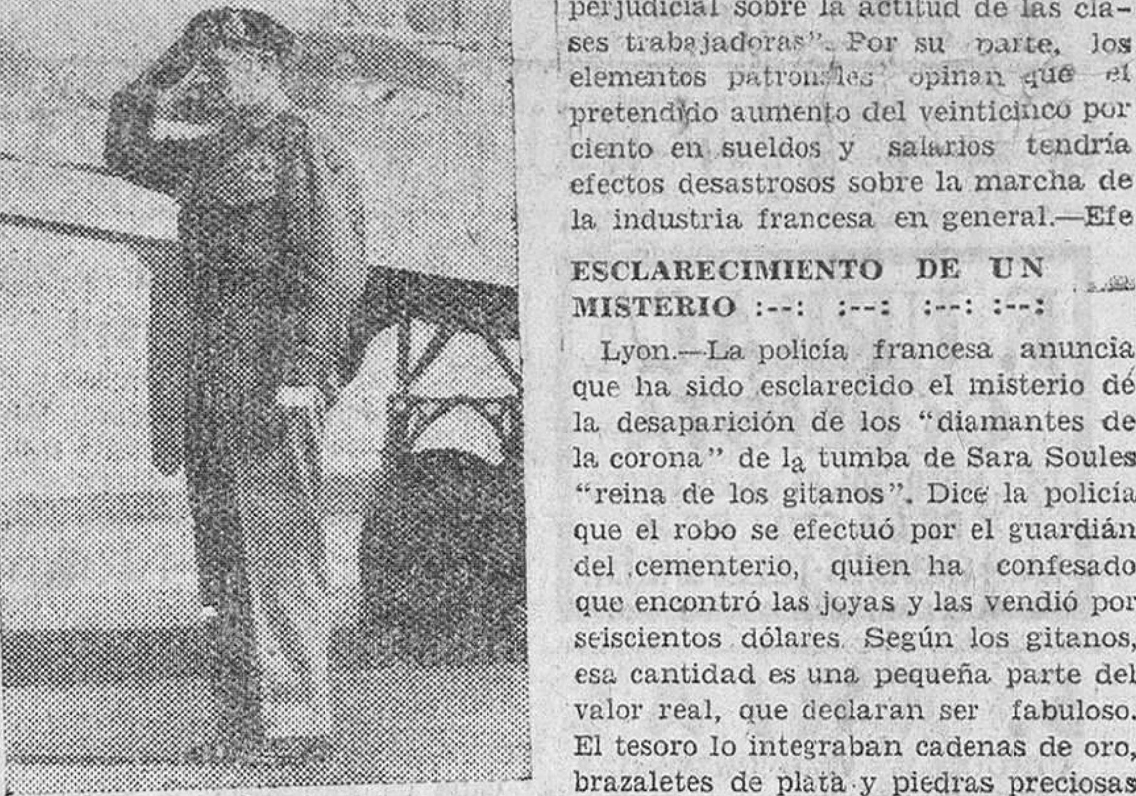
El mariscal Montgomery saluda a los jefes que acudieron a despedirle momentos antes de tomar el avión en el que regresó a Gran Bretaña después de su última estancia en Alemania.