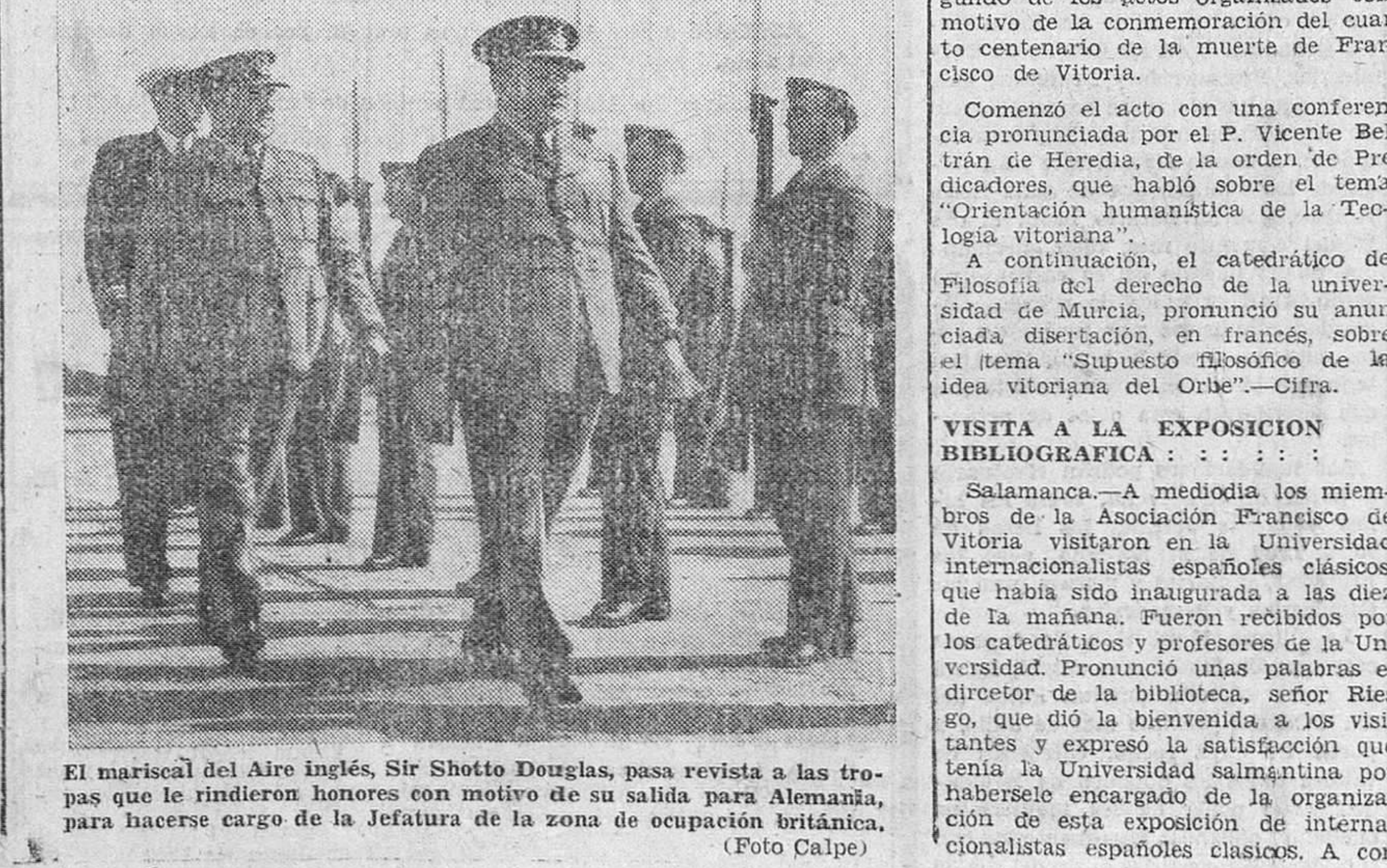
El mariscal del Aire inglés, Sir Sholto Douglas, pasa revista a las tropas que le rindieron honores con motivo de su salida para Alemania, para hacerse cargo de la Jefatura de la zona de ocupación británica.