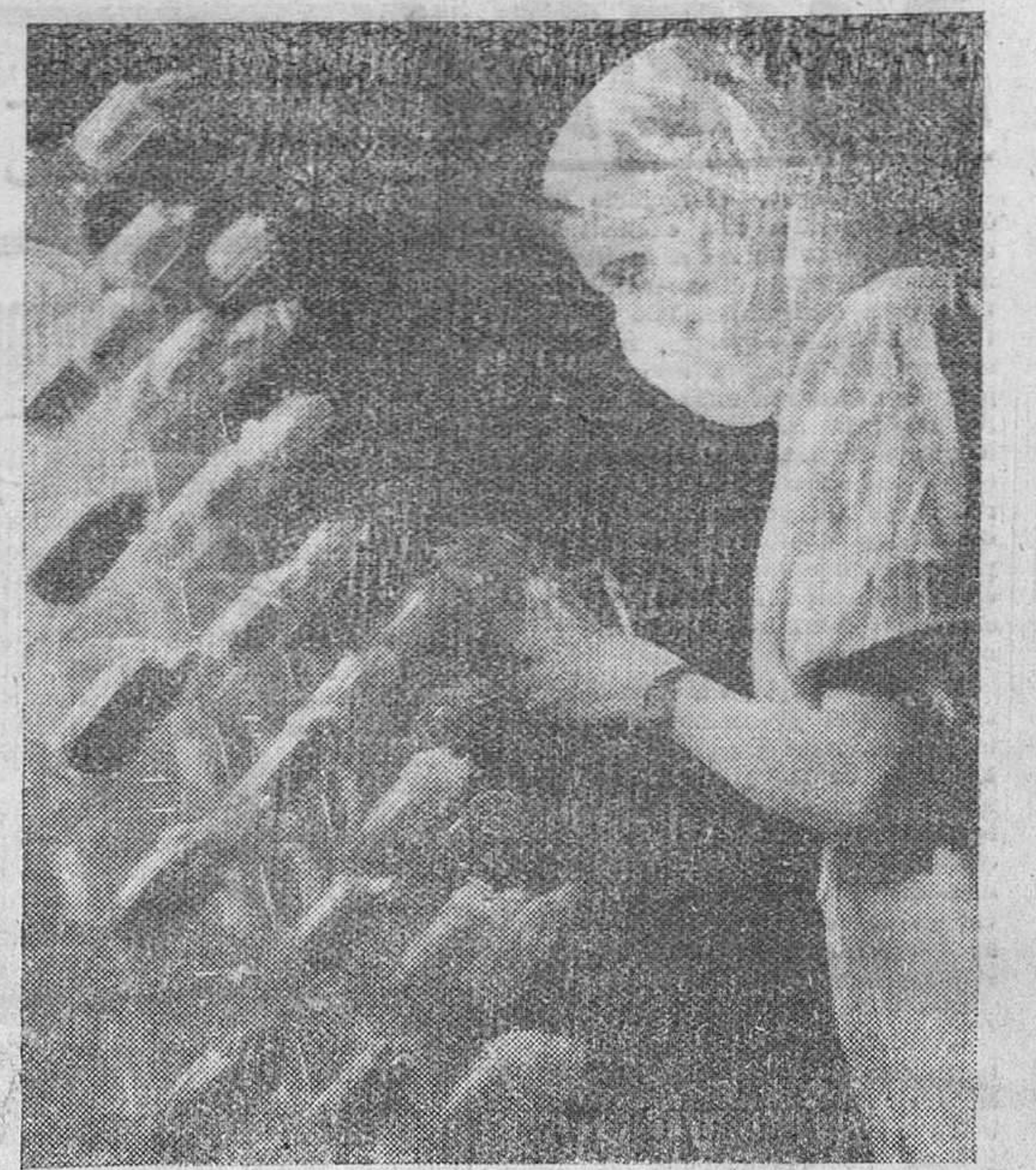
En Gran Bretaña, comenzó a producirse a principios de año una cantidad suficiente de penicilina para atender a las necesidades de la medicina inglesa. Esta operaría de un laboratorio, rocia, cubierta con una mascarilla protectora, los gérmenes para la propagación del producto.