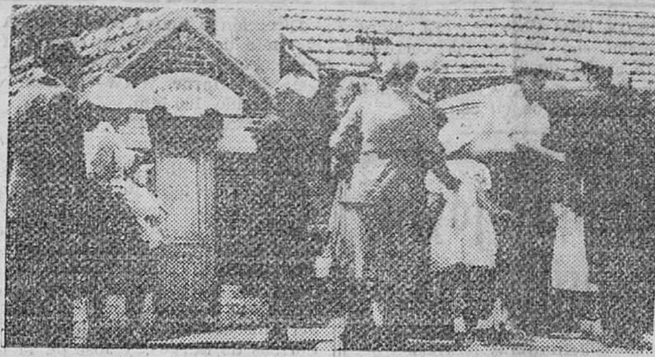
Acompañada de sus hijos, la Princesa María José de Bélgica, hermana del Rey Leopoldo y esposa de Humberto II, ha llegado a Lisboa, donde parece que espera a su marido para fijar su residencia definitiva en Cintra. Con la presencia de los ex reyes de Italia en Portugal son ya dos tendencias las que se han ido a refugiar en este país: Dño Grandi, de la Italia fascista, y los ex reyes de la Italia liberal.