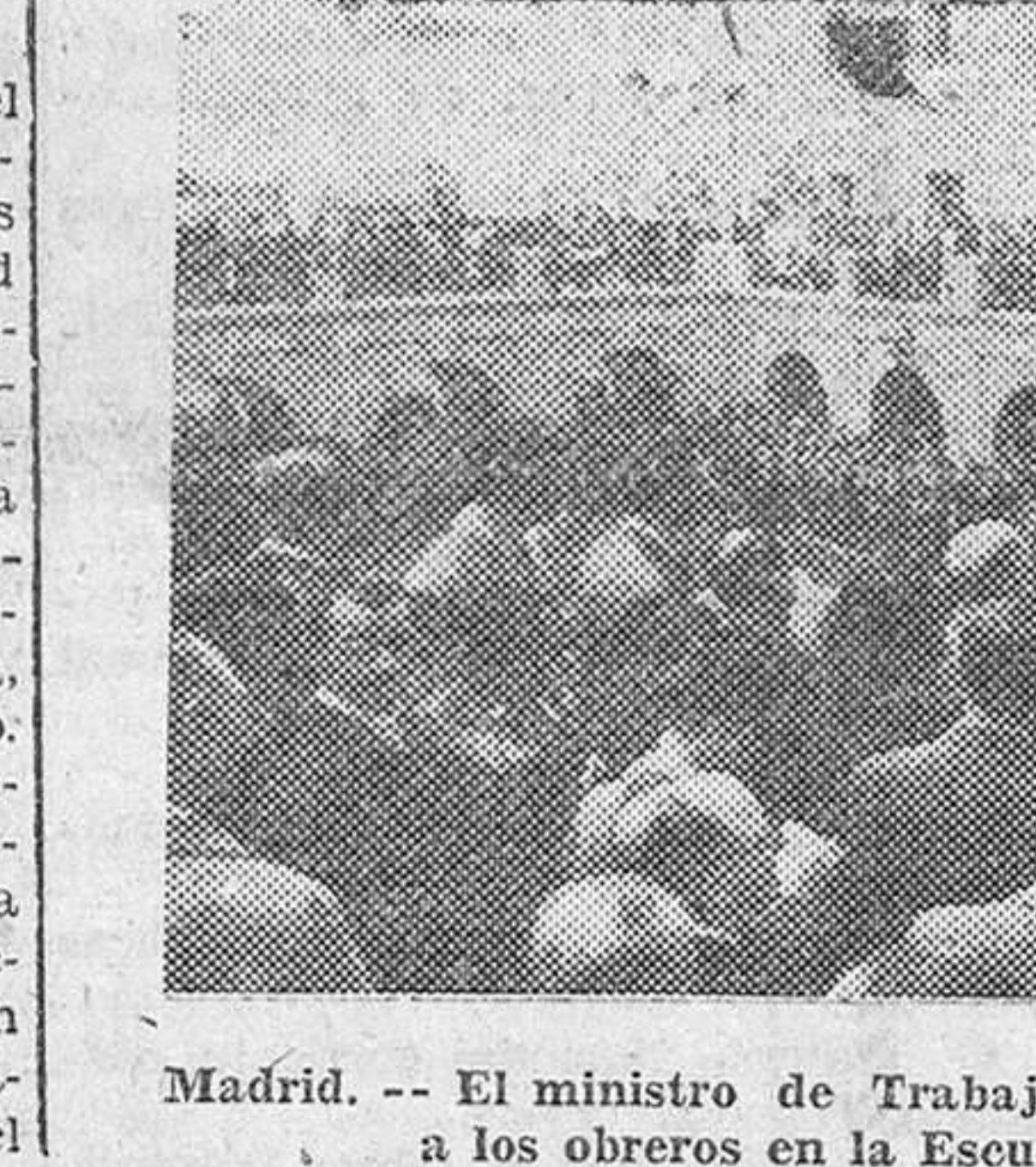
Madrid.— El ministro de Trabajo señor Girón, durante su alocución a los obreros en la Escuela de Capacitación Social

Santo Domingo.—El Gobierno dominicano adoptará en el Consejo de