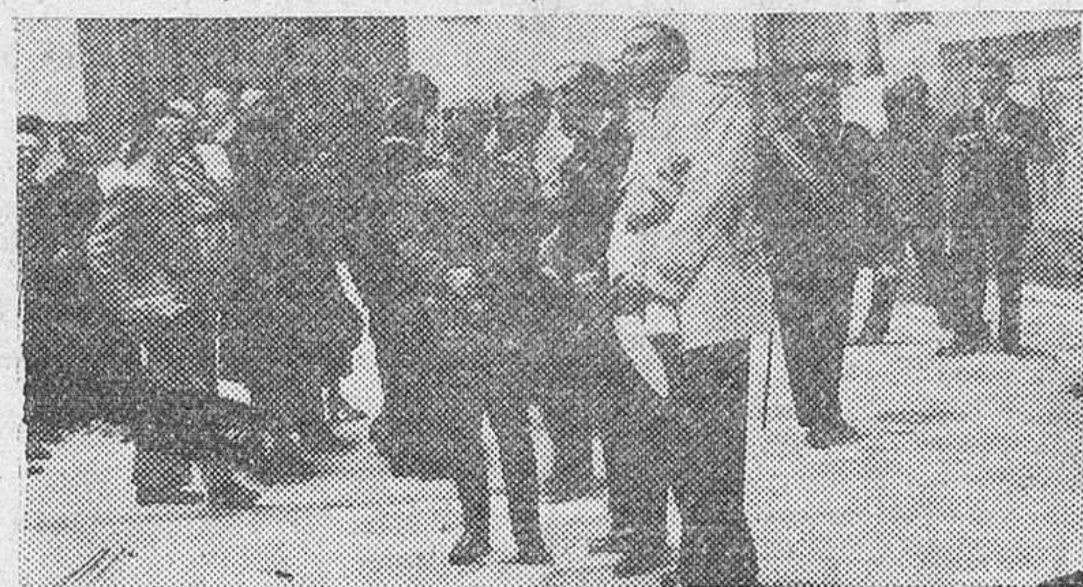
Su Excelencia el Jefe del Estado, acompañado de su esposa; el ministro de Asuntos Exteriores, Educación y Hacienda y otras personalidades, en el acto inaugural del Museo Arqueológico

El Caudillo, descendió acompañado de su esposa, de las habitaciones del piso principal del palacio, a las nueve y quince minutos. Se despidió de los ministros, de las primeras autoridades y de cuantas personalidades se encontraban en el patio de la Montería. Seguidamente tomó su automóvil y acompañado de doña Carmen Polo de Franco inició la marcha. En el momento de salir de la histórica puerta del León, a la puerta de Triunfo, que estaba materialmente llena de gente de todas clases y condición y de modistillas y estudiantes que ponían una nota alegre en el acto, se desbordó el entusiasmo de forma verdaderamente apoteósica a los gritos de ¡Franco, Franco, Franco! ¡Viva nuestro Caudillo! Sevilla y otros, se mezclaban con aclamaciones y vitores de todas clases, como signo exponente de la calidad emocional que ha tenido la despedida del pueblo de Sevilla al Generalísimo. El automóvil en que iban el Caudillo y su esposa, rodeado del pueblo, tenía que caminar más lentamente al embochar la calle, anhelante de estar cerca del