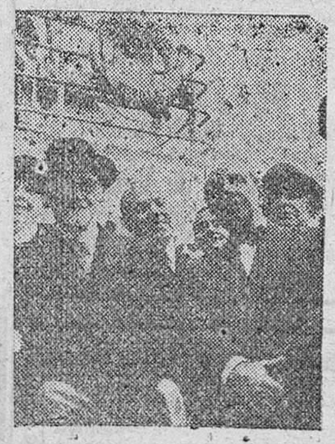
El ilustre dramaturgo español, don Jacinto Benavente, es recibido en el puerto de Barcelona por una comisión de la Sociedad de Autores de España y diversas personalidades

Con arreglo a lo dispuesto en el Decreto de 1º de Mayo de 1946 ("B. O. del Estado" número 122), que ordena la formación del "Censo de residentes mayores de edad", que ha de servir de base para la aplicación del referéndum, todos los españoles mayores de edad, hombres o mujeres, podrán presentar las reclamaciones que consideren oportunas ante las respectivas Juntas Municipales del Censo, los días y horas que están expuestas al público las listas provisionales del Censo, en la forma que oportunamente se anunciará.