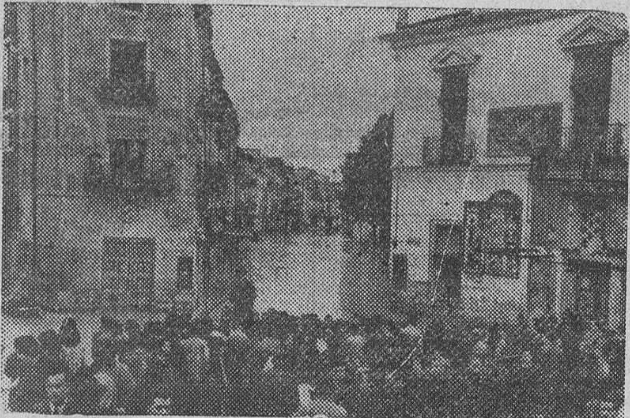
Las calles de las ciudades murcianas han presentado aspectos tan curiosos como los que muestra la fotografía. Con lanchas de salvamento o con balsas, los vecinos hubieron de abandonar sus casas, cuyas plantas inferiores se hallan bajo el nivel de las aguas del río Segura