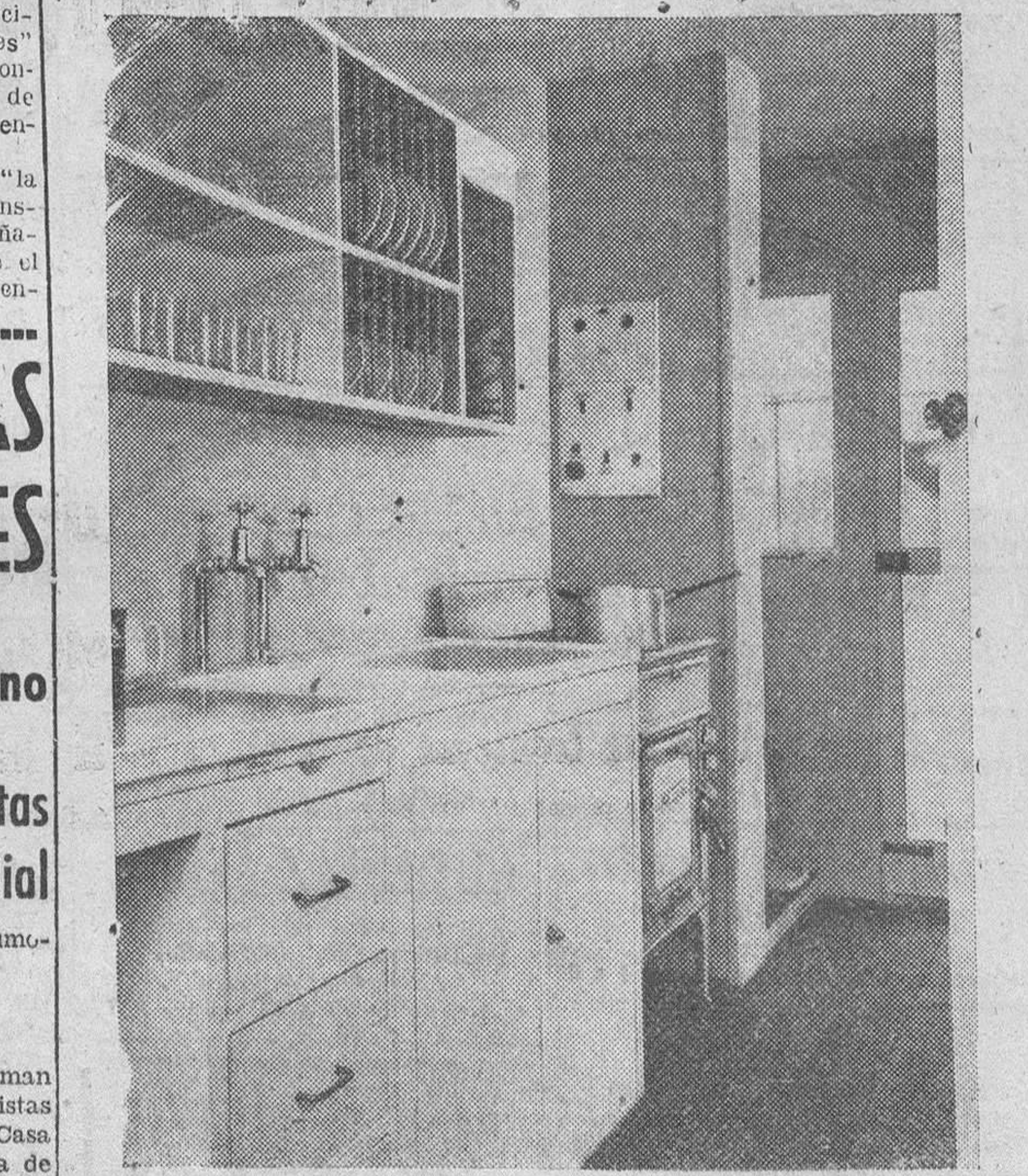
He aquí la magnífica y moderna cocina de que están dotadas la mayoría de las casas prefabricadas que actualmente se construyen en Gran Bretaña. (Foto Calpe).