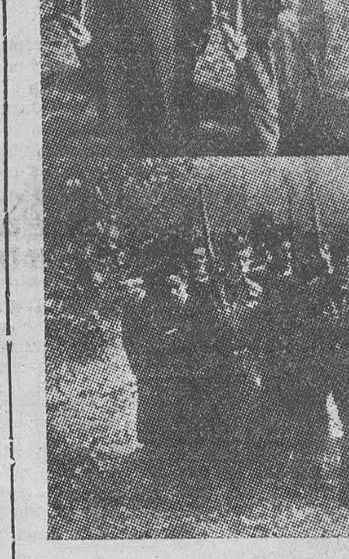
“Sexto. Protección constante prestada a las organizaciones de terroristas y guerrilleros rojos españoles que actúan desde los territorios franceses inmediatos a nuestra frontera y que encubre esas actividades con la pantalla de dedicarse a la explotación de los bosques pirenaicos” (Declaraciones del Gobierno español acerca de las relaciones franco-españolas, de 1 de Marzo de 1945. Fotografía obtenida de “Le Cahiers Francaise”).