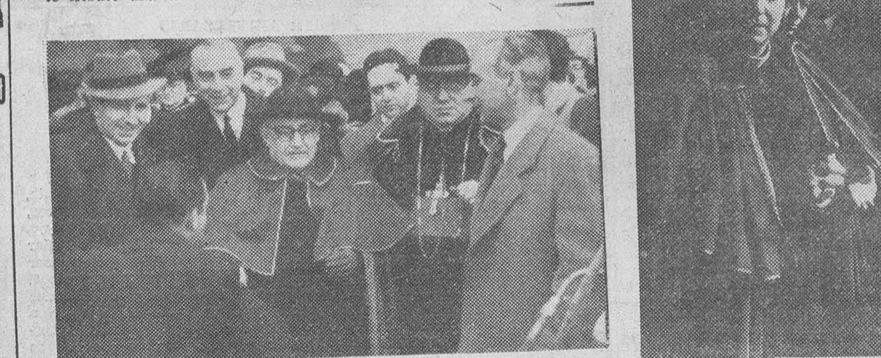
A la izquierda, el Cardenal Primado de Toledo, Dr. Plá y Deniel, acompañado del Nuncio de Su Santidad en España y otras destacadas personalidades, después de la llegada de los Cardenales españoles a bordo del avión "Estrella de la ciudad del Vaticano", en el que realizaron su viaje de regreso a España.- A la derecha, "Estrella de la ciudad del Vaticano", Monseñor Cerejeira, patriarca de Lisboa, que llegó al aeródromo de Barajas en el mismo avión que condujo al Cardenal Spellman.

A la izquierda, el cardenal arzobispo de Nueva York, en el momento de descender del avión que le condujo directamente de Roma al aeropuerto de Barajas, es saludado por diversas personalidades españolas, entre los aplausos del público, que le tributó una cariñosísima acogida.