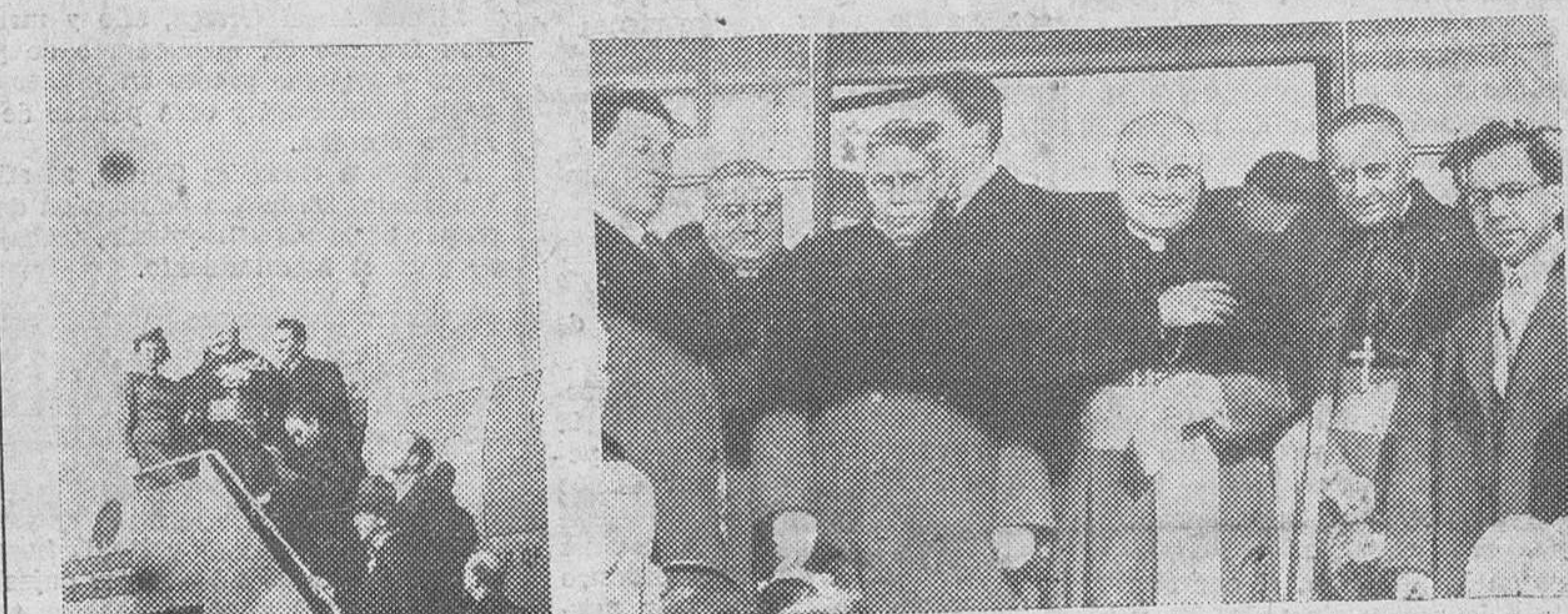
Arriba, Monseñor Spellman, poco después de su llegada al aeródromo de Barajas, acompañado del Nuncio de Su Santidad en España, Monseñor Cicognani; obispo de Madrid - Alcalá, Dr. Eljo Garay y otras personalidades que acudieron a recibirle.

A la izquierda, el cardenal arzobispo de Nueva York, en el momento de descender del avión que le condujo directamente de Roma al aeropuerto de Barajas, es saludado por diversas personalidades españolas, entre los aplausos del público, que le tributó una cariñosísima acogida.