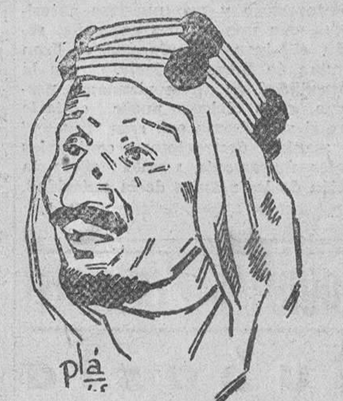
El rey Ibn Saud celebra el XXVIII aniversario de su coronación

Al monarca árabe le acompañan diez de sus hijos y el número de miembros de su séquito pasa de cien.—Efe.