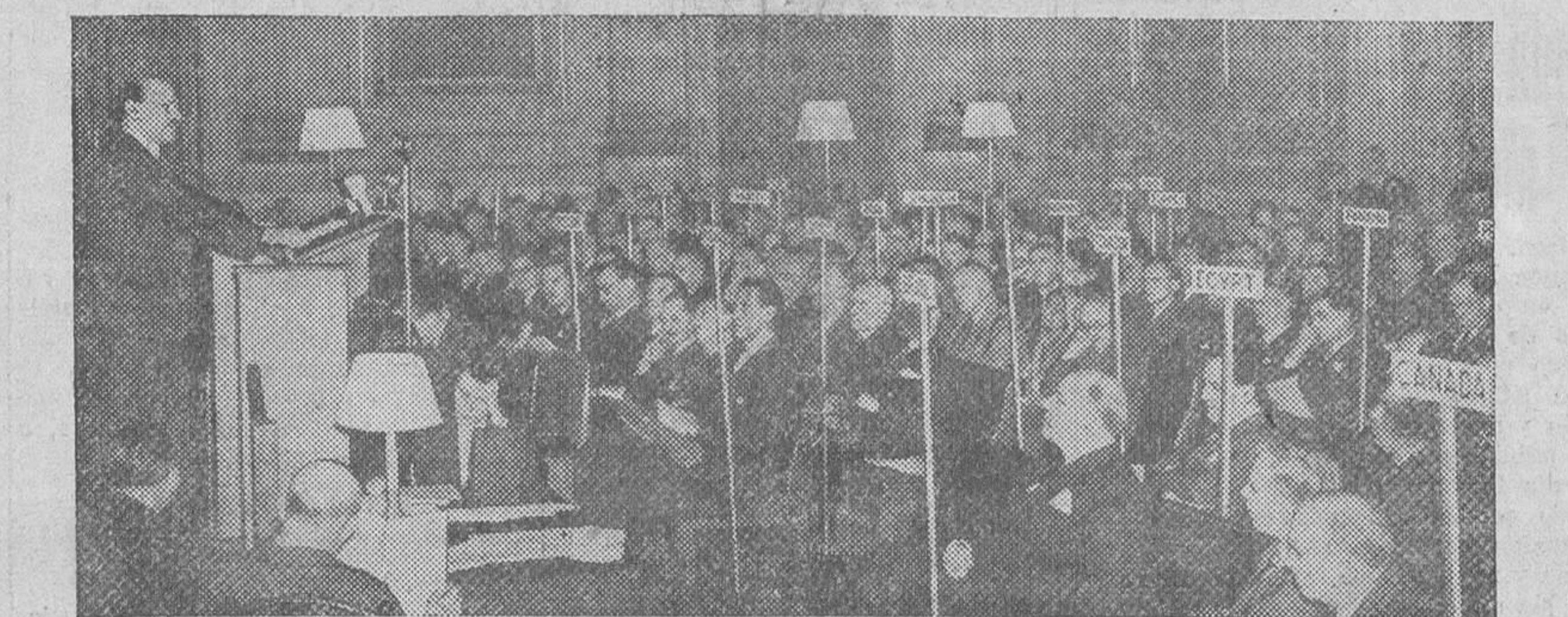
Mr. Attlee, dirigiéndose a los delegados de la Conferencia de las Naciones Unidas, para la Organización cultural y de educación en la reunión celebrada recientemente en Londres por aquélla.