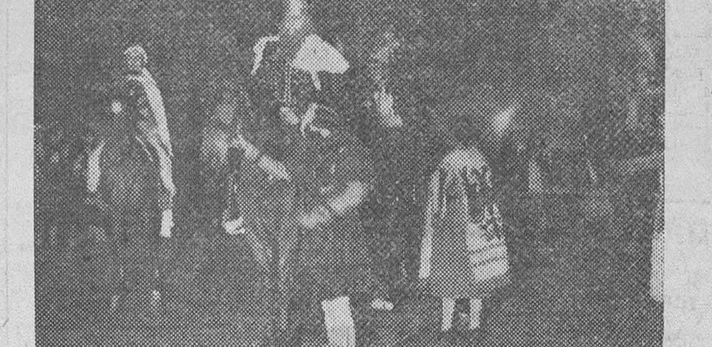
LA CABALGATA DE LOS REYES MAGOS ORGANIZADA POR LA JEFATURA PROVINCIAL DE MADRID, DESFILE POR LAS CALLES DE LA CAPITAL ENEREA LA ESPECTACION DE NUMEROSO PUBLICO