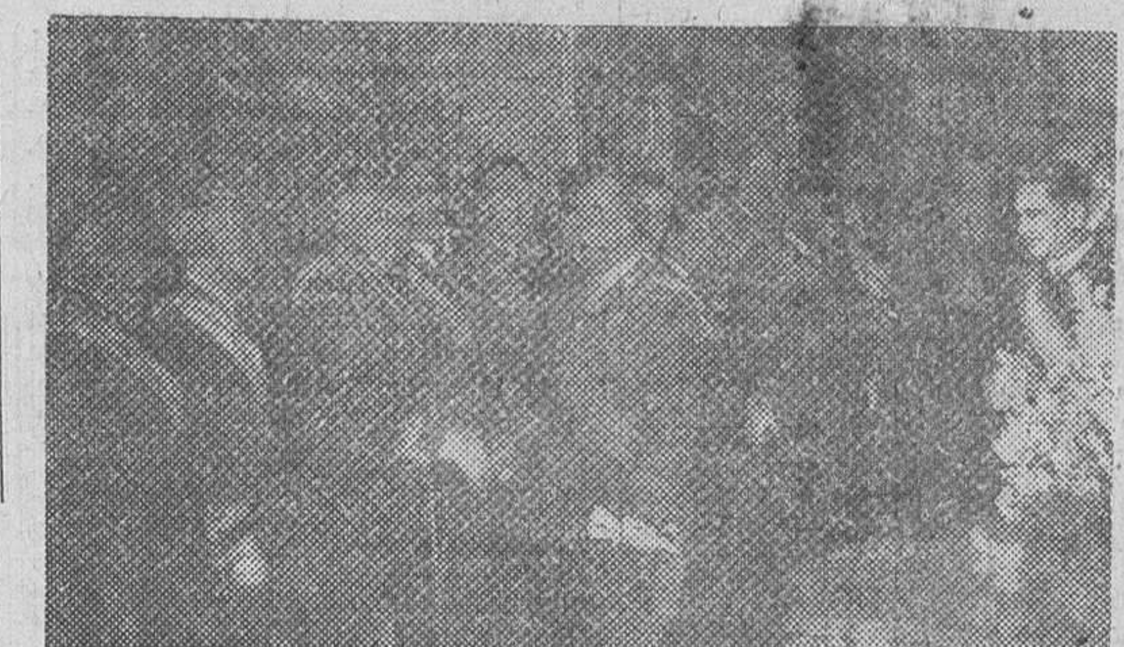
S. E. EL JEFE DEL ESTADO SALUDANDO A LOS JEFES DE LOS EJERCITOS DE TIERRA, MAR Y AIRE, DURANTE LA RECEPCION CELEBRADA EN EL PALACIO DE EL PARDO CON MOTIVO DE LA PASCUA MILITAR