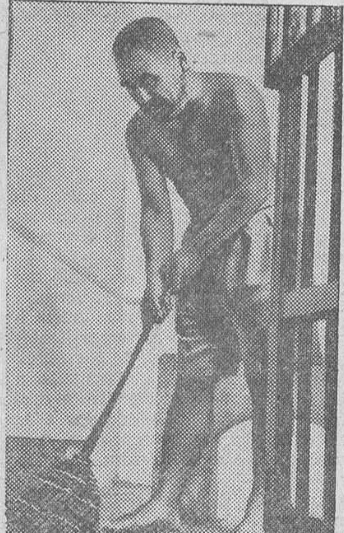
EL GENERAL JAPONES SAITO, EX-COMANDANTE JEFE DE LOS CAMPOS DE CONCENTRACION DE PRISIONEROS DE GUERRA Y CIVILES EN SINGAPUR, DURANTE LA OCUPACION NIPONA, DETENIDO COMO PRESUNTO CRIMINAL DE GUERRA, BARRE LA CELDA QUE OCUPA.