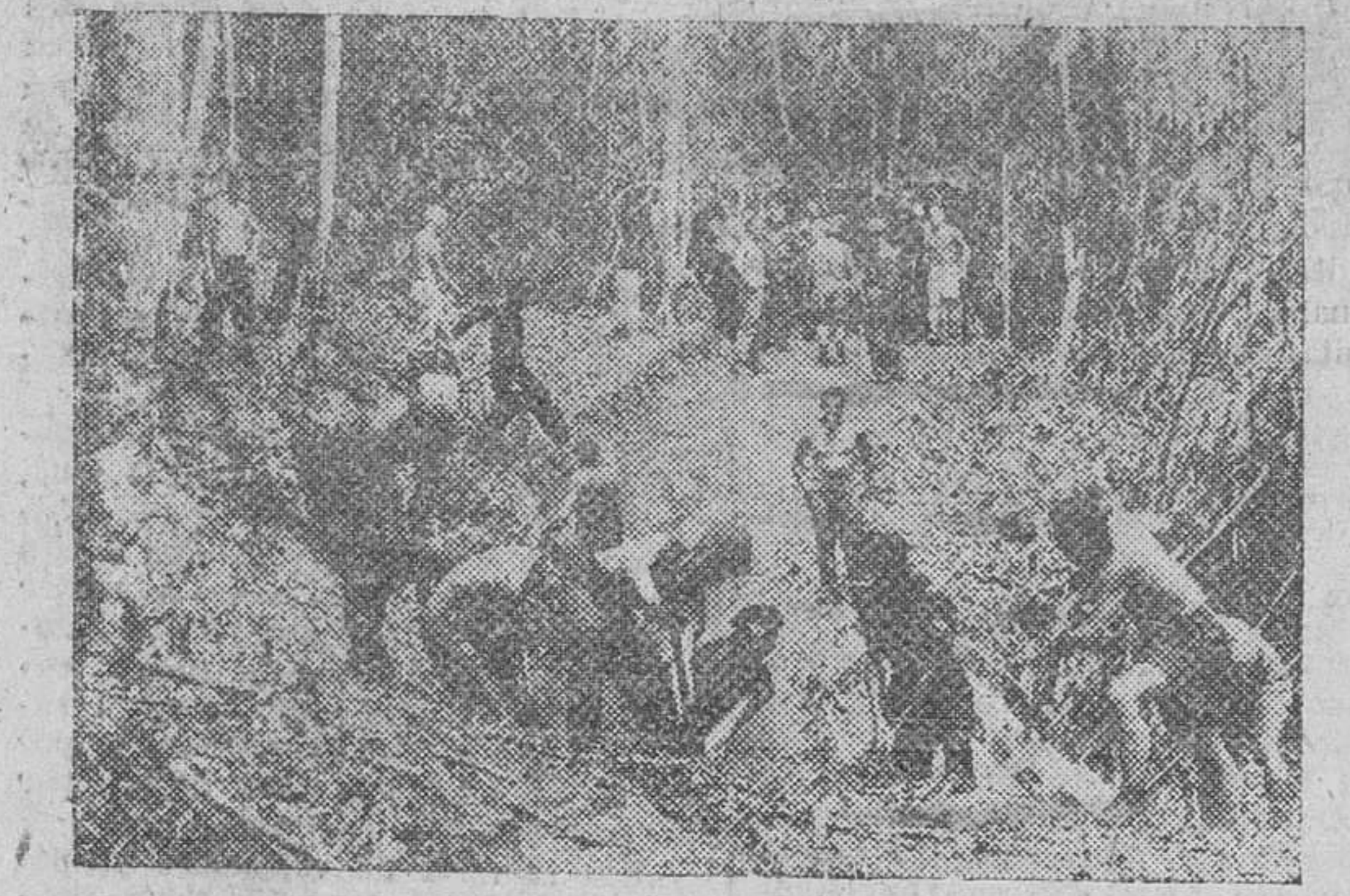
En Birmania, tras la rendición nipona, las fuerzas aliadas trabajan sin descanso en la apertura de muchas carreteras, a través de bosques espesos, que faciliten el abastecimiento y la comunicación con las ciudades liberadas.