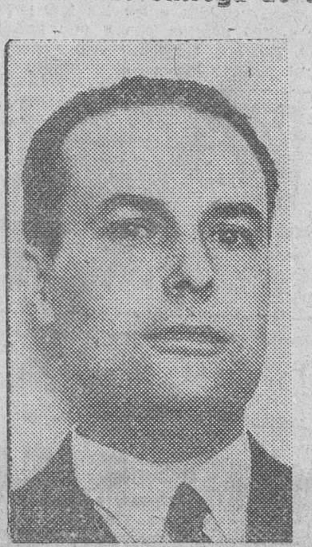
Madrid.—Por la Junta del Colegio Nacional de Secretarios, interventores y depositarios de Administración Local, de España, se ha entregado al ministro de la Gobernación, don Blas Pérez