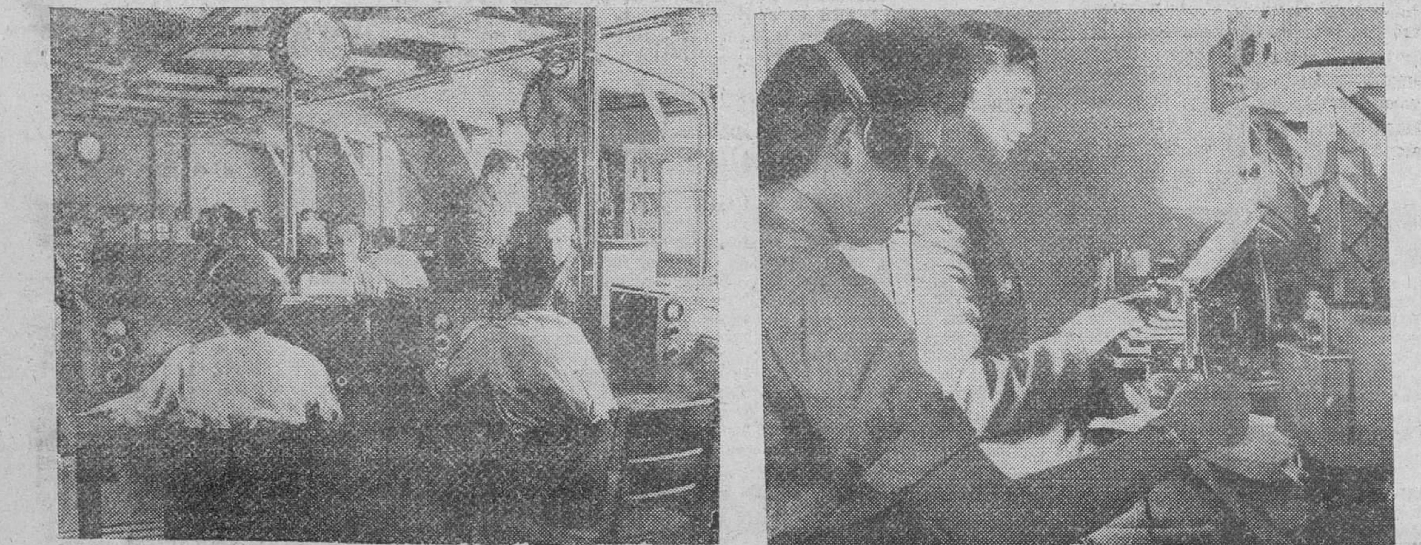
En la espaciosa sala que nos presenta la fotografía de la izquierda se recibían desde todas las partes del mundo los informes meteorológicos. Estos pasaban después al servicio de taquígrafos para ser transmitidos más tarde, directamente desde la estación central del Ministerio de los aparatos de la R.A.F. y bues en ultramar. La fotografía de la derecha nos muestra a dos empleados cursando por telefoto "el estado del tiempo" de diversas zonas del teatro de operaciones y en las cuales luchaban las tropas británicas.