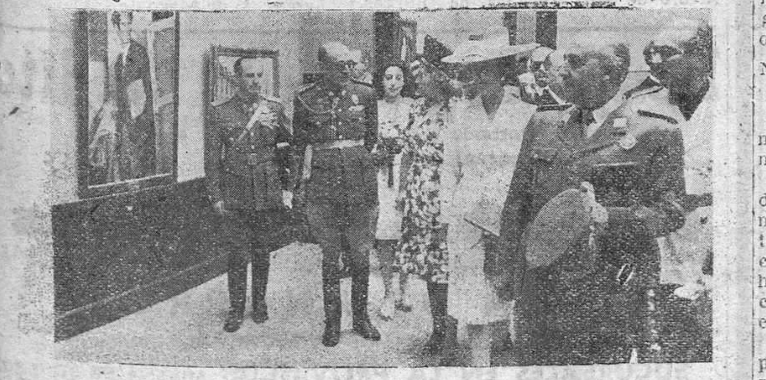
Madrid. —El Caudillo inaugura la Exposición Nacional de Bellas Artes en el Palacio de Exposiciones de El Retiro de Madrid. Acompañado de su esposa, del ministro de Educación nacional y otras autoridades y jerarquías nacionales, recorre la diversas salas del Palacio de Exposiciones.