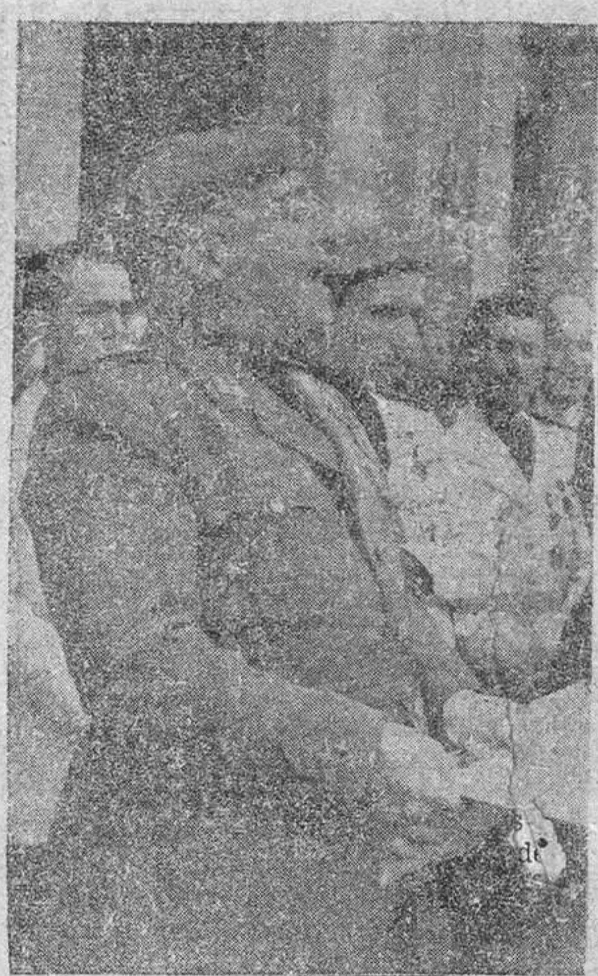
A la izquierda, S. E. el Jefe del Estado pronunciando su transcendental discurso en la sesión de clausura del Congreso Agrario Regional del Duero, que se ha celebrado en Valladolid.—A la derecha, el Caudillo dirige la palabra al pueblo vallisoletano desde el balcón del Ayuntamiento.