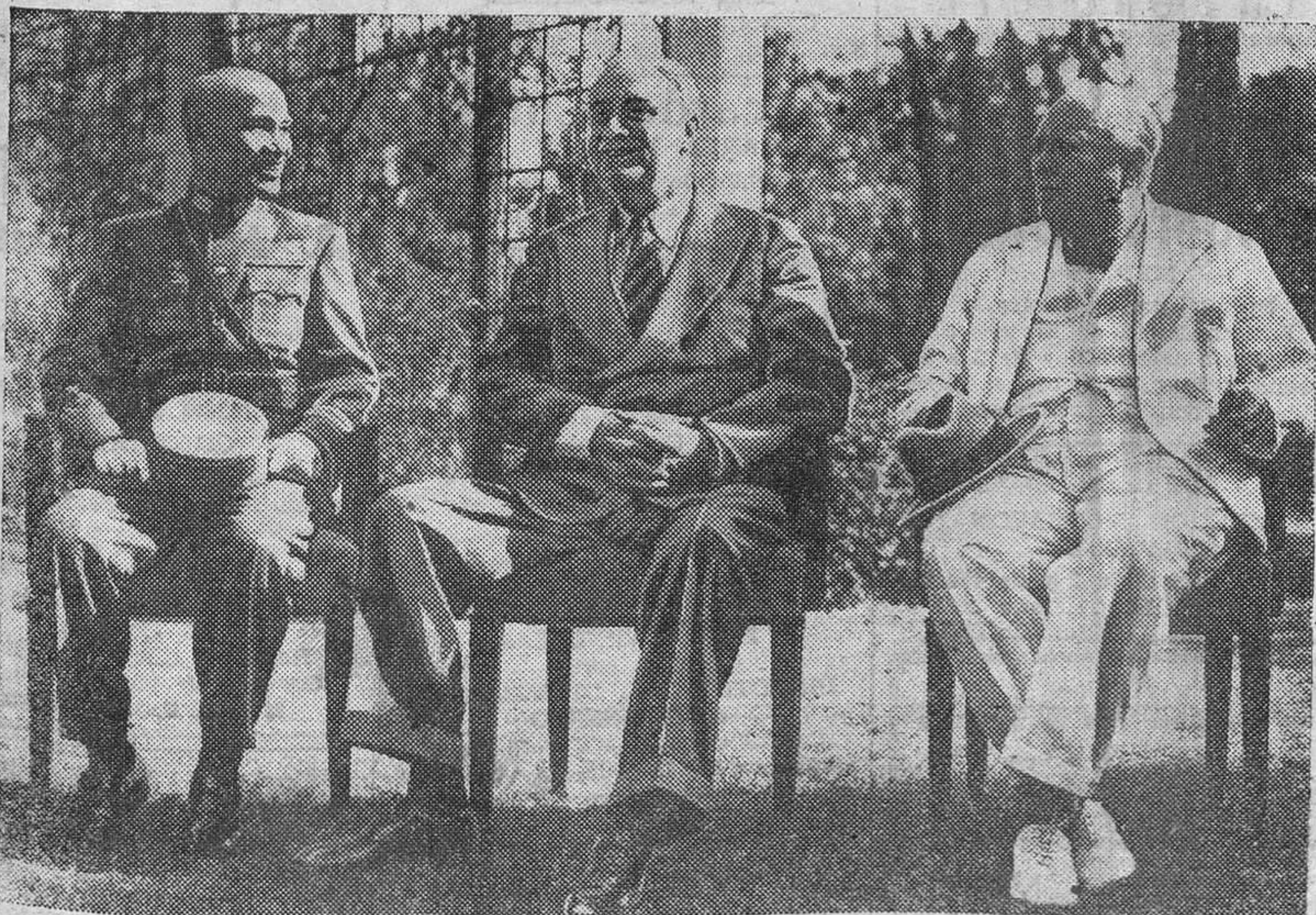
El finado presidente de los Estados Unidos aparece en la fotografía entre Churchill y Chiang-Kai-Shek, durante la primera entrevista celebrada por los jefes aliados en El Cairo.