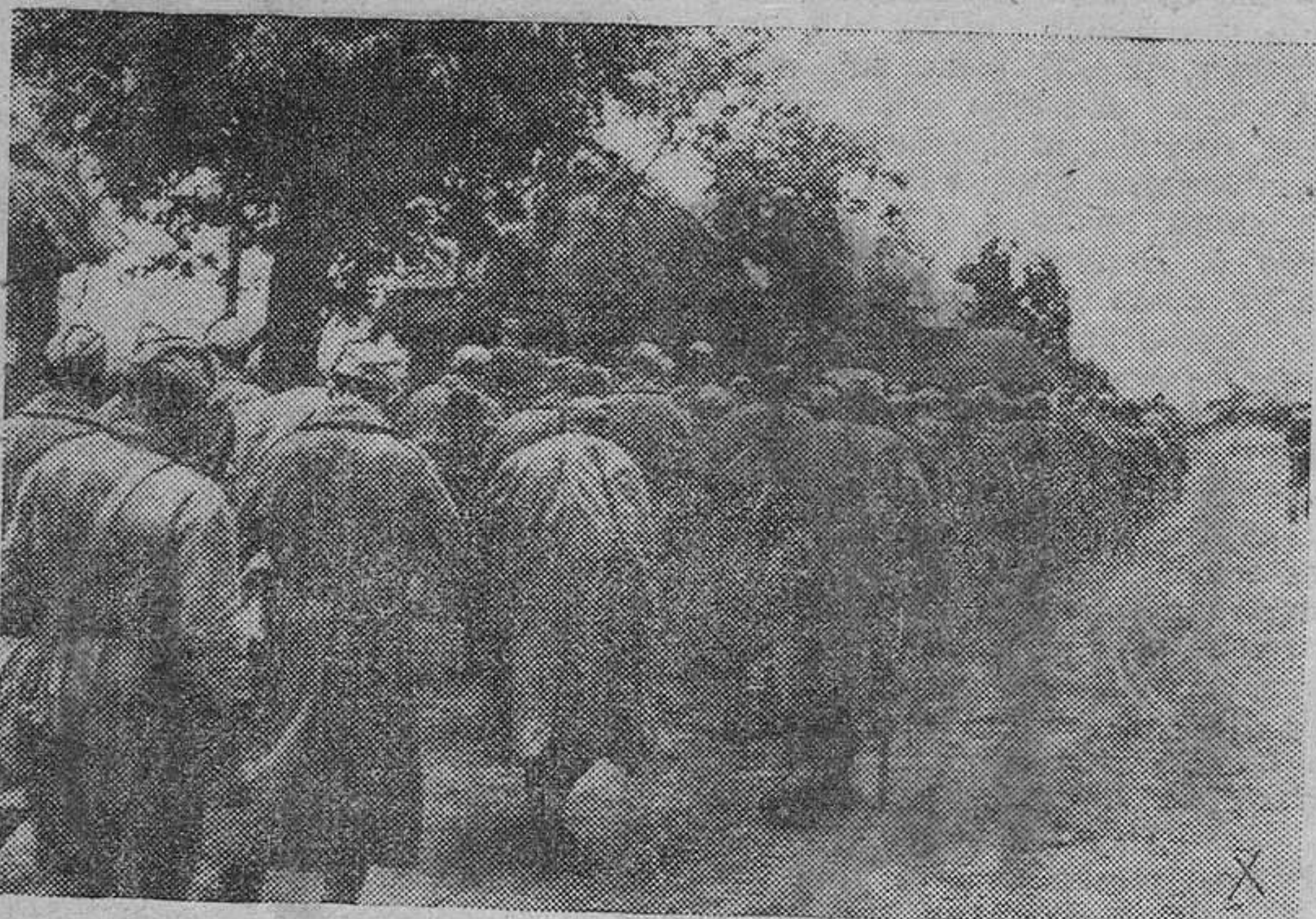
Largas columnas de prisioneros soviéticos son conducidos a las líneas de retaguardia alemana para su internamento en campos de concentración