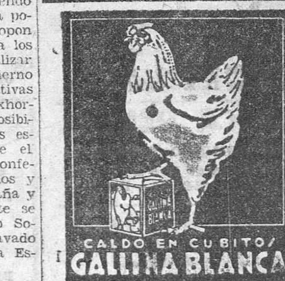
CALDO EN CUBITO GALLINA BLANCA