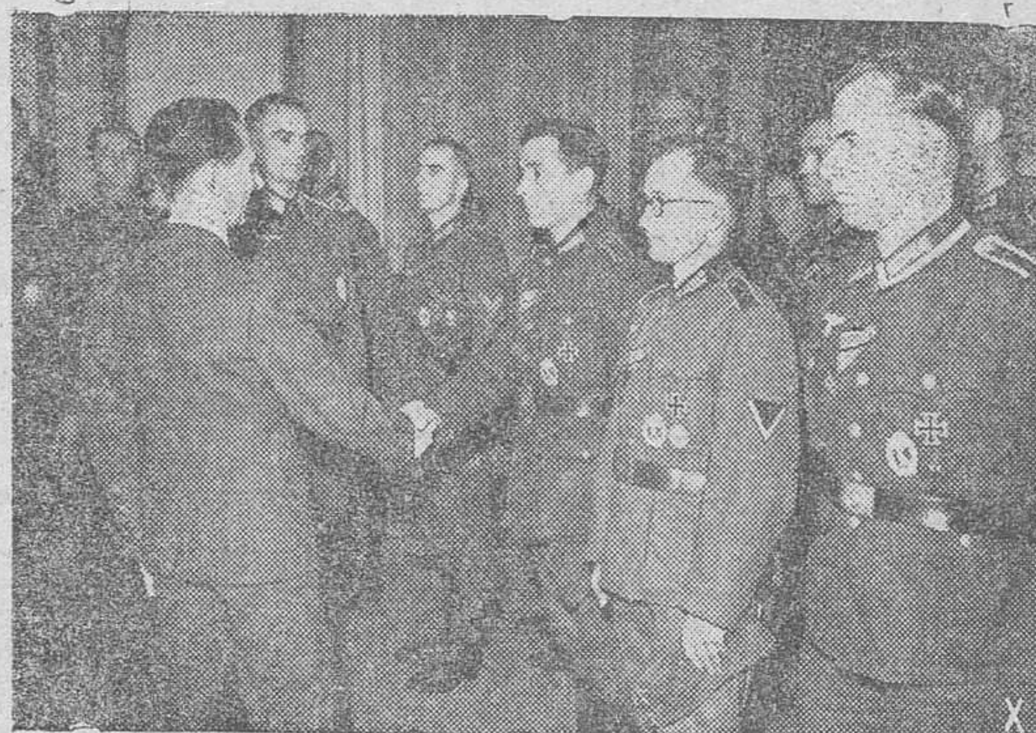
El ministro alemán Dr. Goebbels recibe a los combatientes de Roshew, que visitan actualmente Berlín, invitados por el ministro

Madrid.— Han llegado esta mañana, procedentes de Alemania, los niños españoles que, llevados a Rusia por los marxistas, fueron recientemente rescatados por el ejército alemán, en uno de sus heroicos avances.