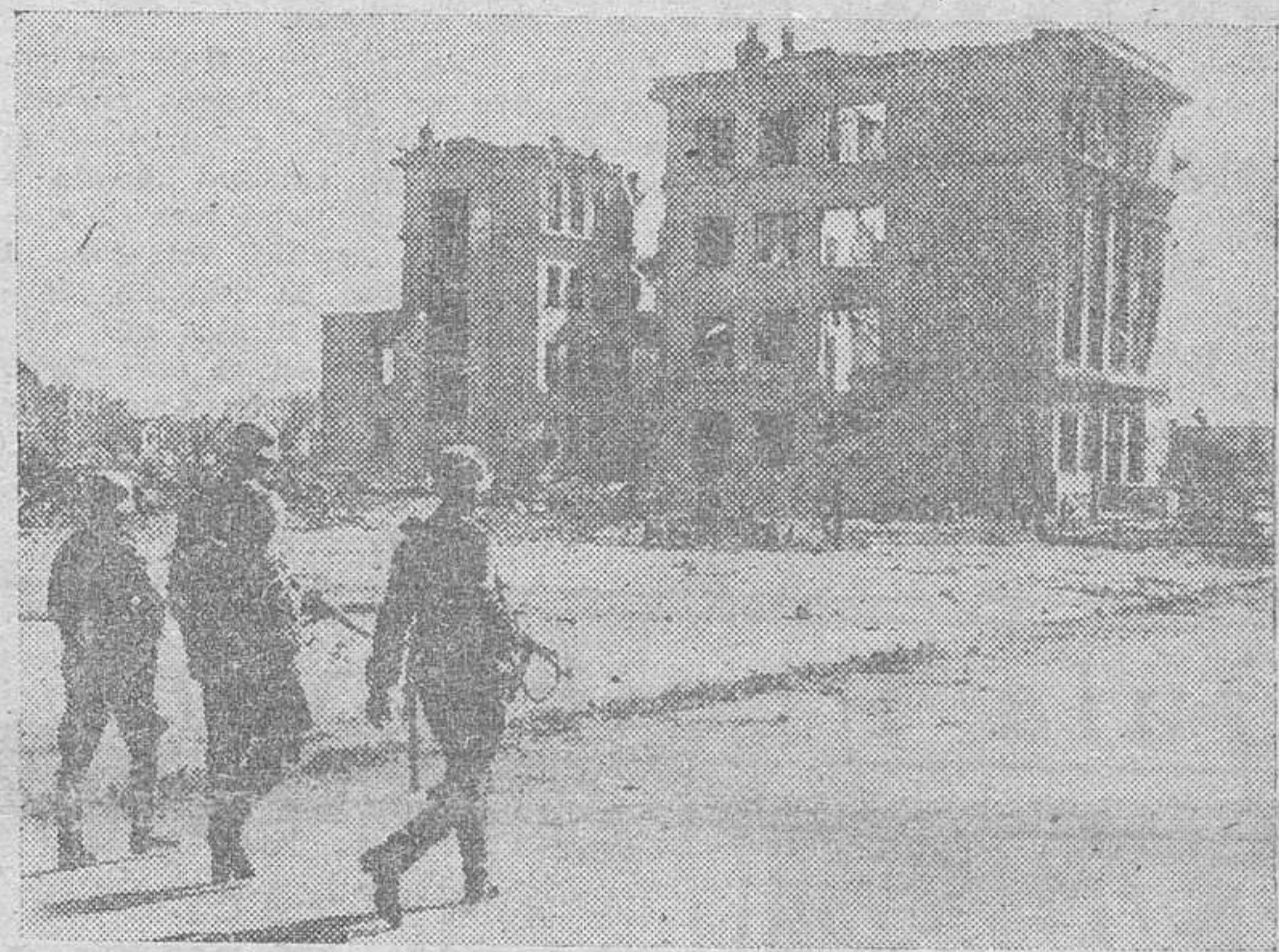
Los soldados alemanes ocupan una manzana de casas donde se había hecho fuerte el enemigo