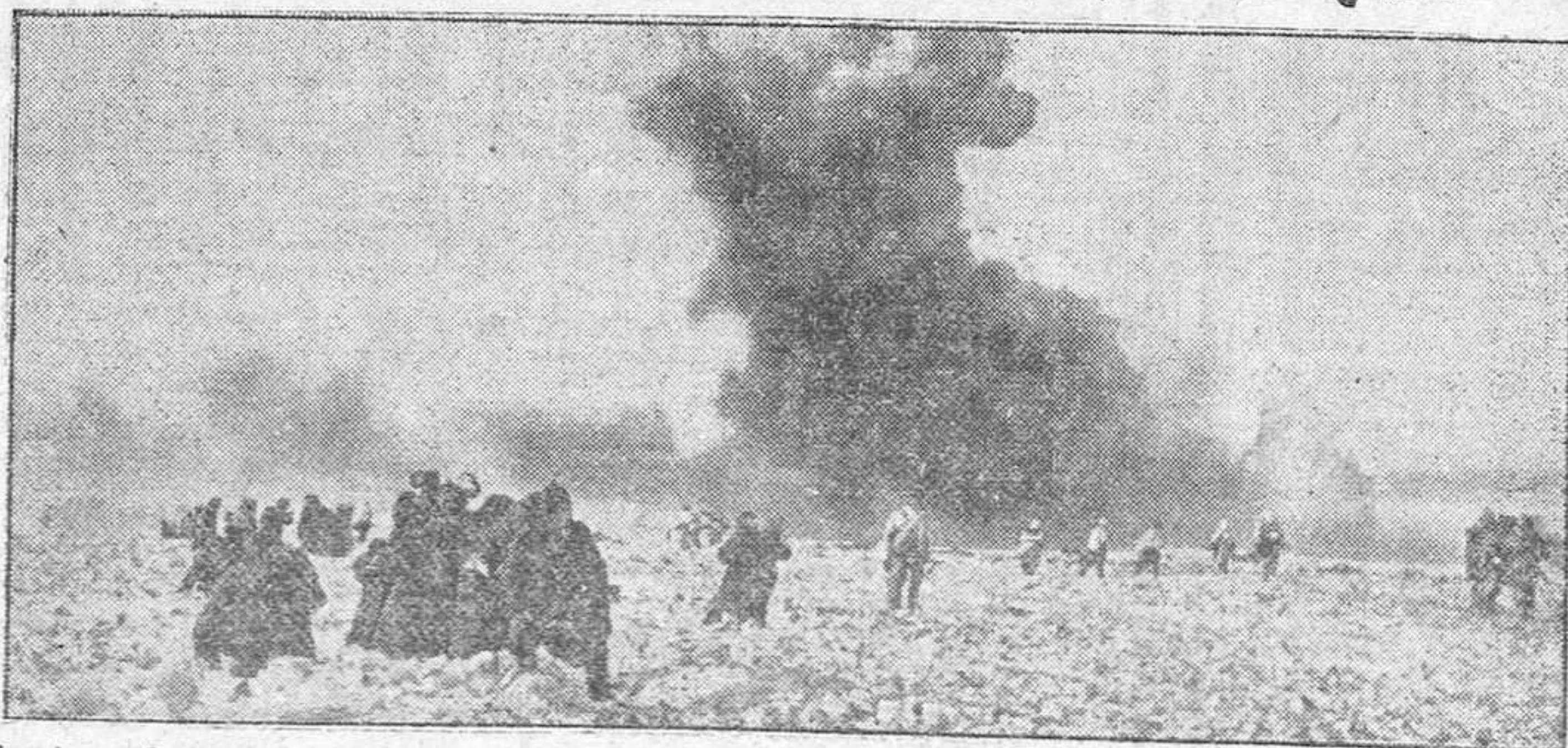
Infantes alemanes vuelven a sus posiciones después de rechazar un ataque bolchevique que han dejado en tanque incendiado en la refriega.