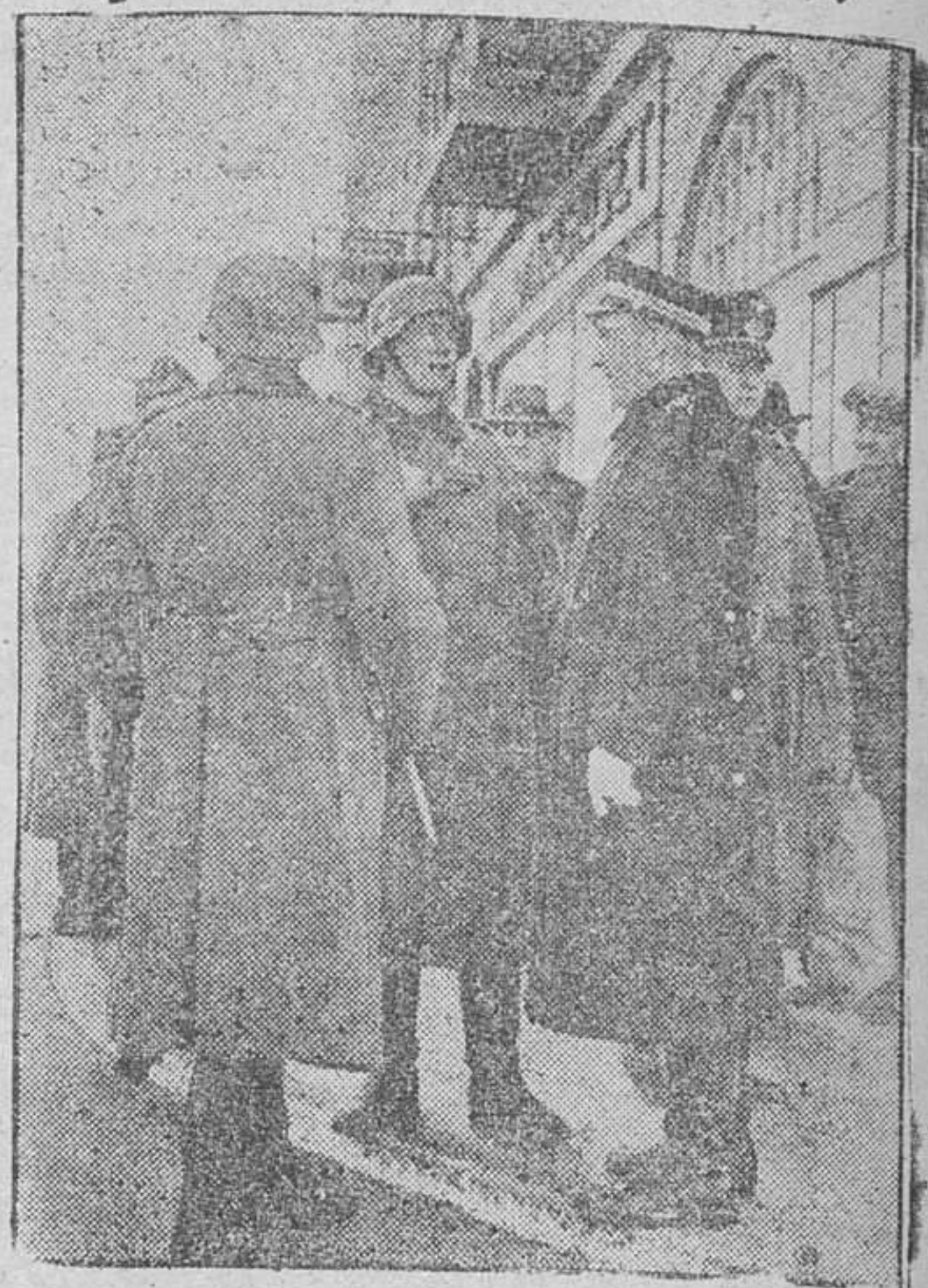
Claramente la da a entender esta foto legrada al azar en una de las calles de Copenhague. Por ello es cada vez mayor la unión de intereses entre Alemania y Dinamarca.