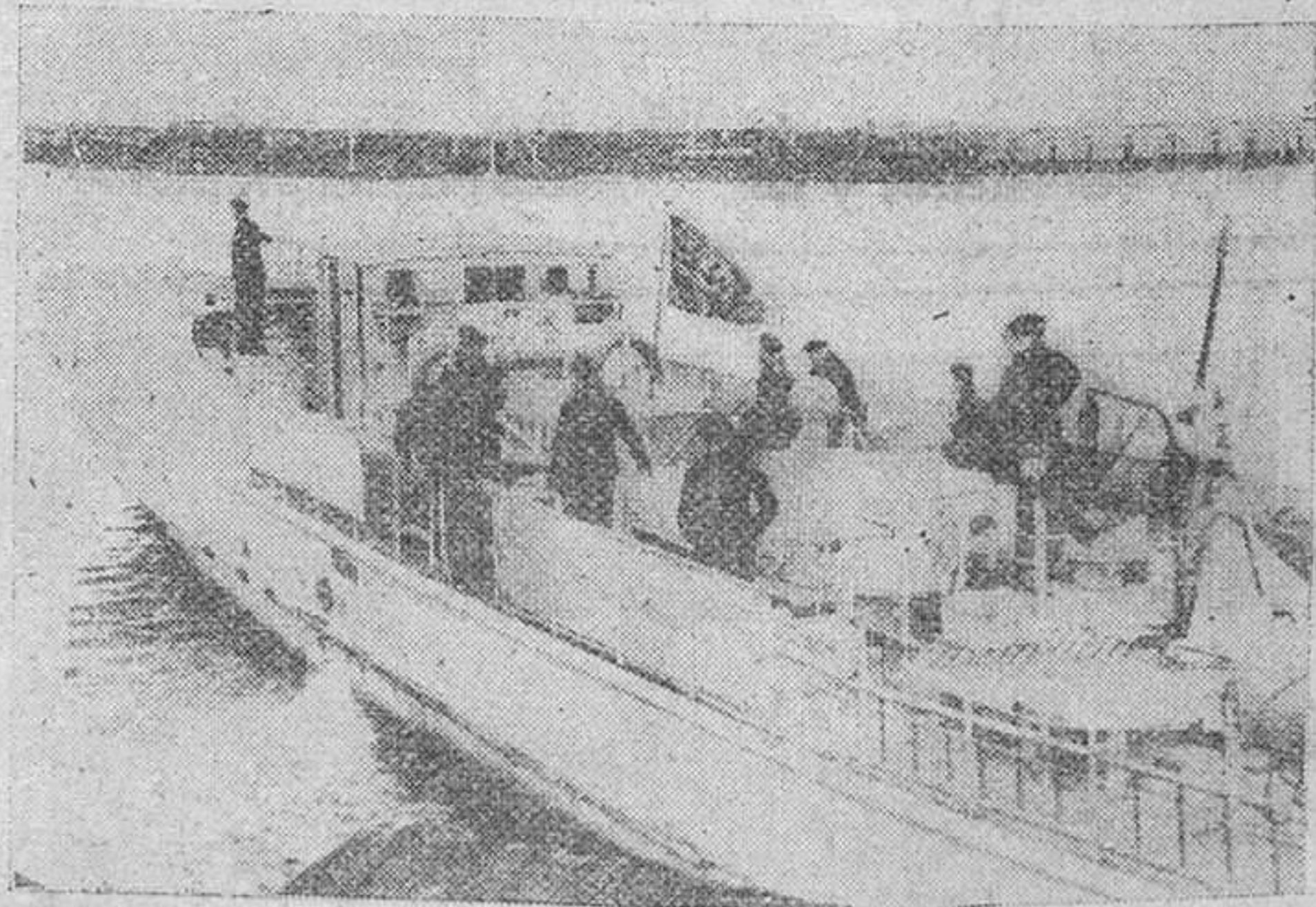
Una lancha rápida alemana vuelve a su base al almuerzo