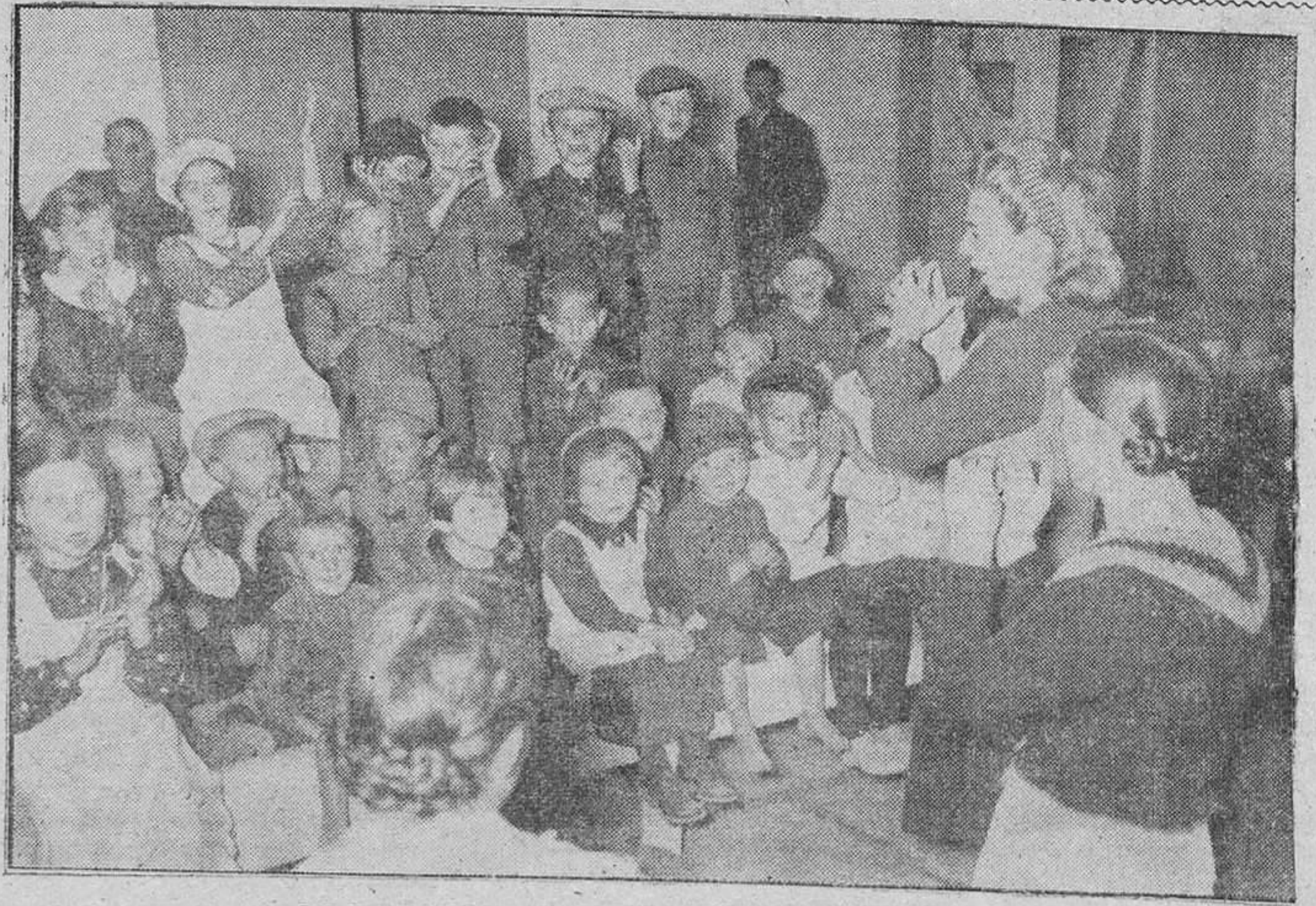
LAS GRANDES MIGRACIONES DE LA HISTORIA Los alemanes de Besarabia —unos 65.000— van a volver hacia el Gran Reich. Los grandes contingentes son concentrados en Galatz para seguir la vía fluvial del Danubio hasta la Patria. Los niños son acogidos por la Organización Femenina del Reich, que tiene a su cargo atenderlos en todo. En la foto, recitando las oraciones del día

Por amor a España. Por amor hacia las muchas criaturas que su fren hoy los rigores de una estructura injusta de la vida. Por el resurgir pujante de todos los sectores de la Patria Y, finalmente, por que a las órdenes de nuestro invicto Caudillo, cumplamos el mandato imperioso que nos ha legado lo más florido de la juventud que se nos fué en esta pasada contienda.