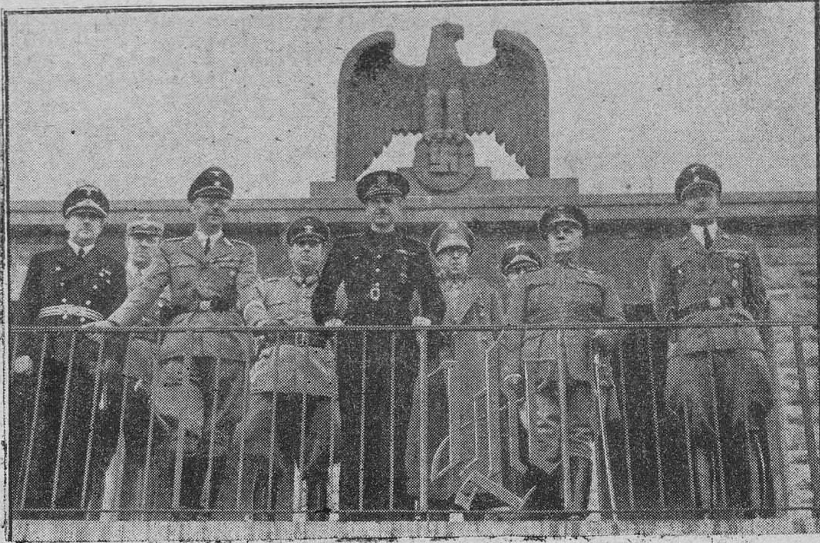
EL MINISTRO ESPAÑOL, SERRANO SUÑER Visitando las instalaciones de la Policía Alemana y del Estandarte de la Compañía de Escolta Personal del Führer Adolf Hitler, acompañado del Jefe de la Policía alemana, Himmler y del Embajador de España en Berlín, General Espinosa de los Monteros y otras personalidades.

de gran porvenir a 25 metros del paseo de los Vadillos, se vende en extensión de 11.650 metros, a bajo precio. Razón: Lain-Calvo, 36, 2ª derecha.