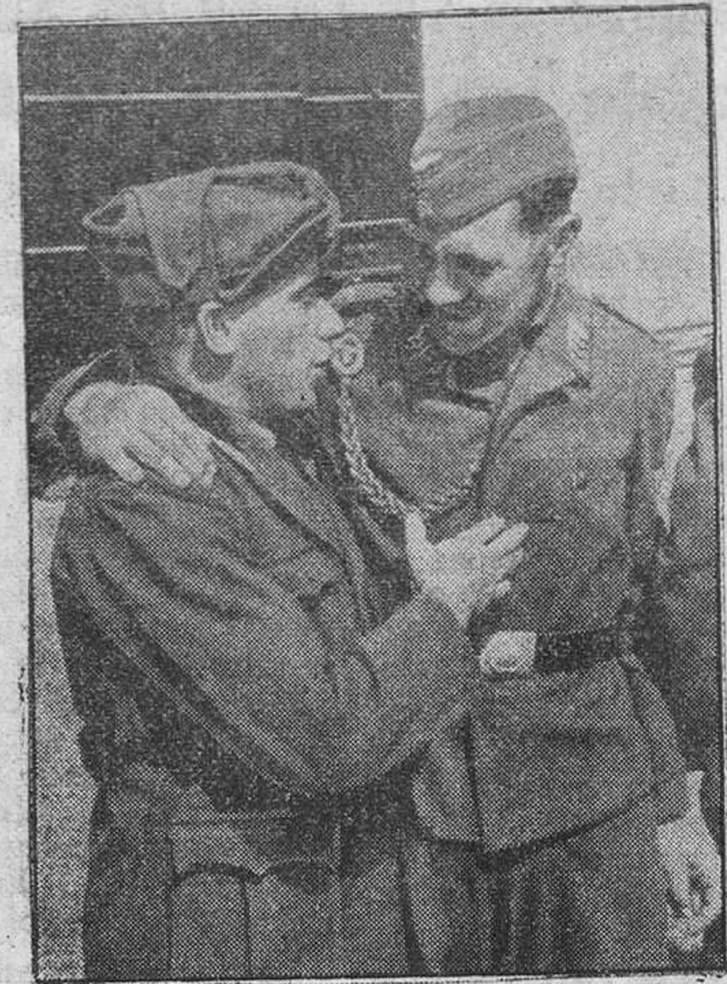
DOS HERMANOS DE ARMAS. Un soldado alemán y un italiano. Luchan por el mismo ideal de una justicia basada en la Paz por el Pan, el Trabajo y la comprensión entre los pueblos tradicionales de su Historia.