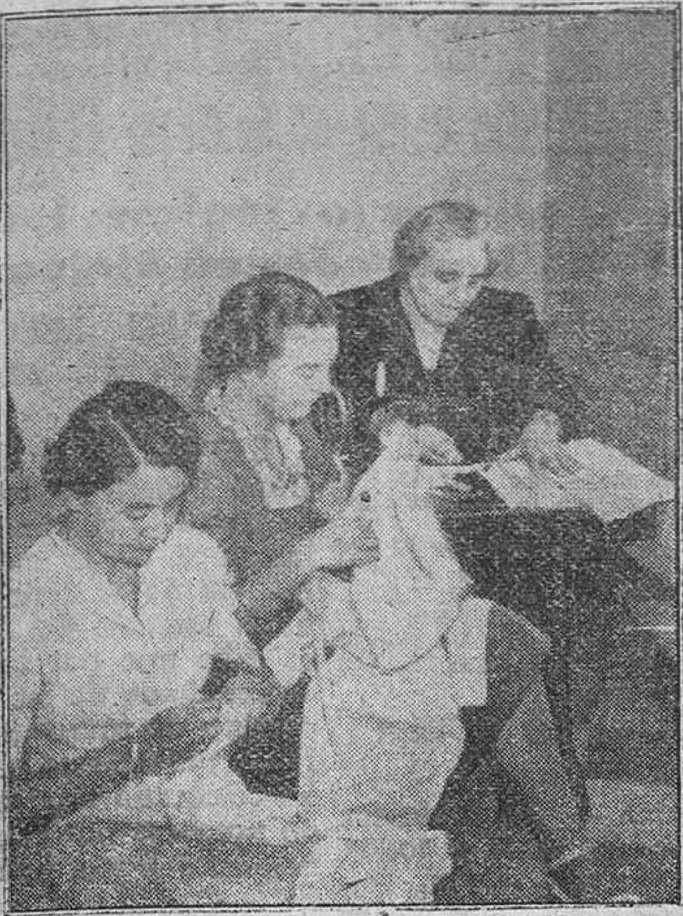
EL TRABAJO DE LA MUJER PARA LA GUERRA Mujeres de la Colonia Alemana, de Roma, trabajando al servicio de la Cruz Roja Italiana. Este trabajo es voluntario y gratuito en absoluto.