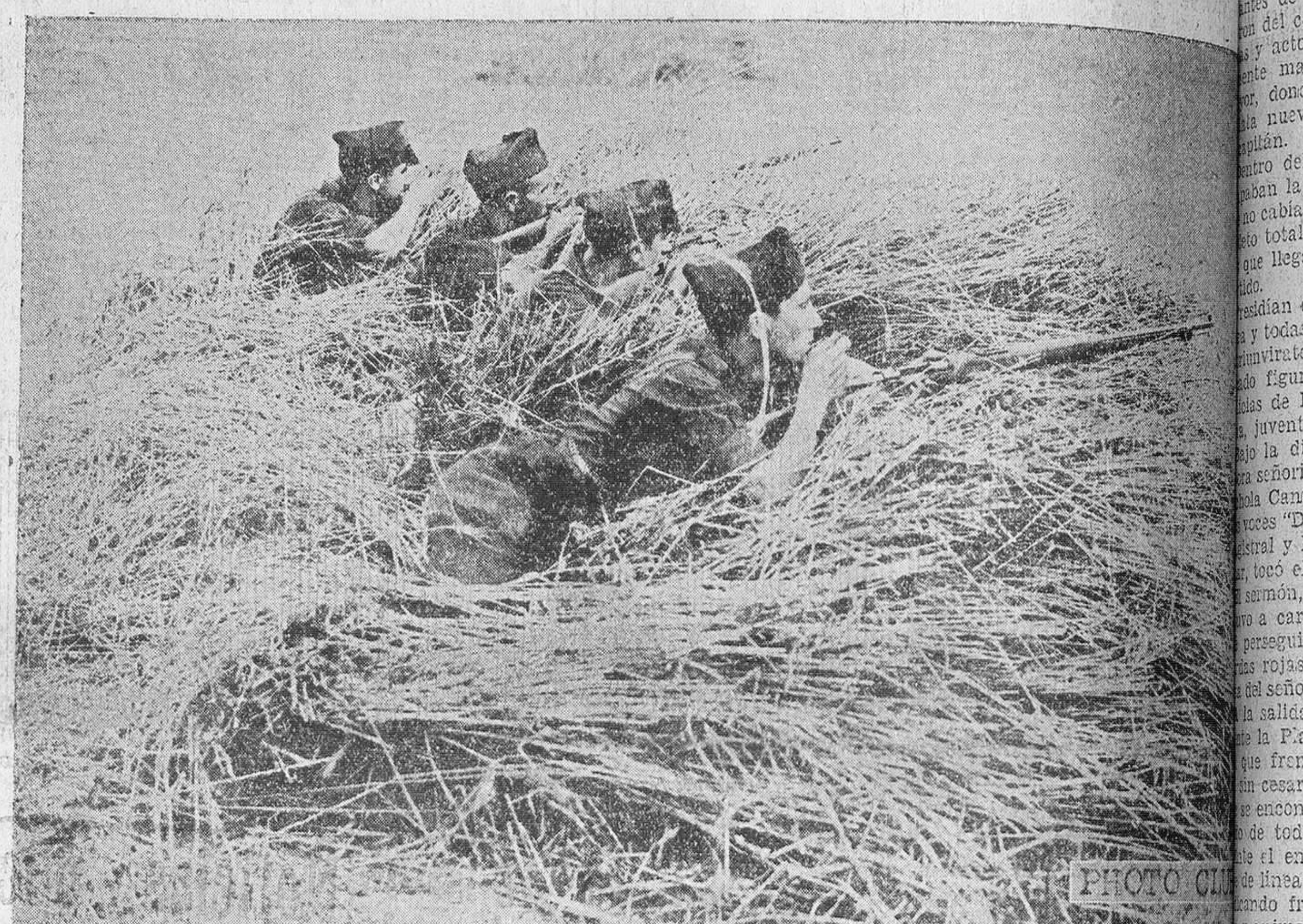
Los trigos sirven de admirable resguardo a estos bravos milicianos