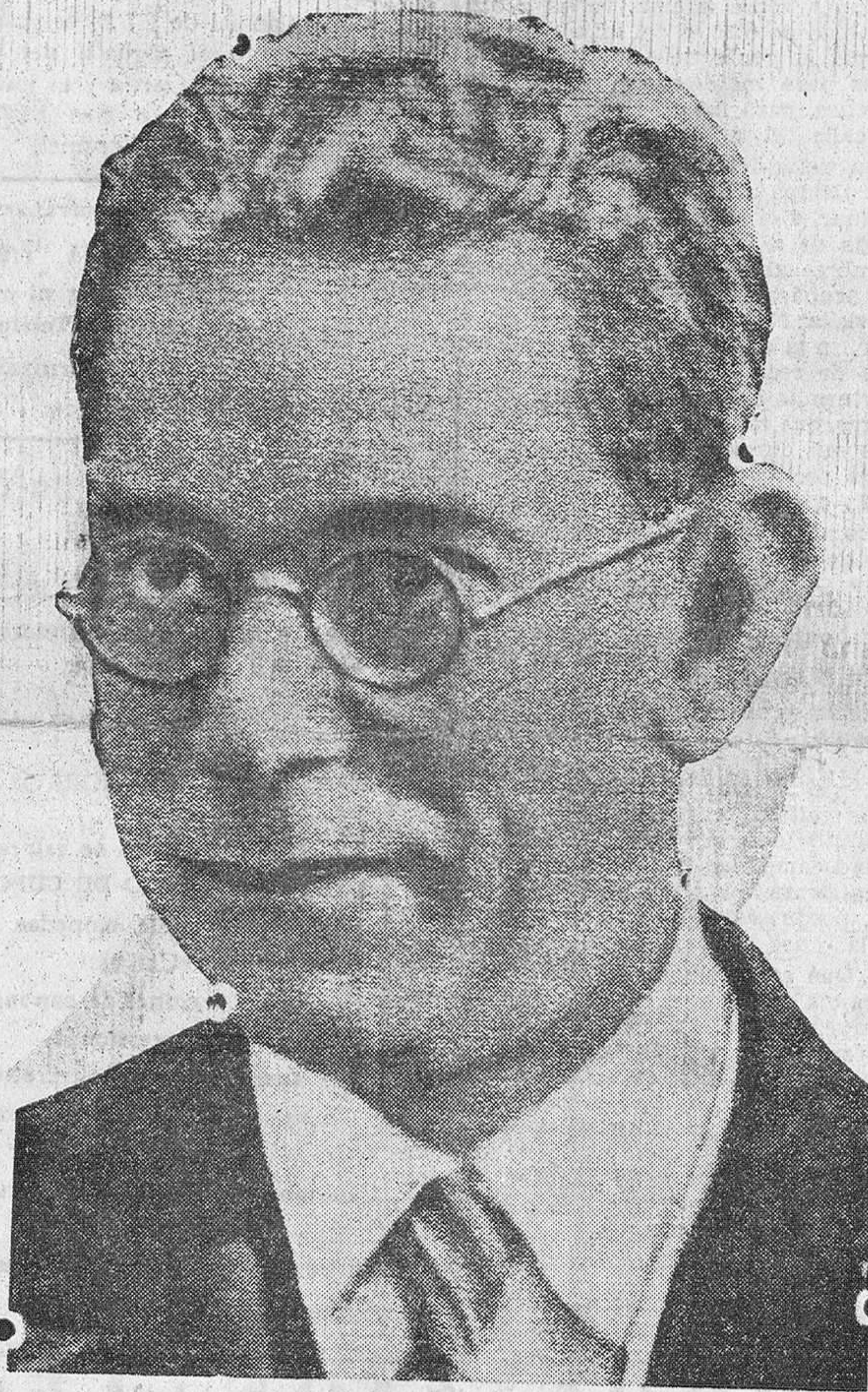
El general D. Emilio Mola, jefe del Ejército del Norte y miembro de la Junta de Defensa Nacional