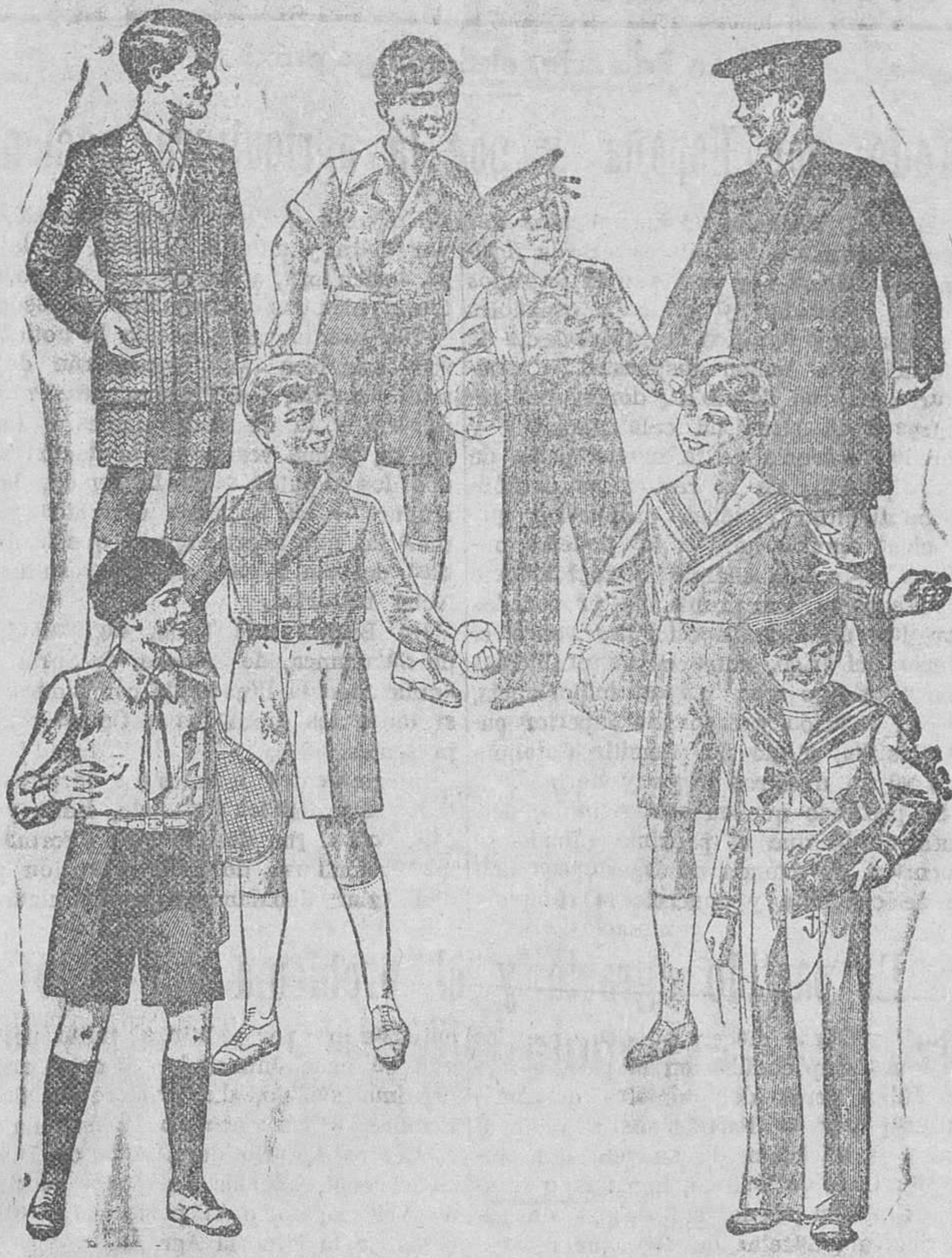
20 modelos distintos de trajecitos de 15, 20, 25, 30, 40 y 50 pesetas. Modelos novedad - Siempre grandes surtidos

Primera casa en tejidos y confecciones para caballero, señora, jóvenes y niños PAÑERIAS - SASTRERIAS - CALZADOS SEGARRA Plaza Mayor, 42, LAIN-CALVO, 9 y 11.-Sucursal: Plaza Mayor, 8, Burgos