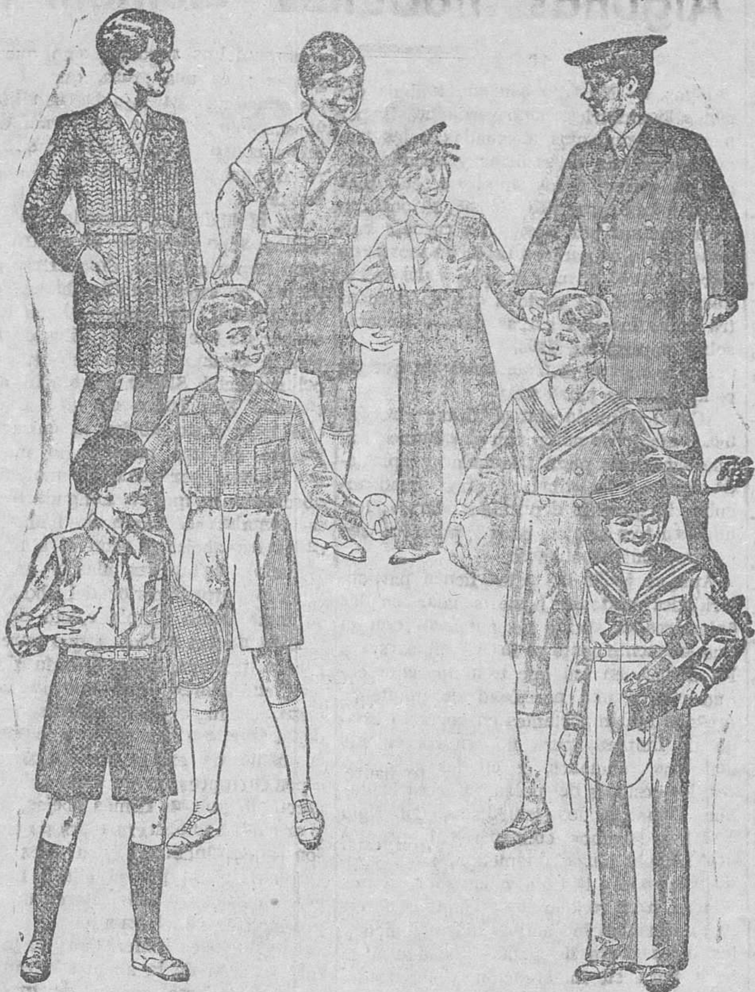
20 modelos distintos de trajecitos de 15, 20, 25, 30, 40 y 50 pesetas. Modelos novedad - Siempre grandes surtidos

Plaza Mayor, 42, Lain-Calvo, 9 y 11.-Sucursal: Plaza Mayor, 8, Burgos