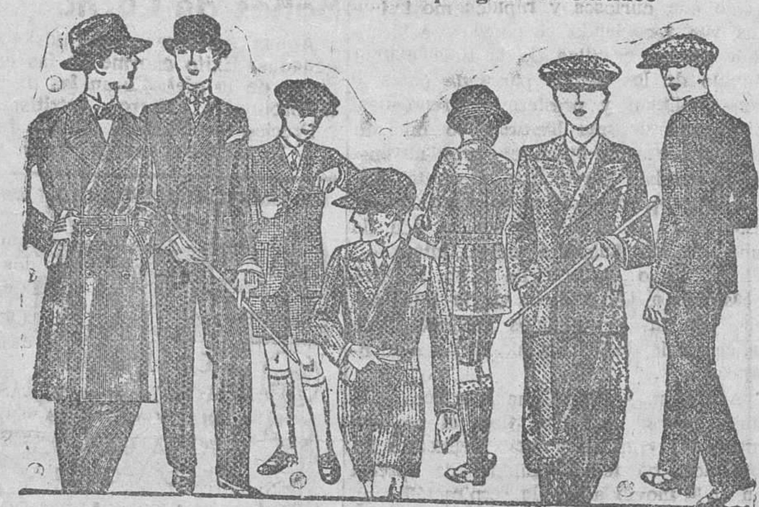
TRAJES para mocetes todos los gustos, edad de 10 a 16 años, a 30, 40, 50 y 70 pesetas. TRAJES, pantalón mokel, desde 35 a 75 pesetas. La casa que más barato vende y más surtido presenta