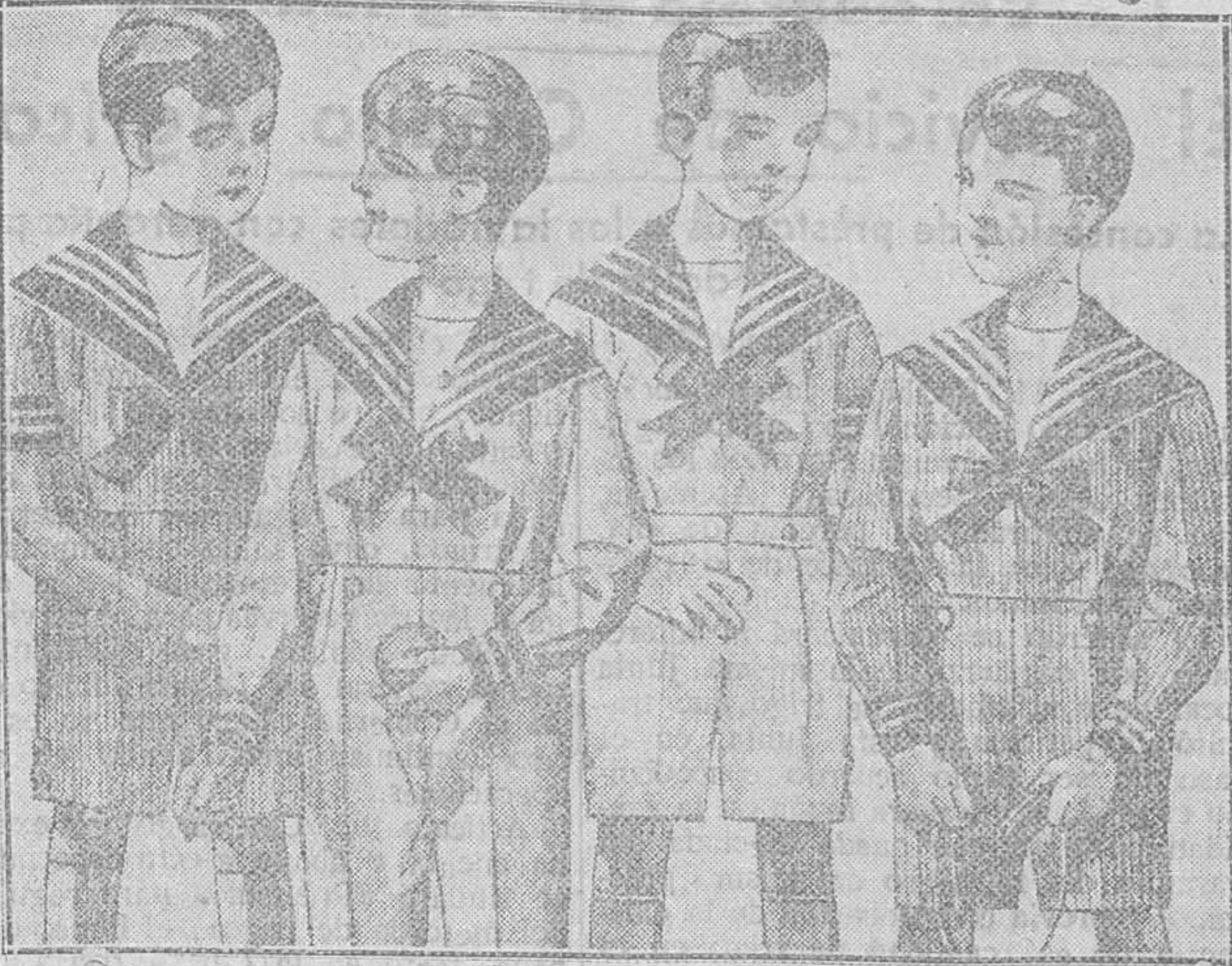
Trajes de drill mil rayas - Todas las edades - Desde 14 a 25 pesetas Sección especial a la medida

Plaza Mayor, 42, Lain-Calvo, 9 y 11.-Sucesor: Plaza Mayor, 8, Burgos