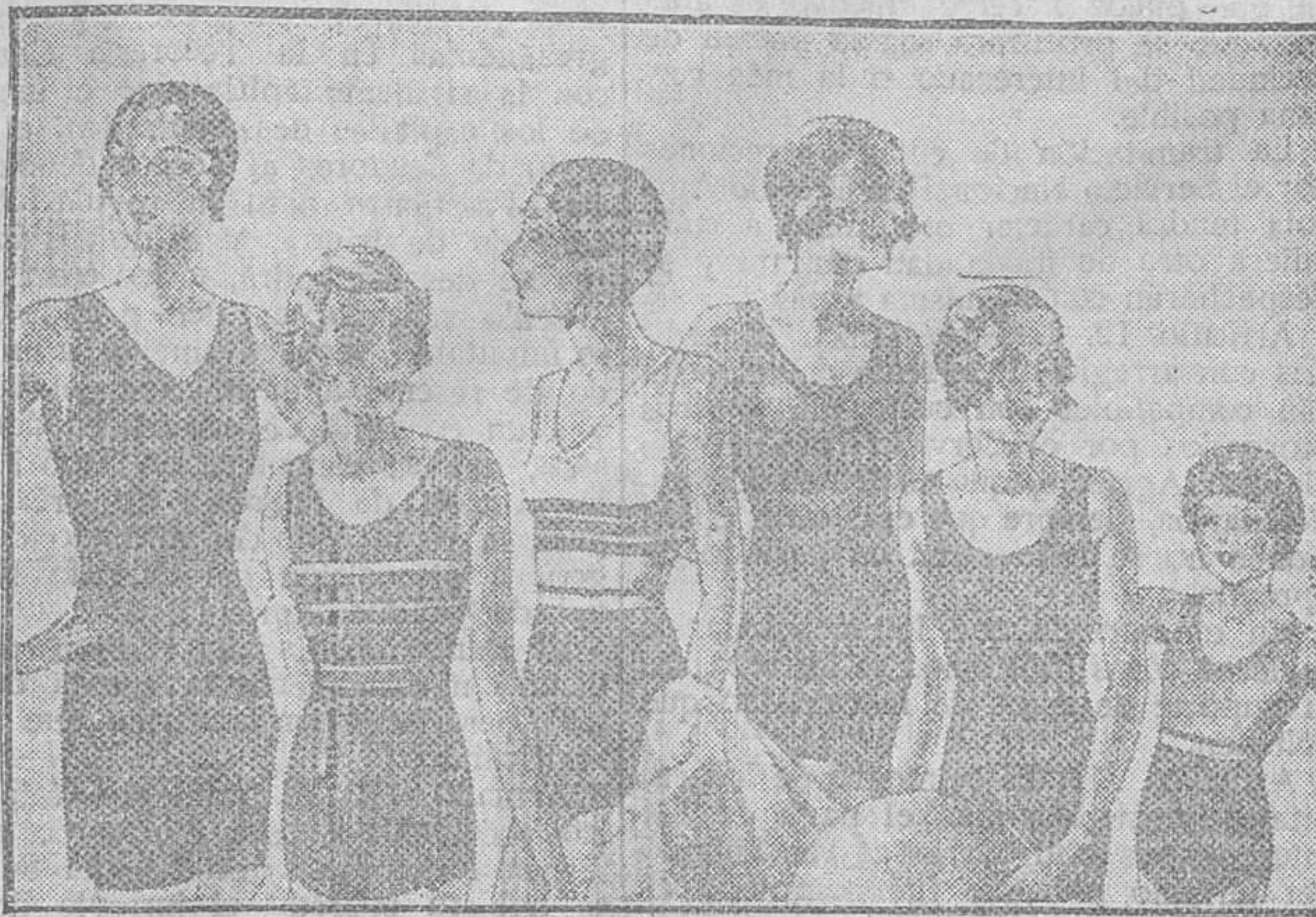
Trajes de baño, diversidad de modelos, en algodón y lana, a pesetas 3'50, 4, 5, 6, 8, 10 y 15