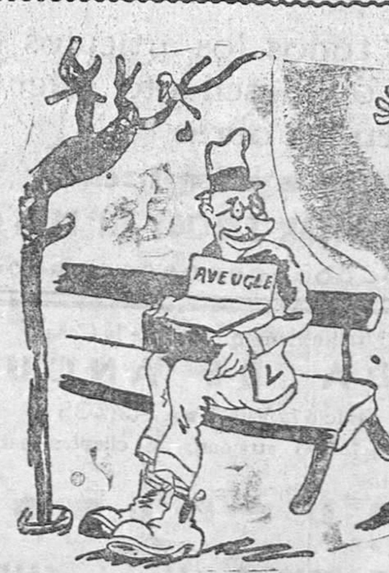
El ciego (a su camarada).—¿Cuánto tiempo sin vernos!

SE LES ADVIERTE QUE NO SE DEVUELVEN LOS ORIGINALES NI SE SOSTIENE — CORRESPONDENCIA —