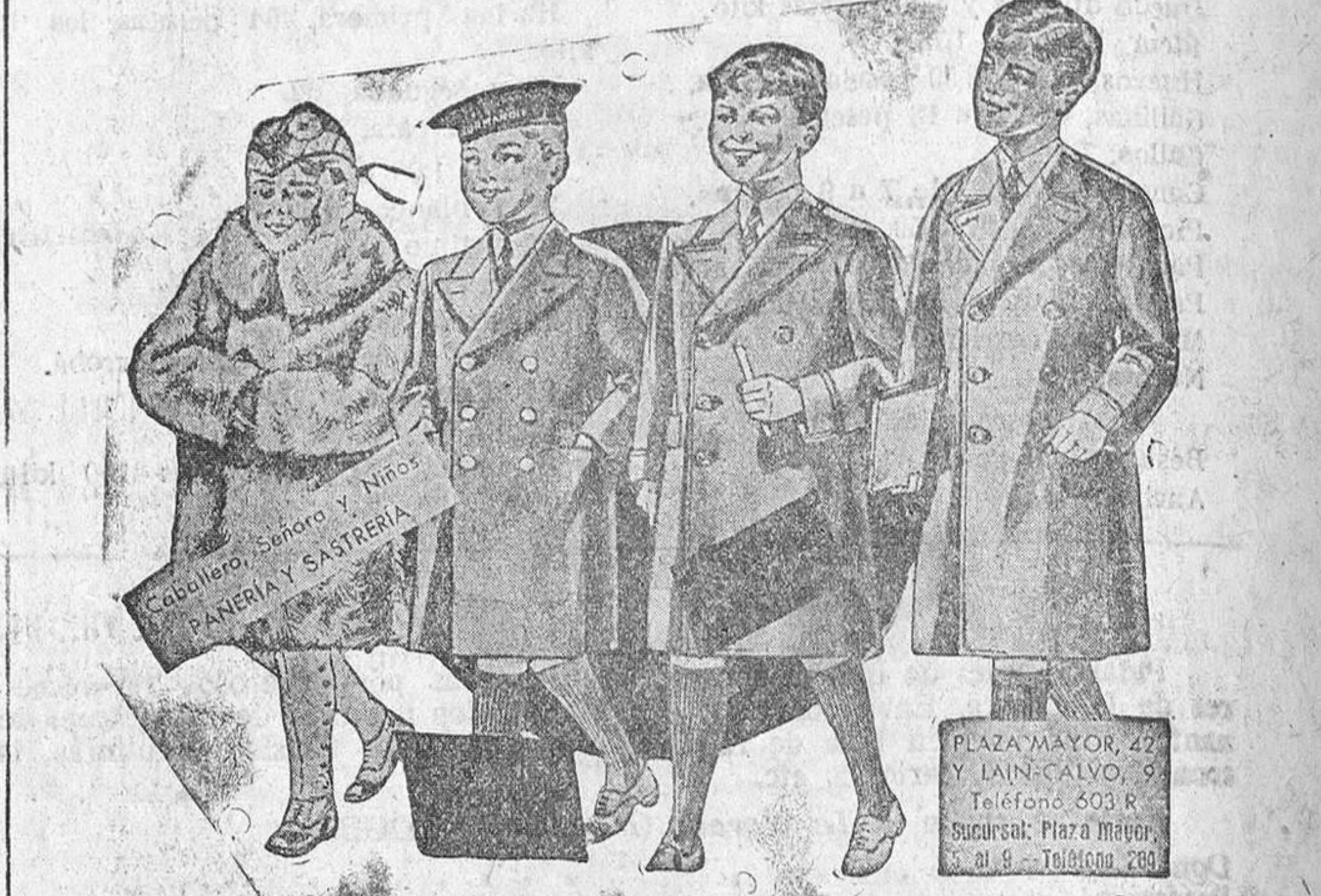
Abriguitos para niños, modelos novedad, de 15, 18, 20, 25 y 30 pesetas.

Primera casa en confecciones para señora, caballero y niño Plaza Mayor, 42, Lain-Calvo, 9 y 11.-Sucursal: Plaza Mayor, 6, Burgos Teléfono, 603-R. Teléfono, 284.