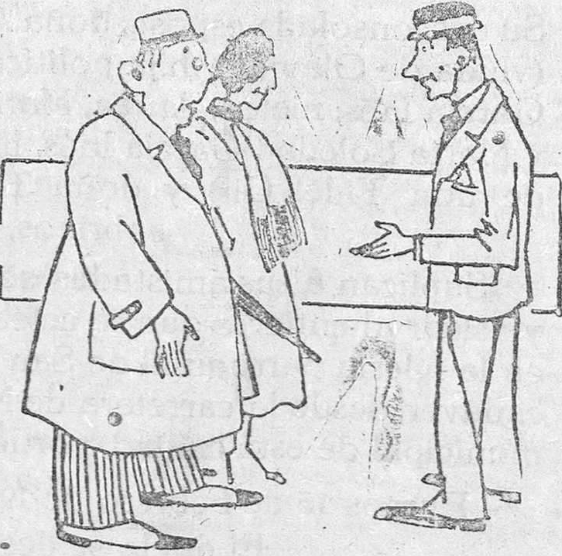
—El lunes te estuvimos esperando a almorzar. ¿Por qué no viniste? —Porque el lunes tenía un hambre horrible, chico.