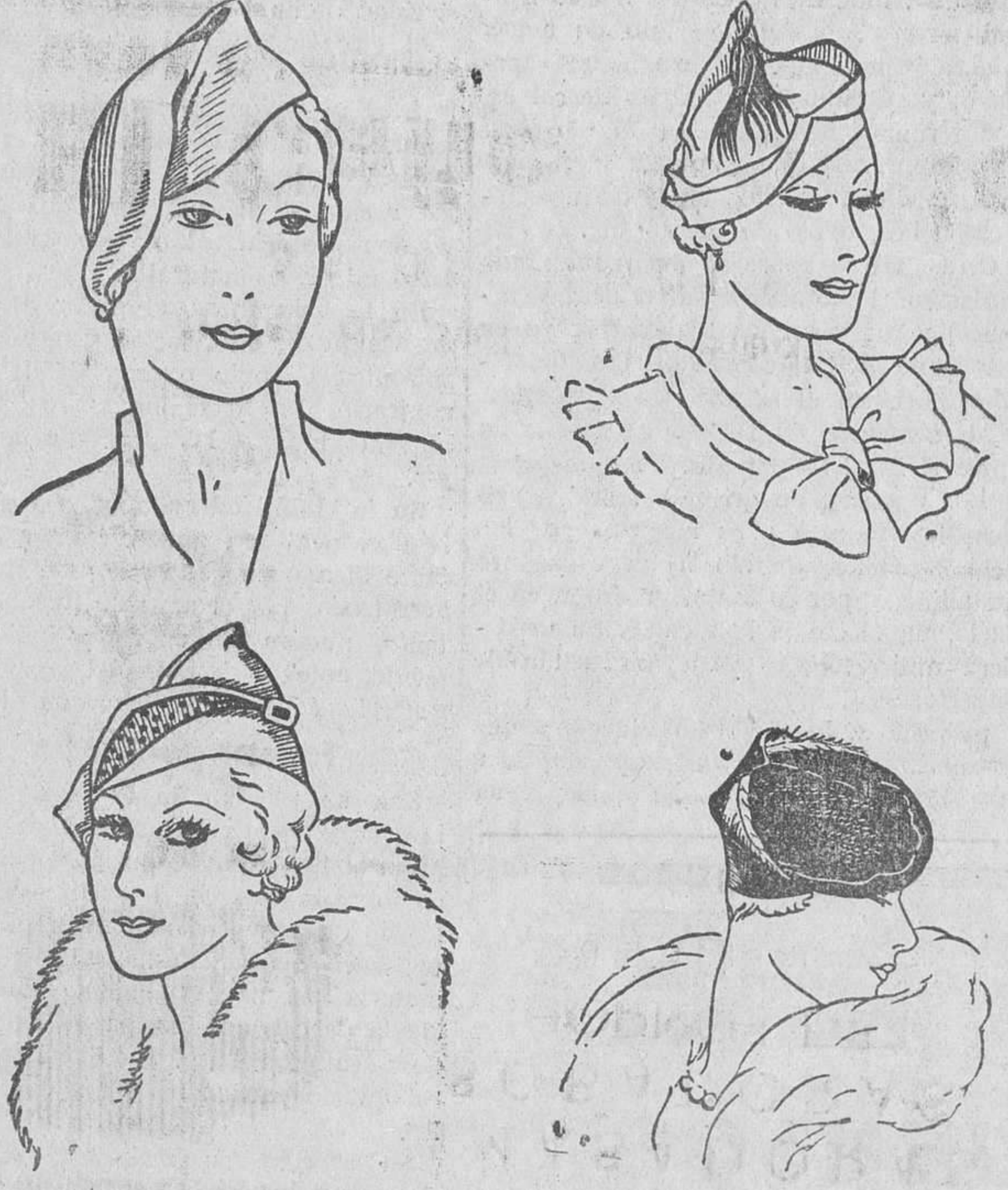
Algunos de los modelos que presenta en la actual temporada

AMASADORAS SOBADORAS HORNOS DE DANADERIA Lo más perfecto y económico Bombas para todos usos Adobadoras para embutidos Constructor: ISIDORO JOVER.—Logroño