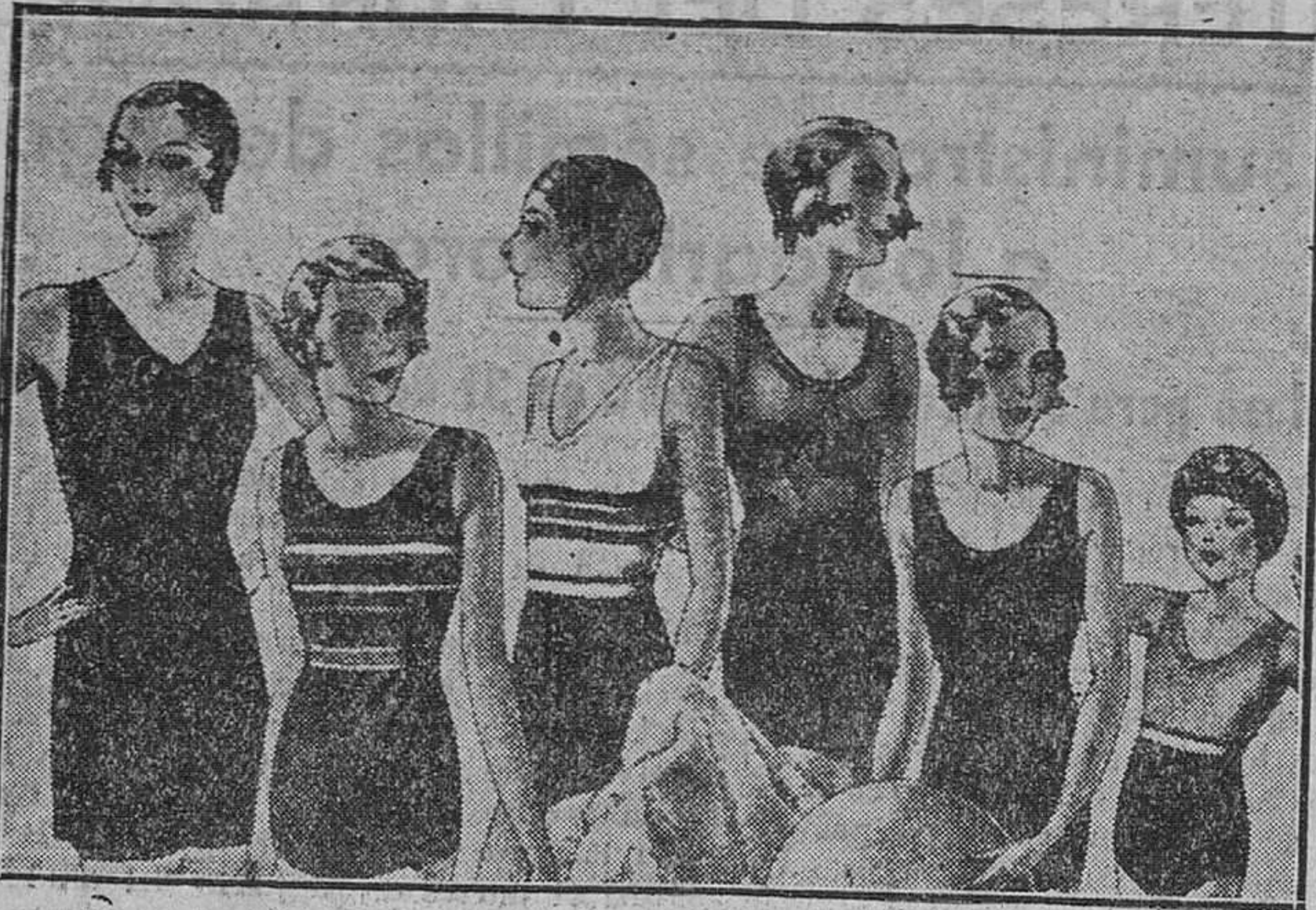
Trajes de baño en lana o algodón para señora, caballero o niños Pantalón de baño a 1,50, 1,75, 2 y 2,50

Primera casa en confecciones para caballero, señora y niños Plaza Mayor, 41. Lain-Calvo, 9 y 11.—Sucursal: Plaza Mayor, 6, Burgos Teléfono, 603-R Teléfono, 284