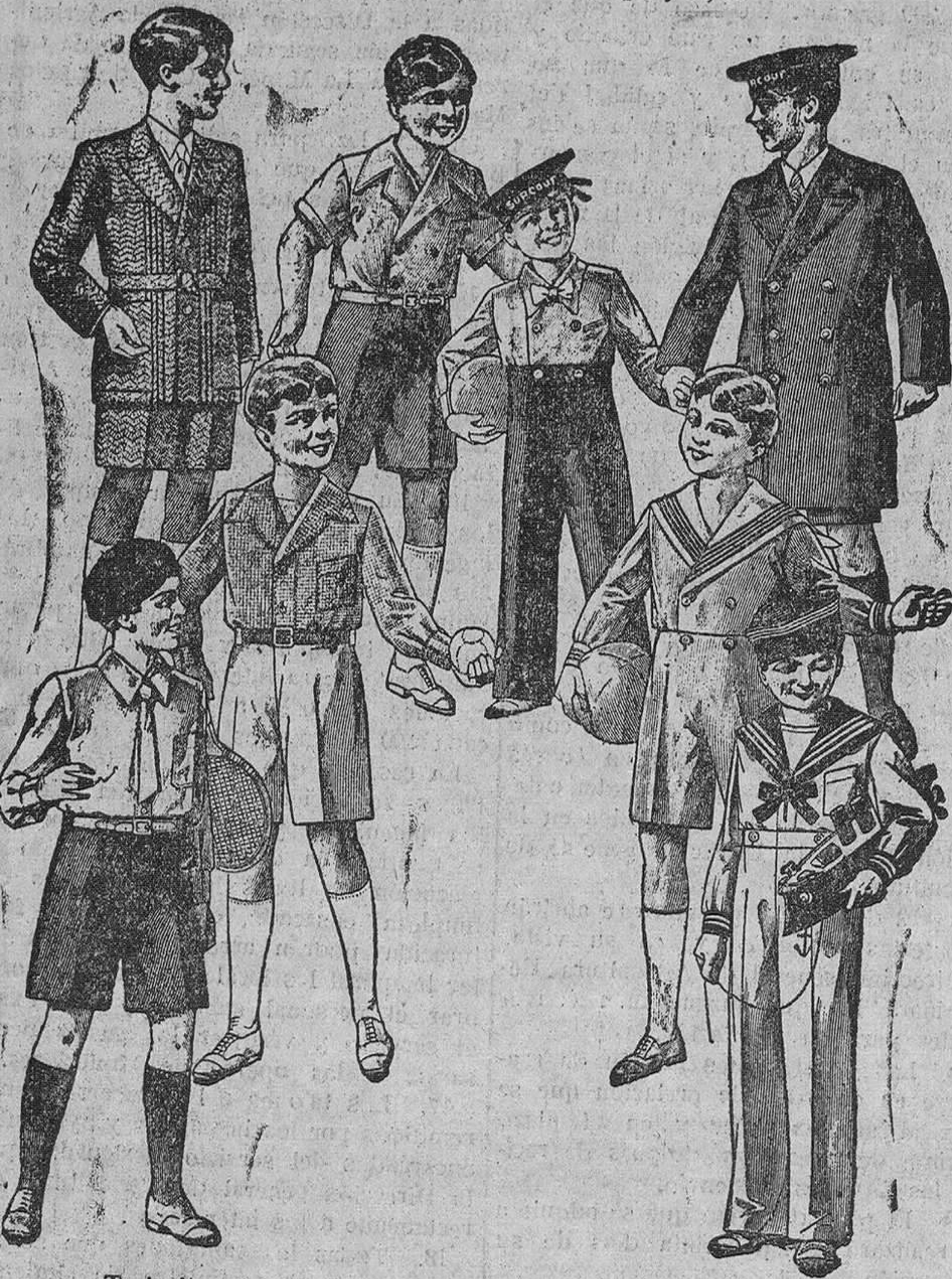
Trajecitos, modelos novedad, de 15, 18, 20, 25 y 30 pesetas La Casa que más surtido presenta y más barato vende