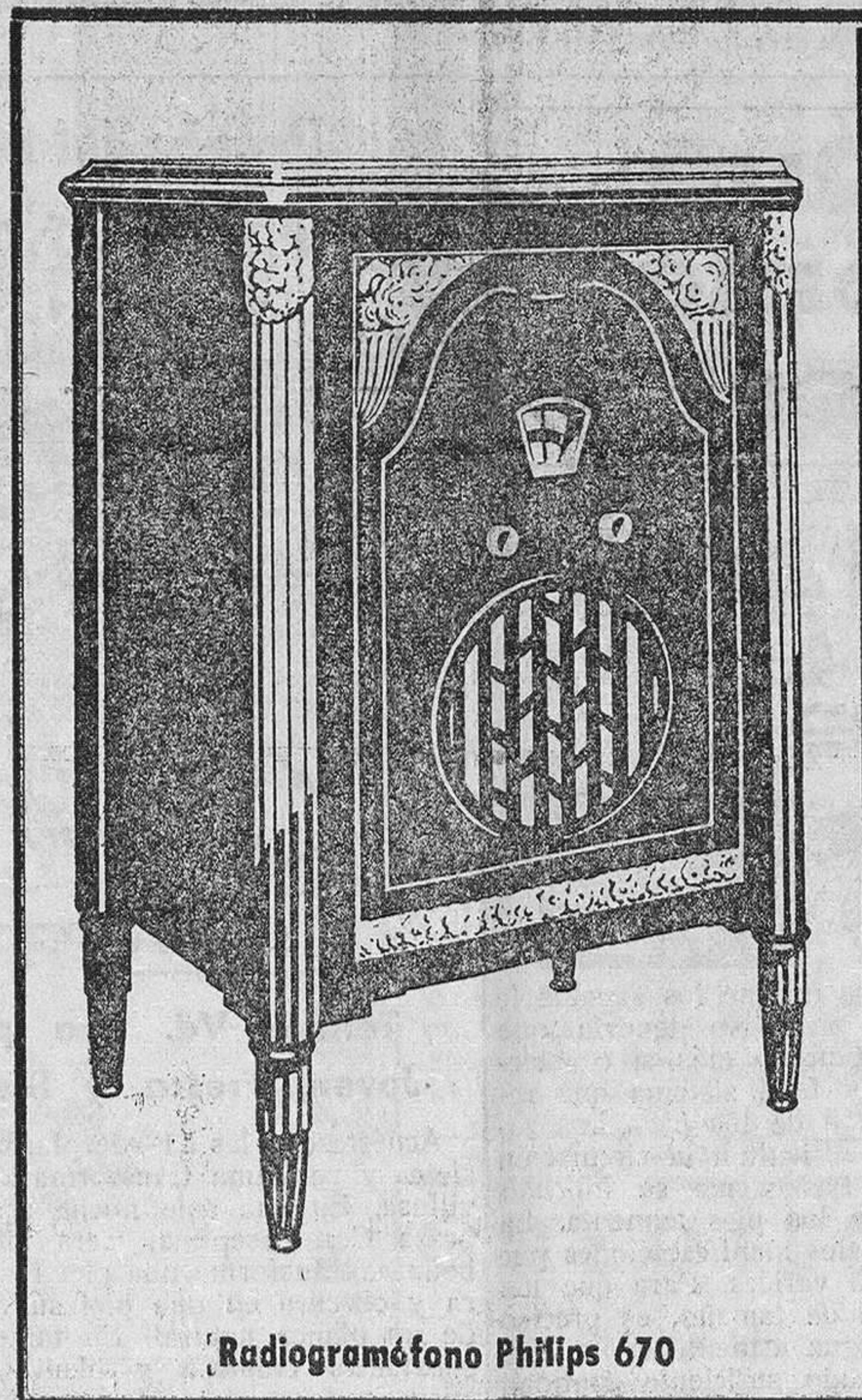
Radiogramófono Philips 670

Oígalos en la Representación Oficial de,