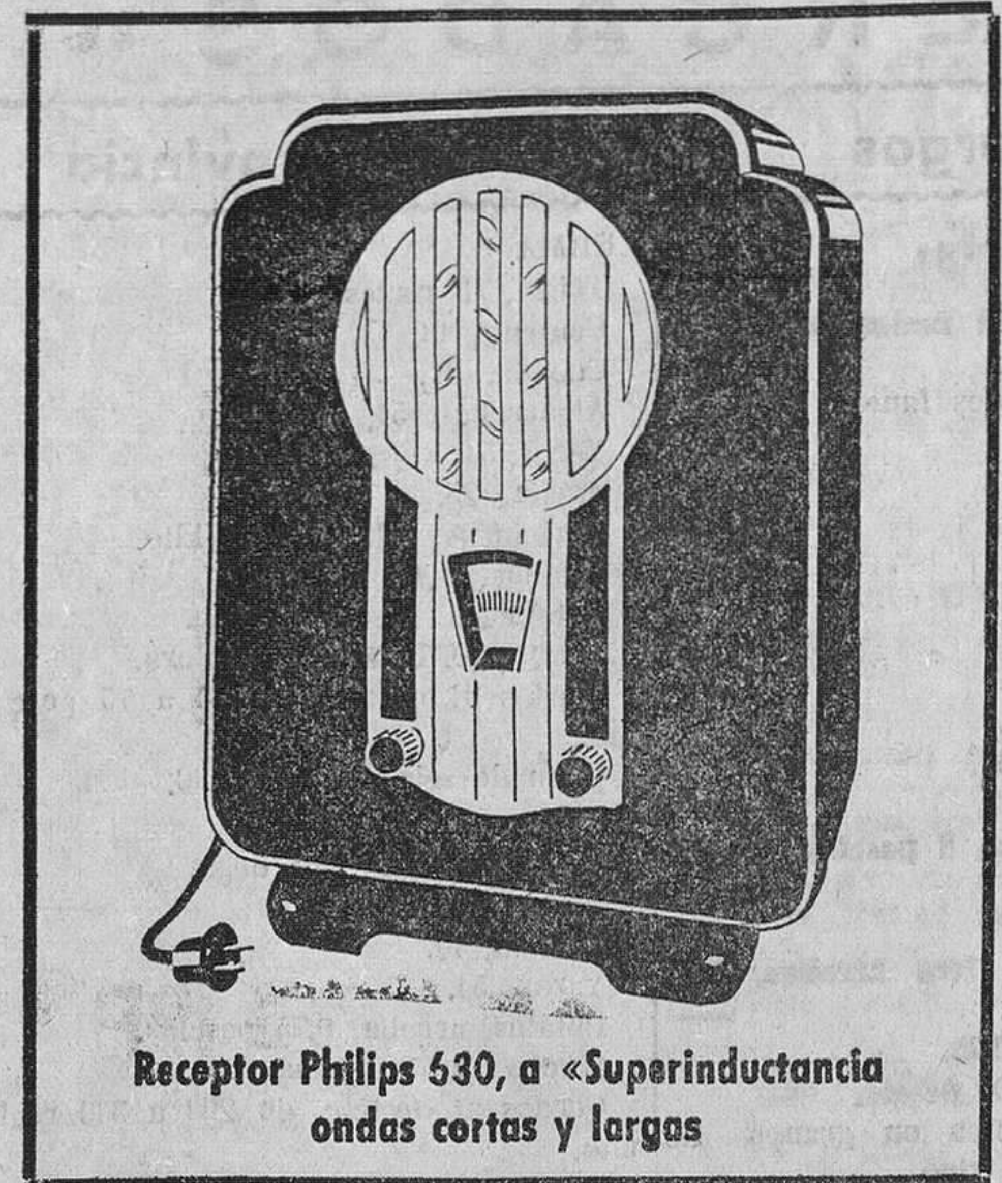
Receptor Philips 530, a «Superinductancia ondas cortas y largas»

Tenga en cuenta esto el decidirse a adquirir un receptor, y deducirá que solamente Philips puede ofrecerle la garantía de su perfecto funcionamiento, la bondad técnica de todos sus componentes fabricados por Philips, y sus inmejorables válvulas «Miniwatt» mundialmente conocidas por su duración y rendimiento.