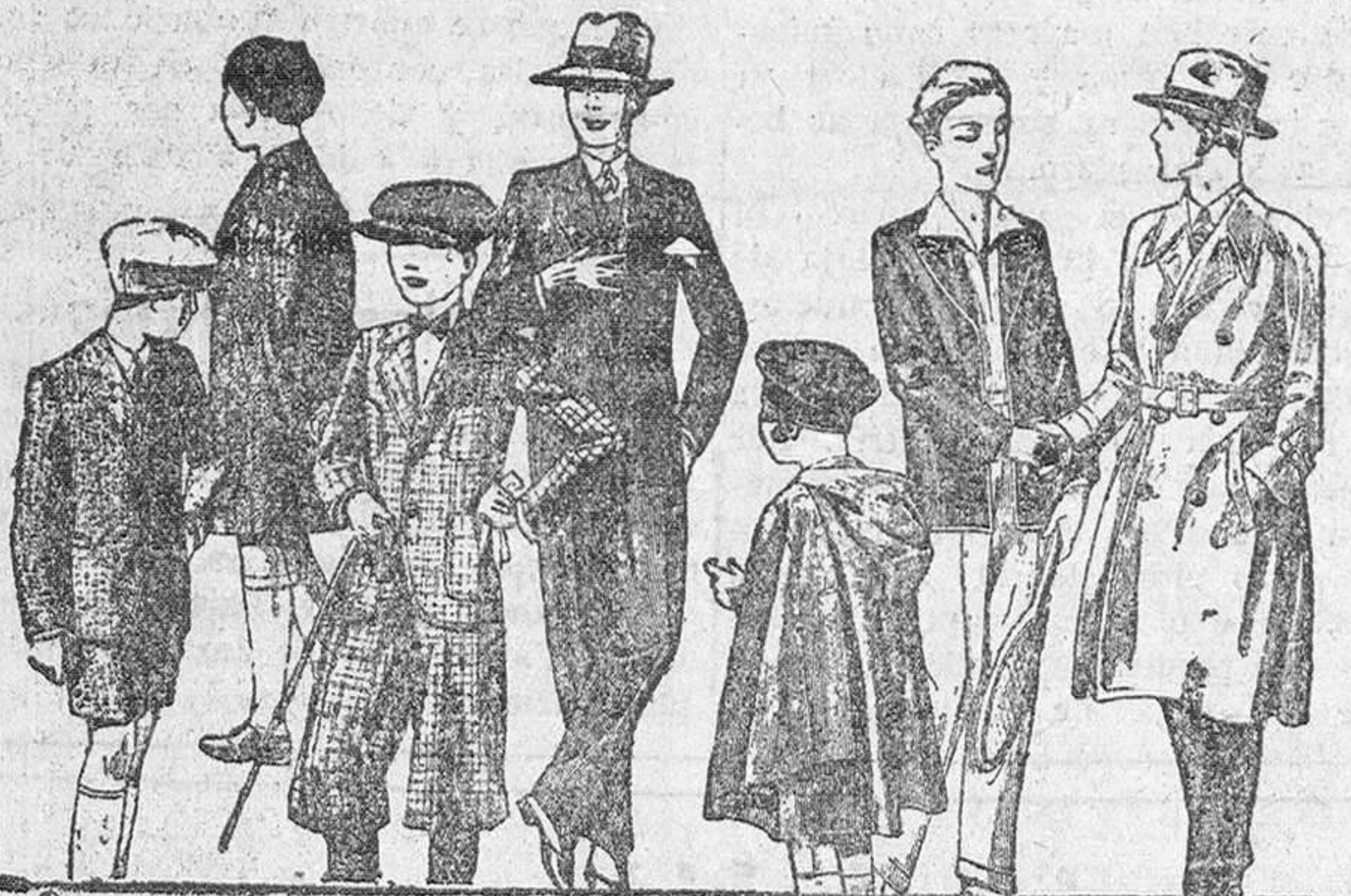
Abrigos y trajes de paño, modelos nuevos de 20, 25, 30, 35, 40 y 50 pesetas

Sección de material de oficina Casa especializada en estos artículos