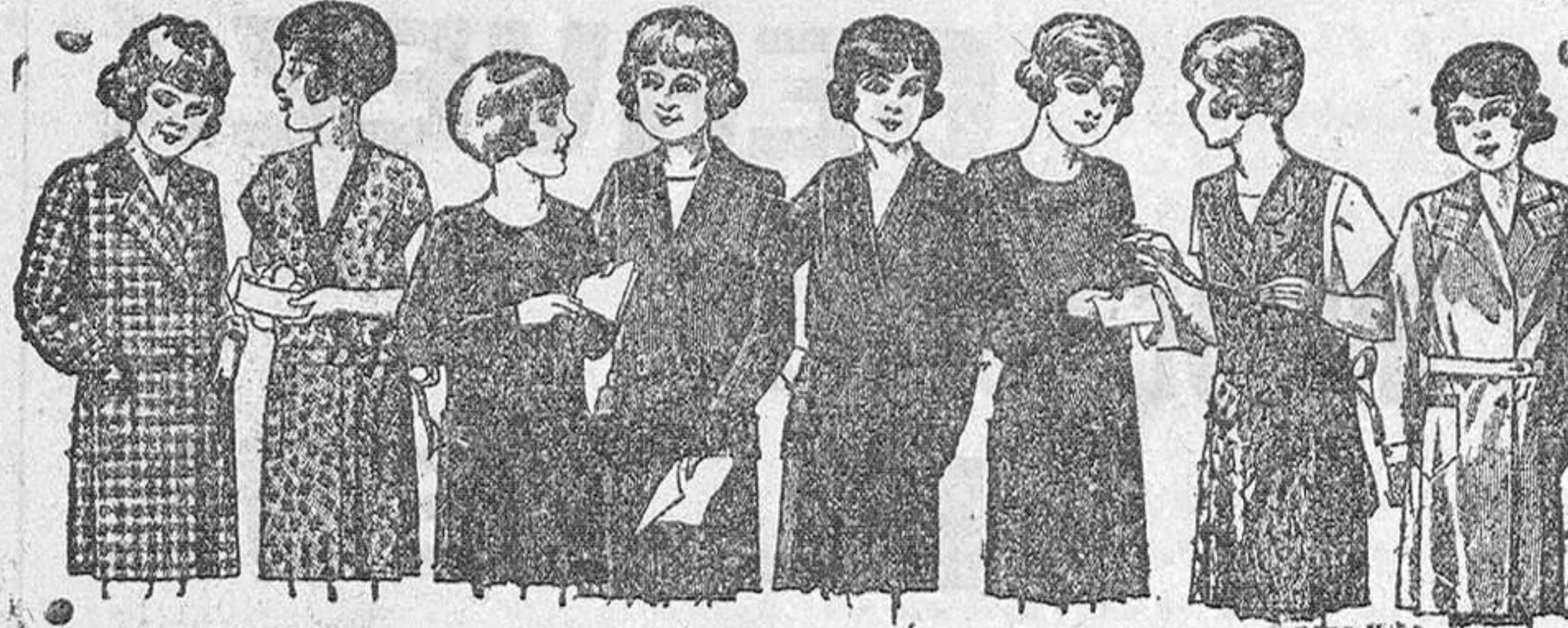
Vestidos para niñas de 8 a 14 años, en crepón, seda o lana, de 12, 15, 18, 20 y 25 pesetas.