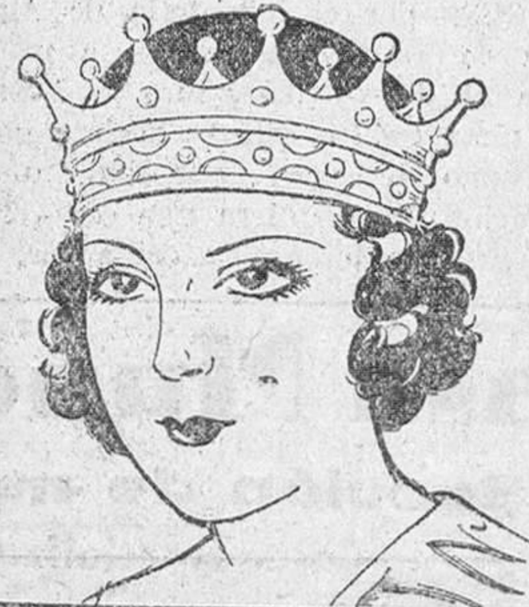
Señorita EMILIA DOCET, elegida MISS ESPAÑA 1933

«En momento más emocionante de mi vida, cuando me presenté, ante los jueces del más Grande Concurso de Belleza de España, me servi de los Polvos Tokalon con Espuma de Crema para ayudarme a conseguir el triunfo. Dichos Polvos me han procurado una tez de maravillosa belleza y de un frescor natural que no había tenido nunca. No creo que esto constituya un medio desleal con respecto a las demás concurrentes, puesto que no existía ningún reglamento que prohibiera los polvos de tocador con espuma de crema. A todas las mujeres y jovencitas cuyo trabajo o vida social obliga a que parezcan siempre lo más encantadoras posible, recomiendo los Polvos Tokalon.»