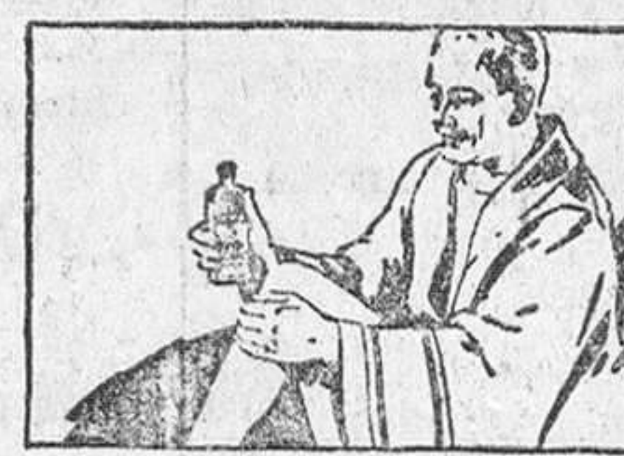
AL PRIMER ASOMO DE REUMATISMO. Alivie el dolor con Linimento de Sloan. Aplíquese suavemente sin frotarlo. Produce alivio inmediato.