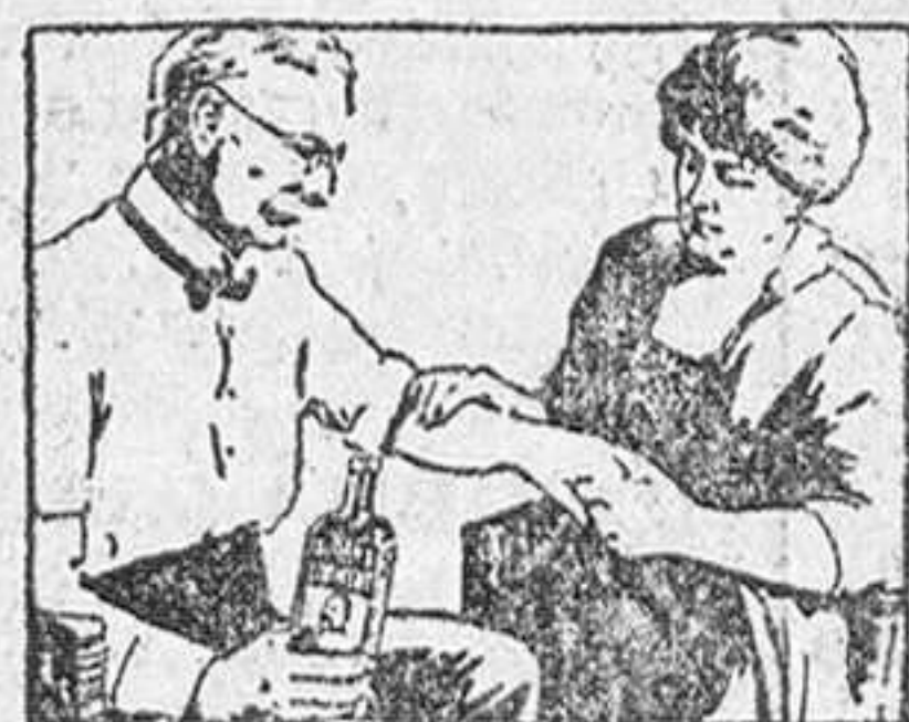
AUN VIEJOS DOLORES REUMATICOS. ceden ante este sencillo tratamiento. Aplíquese el Linimento de Sloan suavemente y éste llevará a los tejidos ruidos por el dolor la sangre fresca y nueva que necesitan para curarse.