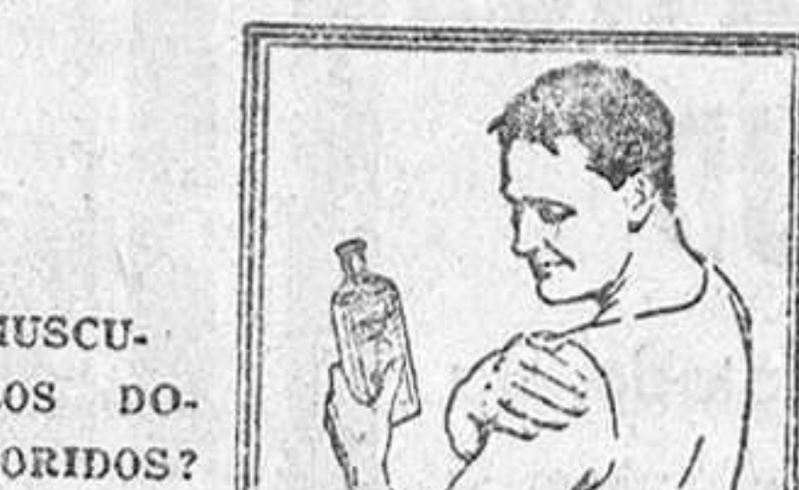
MUSCULOS DOLORIDOS. Aplíquese Linimento de Sloan todas las noches. No hay necesidad de frotarlo.