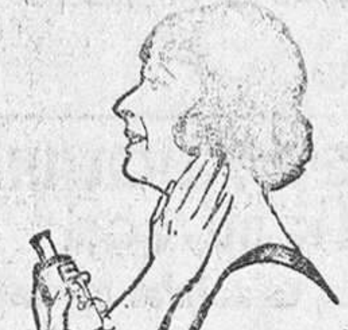
TORTICOLIS. Ud. puede eliminarla merced al Linimento de Sloan. Aplíquese en suaves palmaditas.