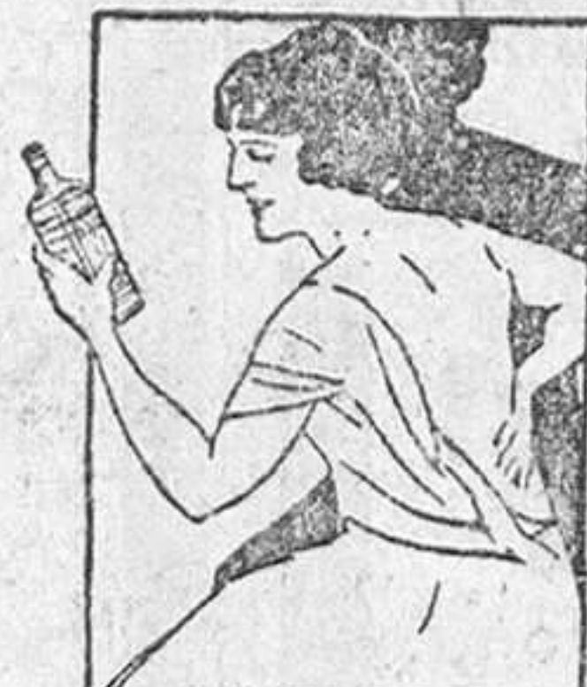
DOLOR DE ESPALDA. Después de un día de ruda labor, alivie el dolor y la tensión de los músculos con Linimento de Sloan.