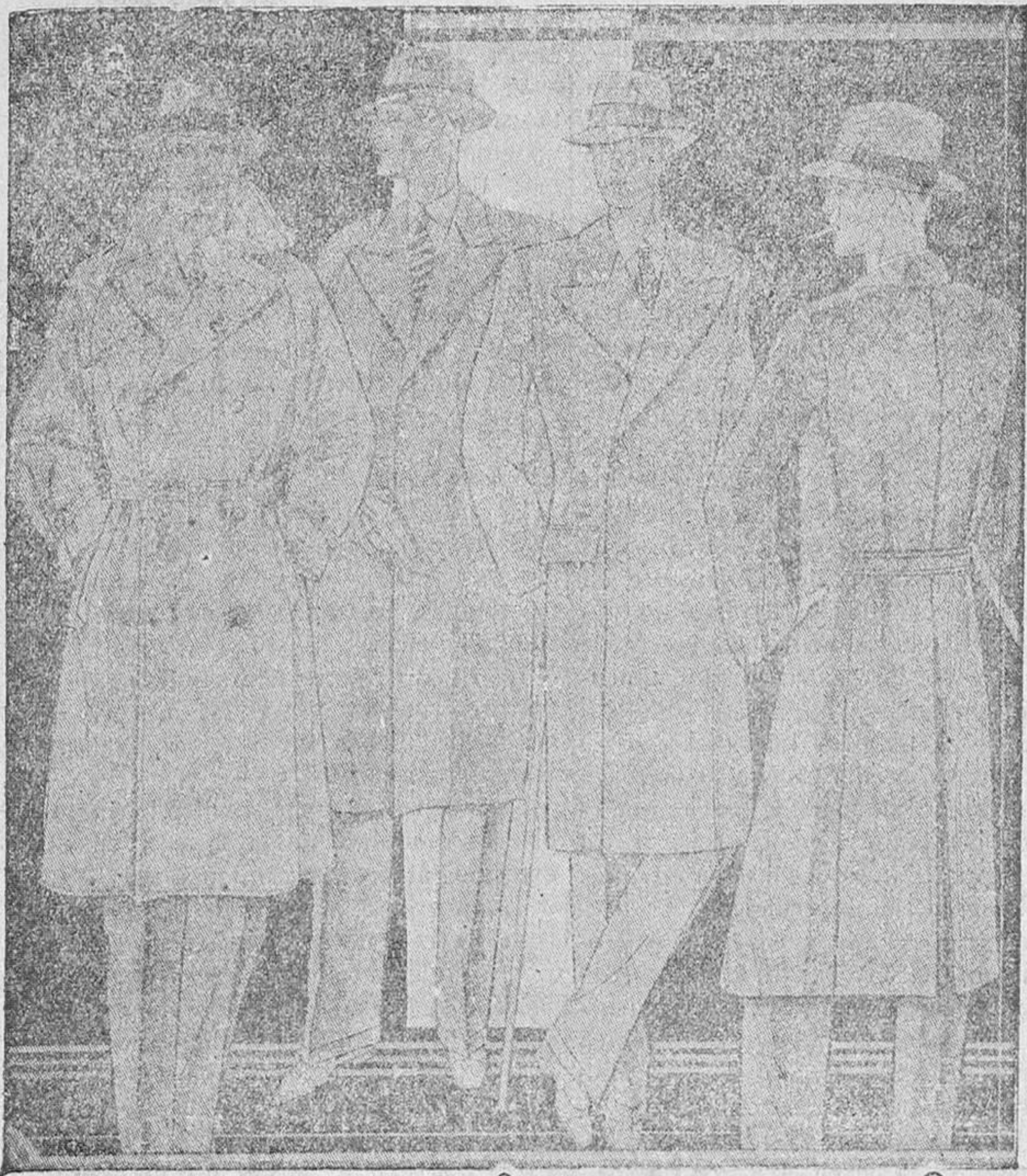
Abrigos novedad, corte moderno desde 35 pesetas a 200 uno. Colores y dibujos modernos.

Primera casa en confeccionar para caballero, señora y niños. Plaza Mayor, 49. Lalm-Galvo, 9 y 11.—Sucursal: Plaza Mayor, 1, Burgos