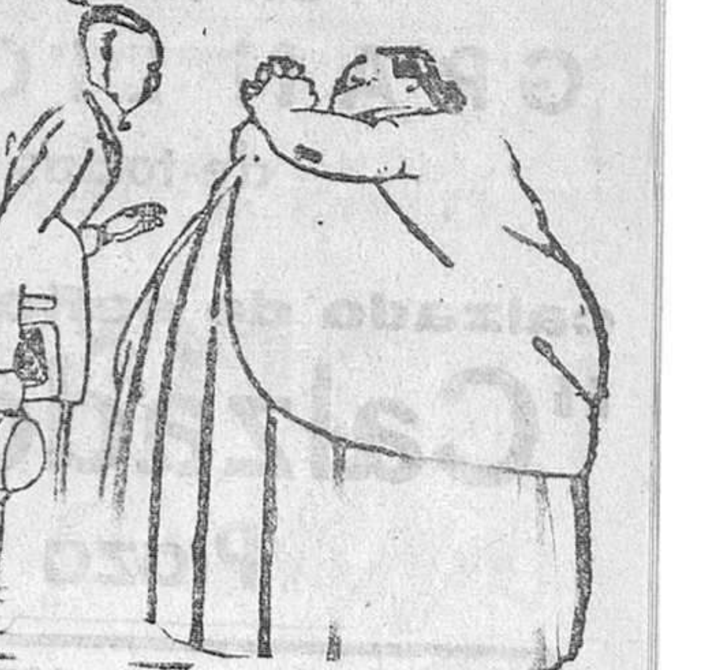
—Te juro, mamá, que este año, sin falta, termino la carrera.

Después de un párrafo elocuente, aludiendo a la Cartuja y a la vida de sus