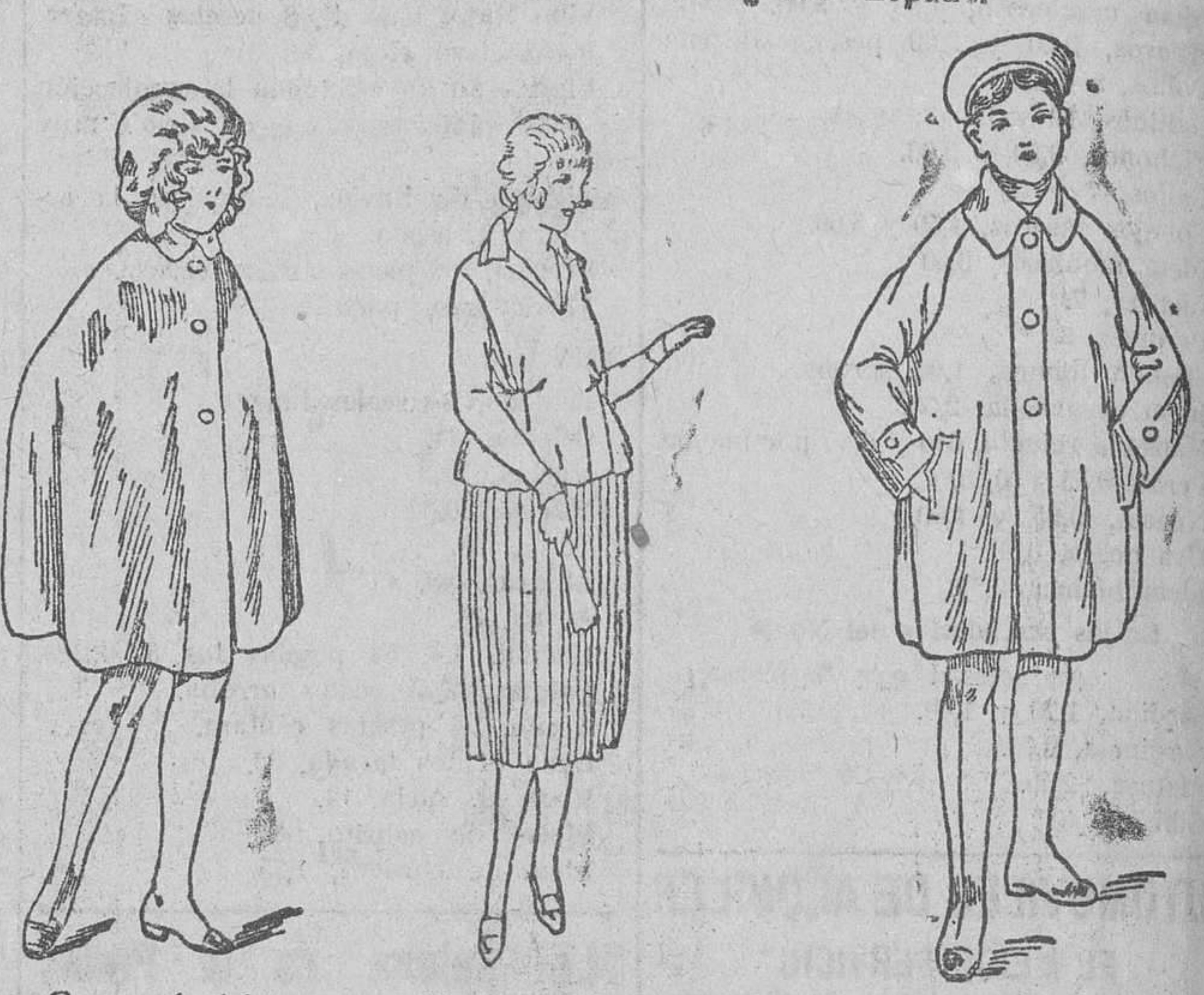
Capas colegiales, en distintos colores, a 8, 9, 10, 12 y 15 pesetas Vestidos para jovencitos en crepon o lana, a 5, 20 y 25 pesetas Impermeables, checos, a 18, 20, 25 y 30 pesetas

Gran casa de tejidos y ropas confeccionadas PARA CABALLERO, SEÑORA, JOVENES Y NIÑOS GASTRERIA Y PANERIA T LEFONO 603 R Establecimiento Oficial del Turing Club Español