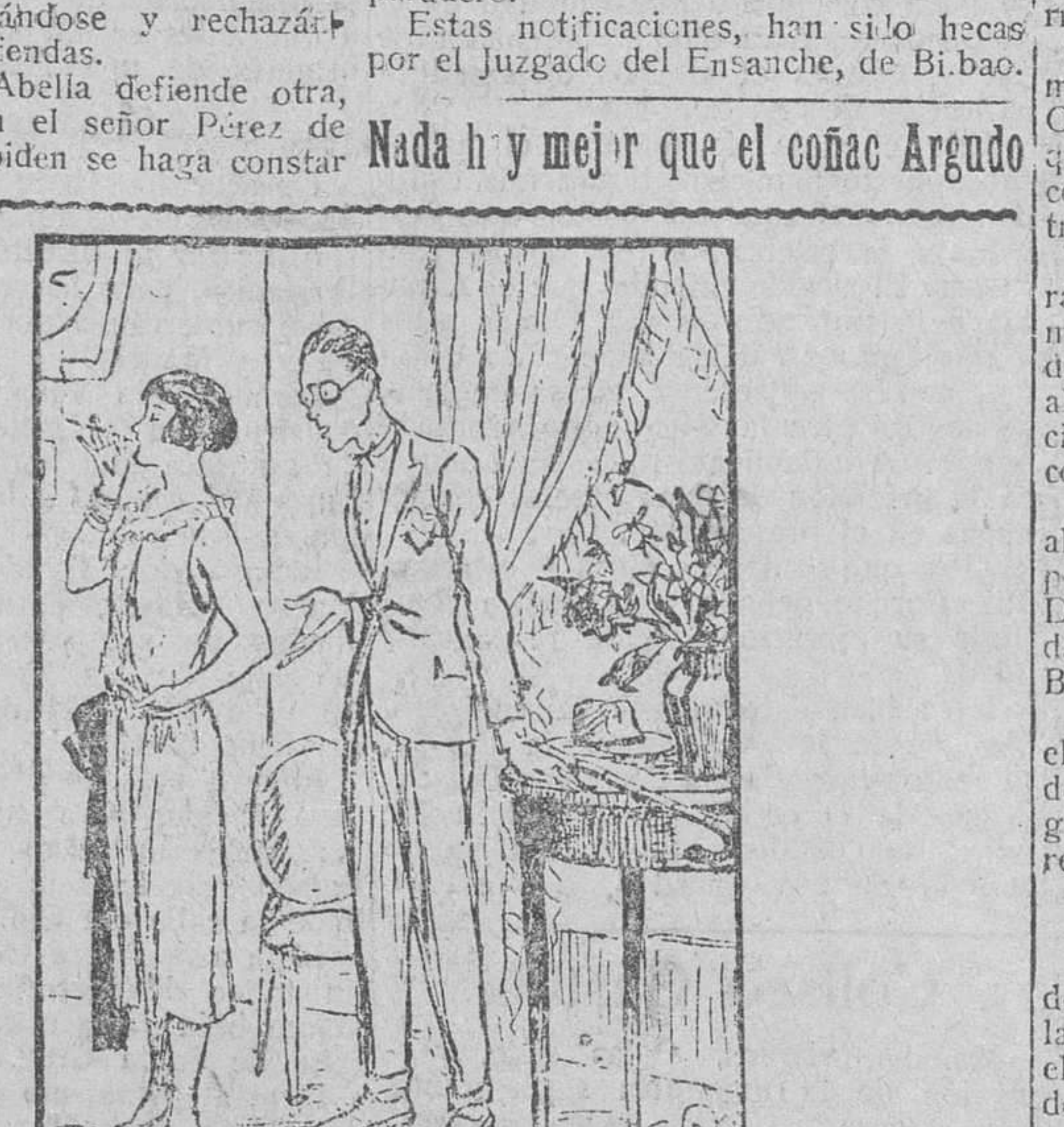
— ¡Por Dios, mujer! — Te ruego que consentas en que nos csemos este mes! — ¡Lo ves cómo no me quiere!