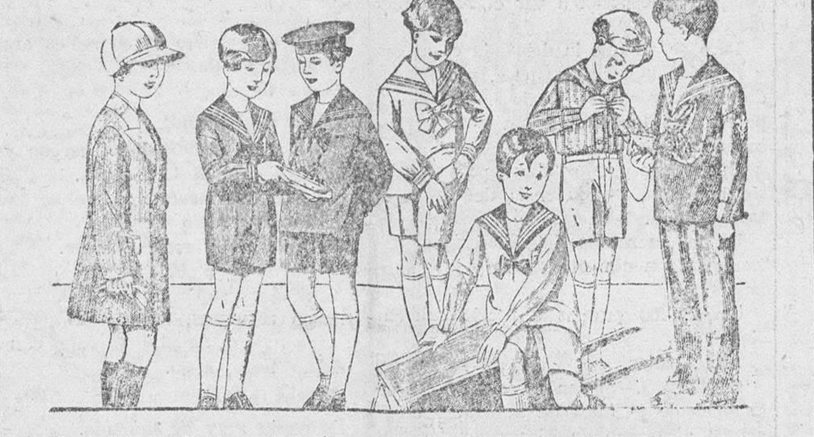
50 modelos distintos en trajes para niños, en jergas azules, vicuñas, pañetes, de dril en blanco y color, desde 8 a 35 pesetas.

Establecimiento Oficial del Turing Club Español