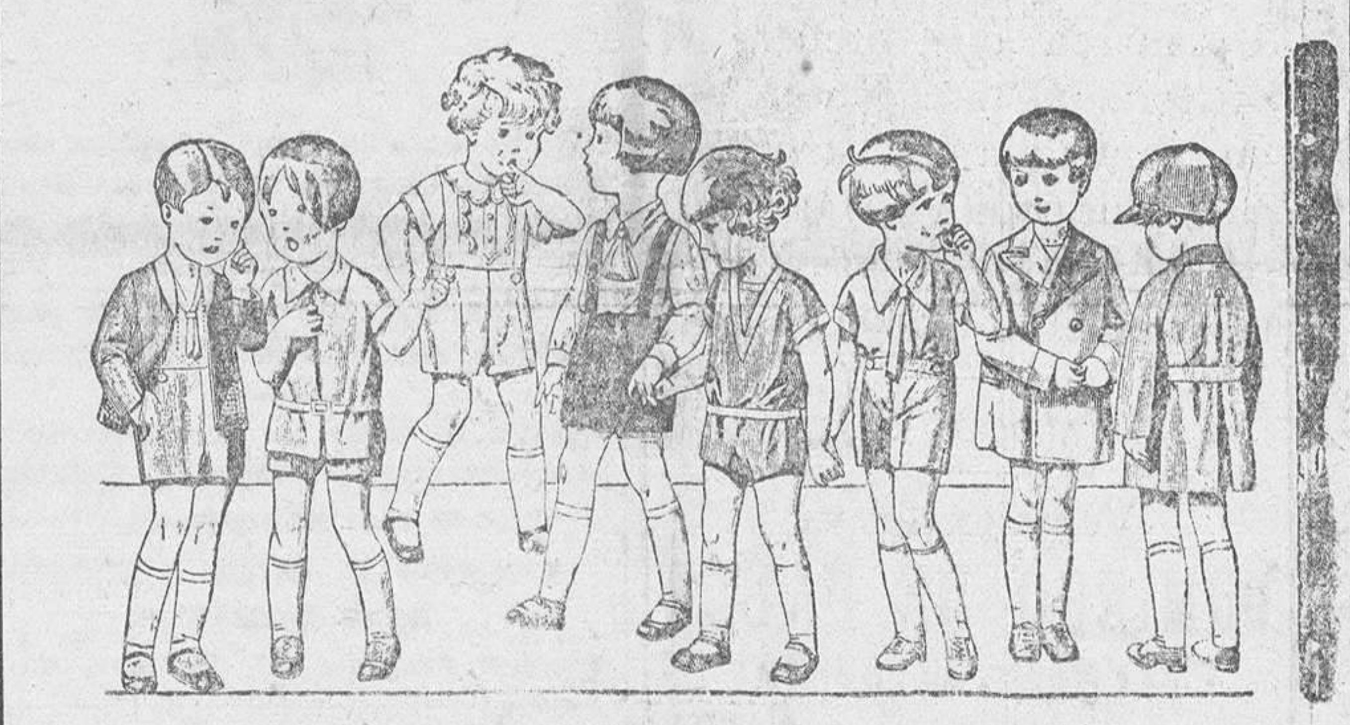
20 diferentes modelos de peles y trajecitos para niños de 2 a 5 años, en terciopelo, dril, lana y otomán. a 3'50, 4, 5, 6, 8 y 10 pesetas. La casa que más surtido presenta y más barato vende.

Siempre grandes existencias encontrarán en la Casa Munguía