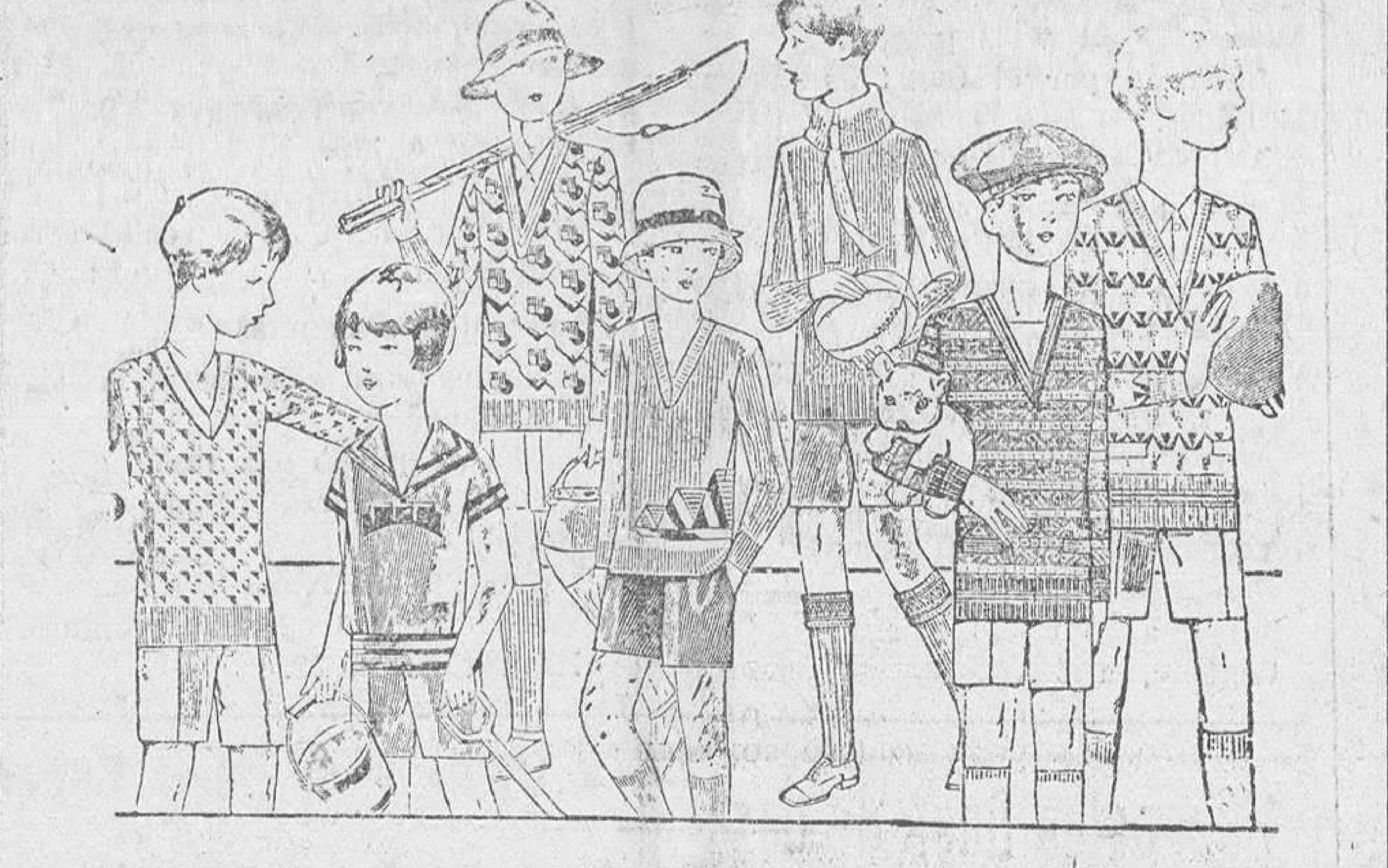
Jerseys y pullover novedad, en lana y algodón, de 4 a 10 pesetas. Modelos y colores novedad. Pantaloncitos cortos de paño, pana, dril y terciopelo.