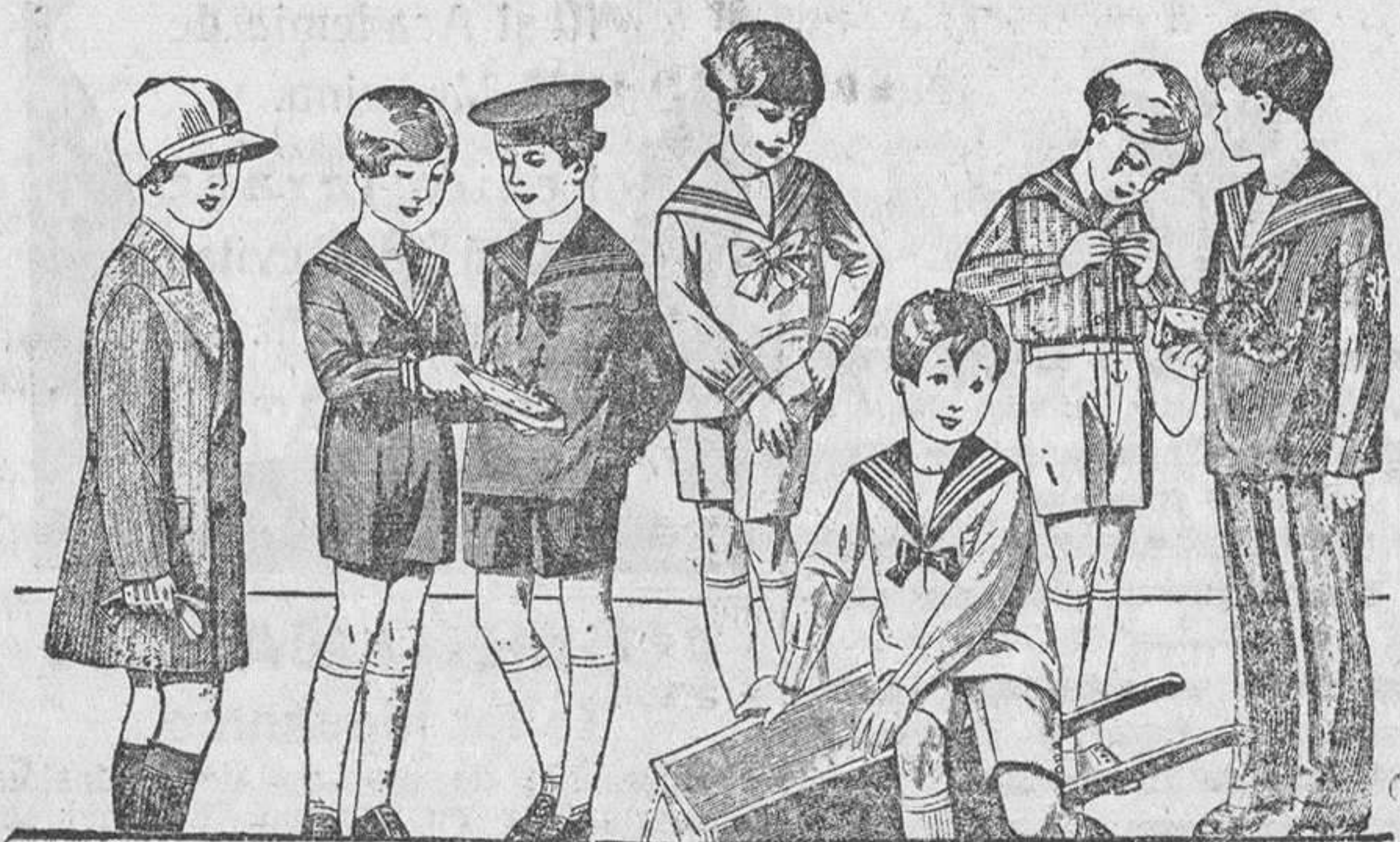
50 modelos distintos en trajecitos para niños, en jergas azules, vicuñas, pañetes y de dril en blanco y color, desde 8 a 35 pesetas. La casa que más surtido presenta y más barato vende.

Siempre grandes existencias encontrarán en la Casa Munguía Plaza Mayor, 42, y Lain-Calvo, 9 y 11.---BURGOS