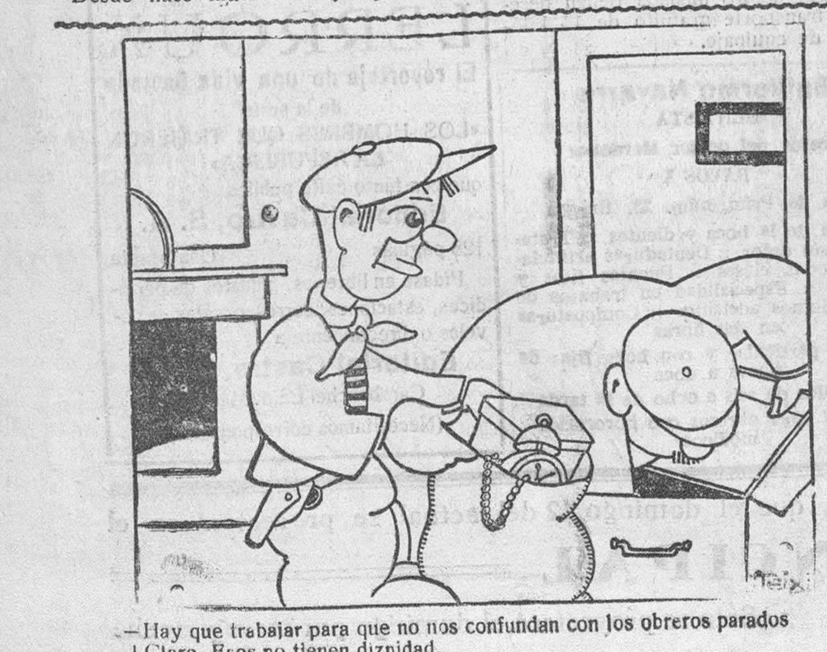
Hay que trabajar para que no nos confundan con los obreros parados. Claro. Esos no tienen dignidad.

Nombrando presidente de Sala de la Audiencia de Zaragoza a don Jo-