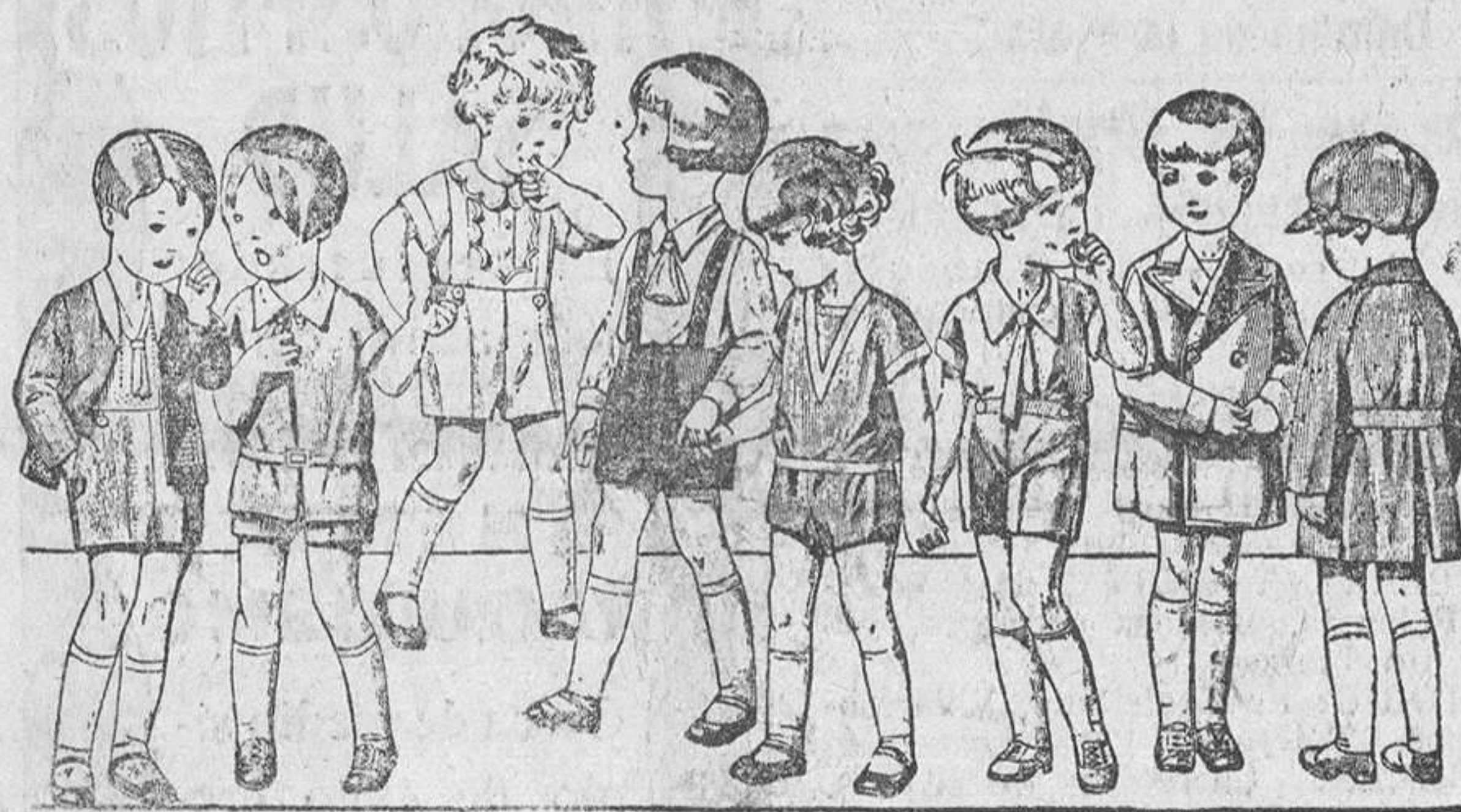
20 diferentes modelos de peleles y trajecitos para niños de 2 a 5 años, en terciopelo, dril, lana y otomán, a 3,50, 4, 5, 6, 8 y 10 pesetas.

PARA CABALLERO, SEÑORA, JOVENES Y NIÑOS SASTRERIA Y PANERIA T. LEFONO 603 R Establecimiento Oficial del Turing Club Español