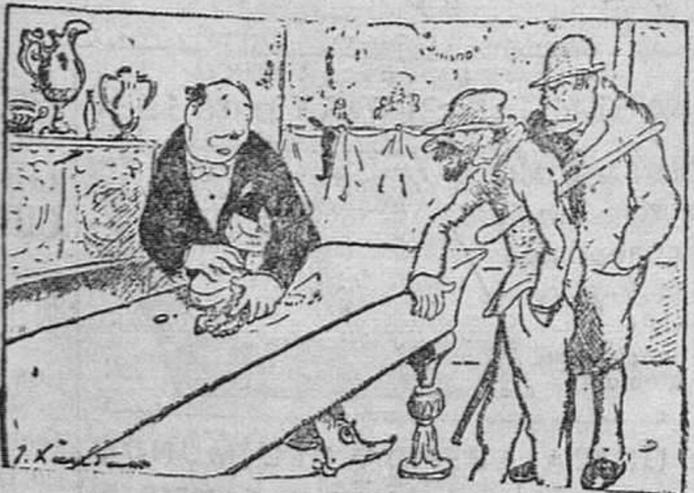
EN LA JOYERIA

—Pues veníamos, si no le molesta a usted, a que nos enseñe unos cuantos solitarios. —¡Caramba, no faltaba, más...! Voy por una baraja...!