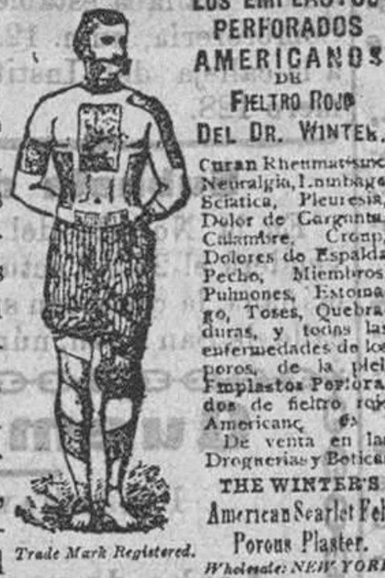
Trade Mark Registered. THE WINTERS American Patent. New York.

Los EMPLASTOS perforados americanos de fieltro rojo del Dr. WINTER, infunden una saludable corriente eléctrica por todo el sistema, e instantáneamente mitigan los dolores, tranquilizan los nervios, fortalecen los órganos digestivos debilitados y devuelven a los enfermos la salud sin ninguna fét y a menudo a pesar de los temores y las preocupaciones. Estos Emplastos son especialmente útiles para fortalecer los delicados músculos dorsales de las señoras en sus períodos mensuales. Todas las escuelas de Medicina los recomiendan y usan para las curas de las afecciones neurálgicas, reumáticos, debilidades causadas por indisposiciones anticipadas, esfuerzos indebidos o enfermedades de los riñones, pleuresías, calambres, punzadas en la espalda, dolores en el pecho que se extienden a los homoplatos y finalmente para todas las enfermedades que resultan de interrupciones en la circulación.