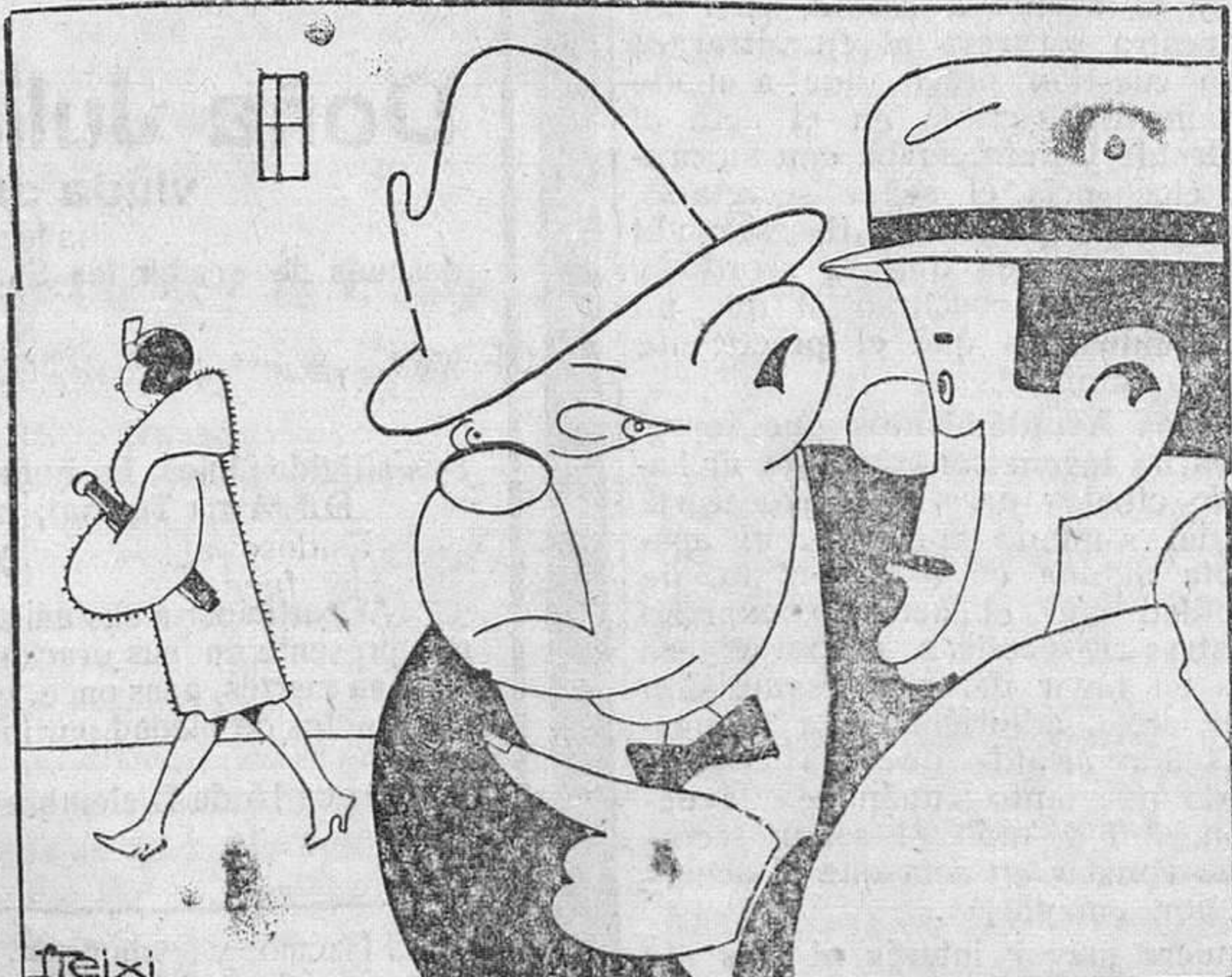
—A esa señora le cuesta un horror vestirse? —Gasta mucho? —No. Es que tiene reuma en un brazo.