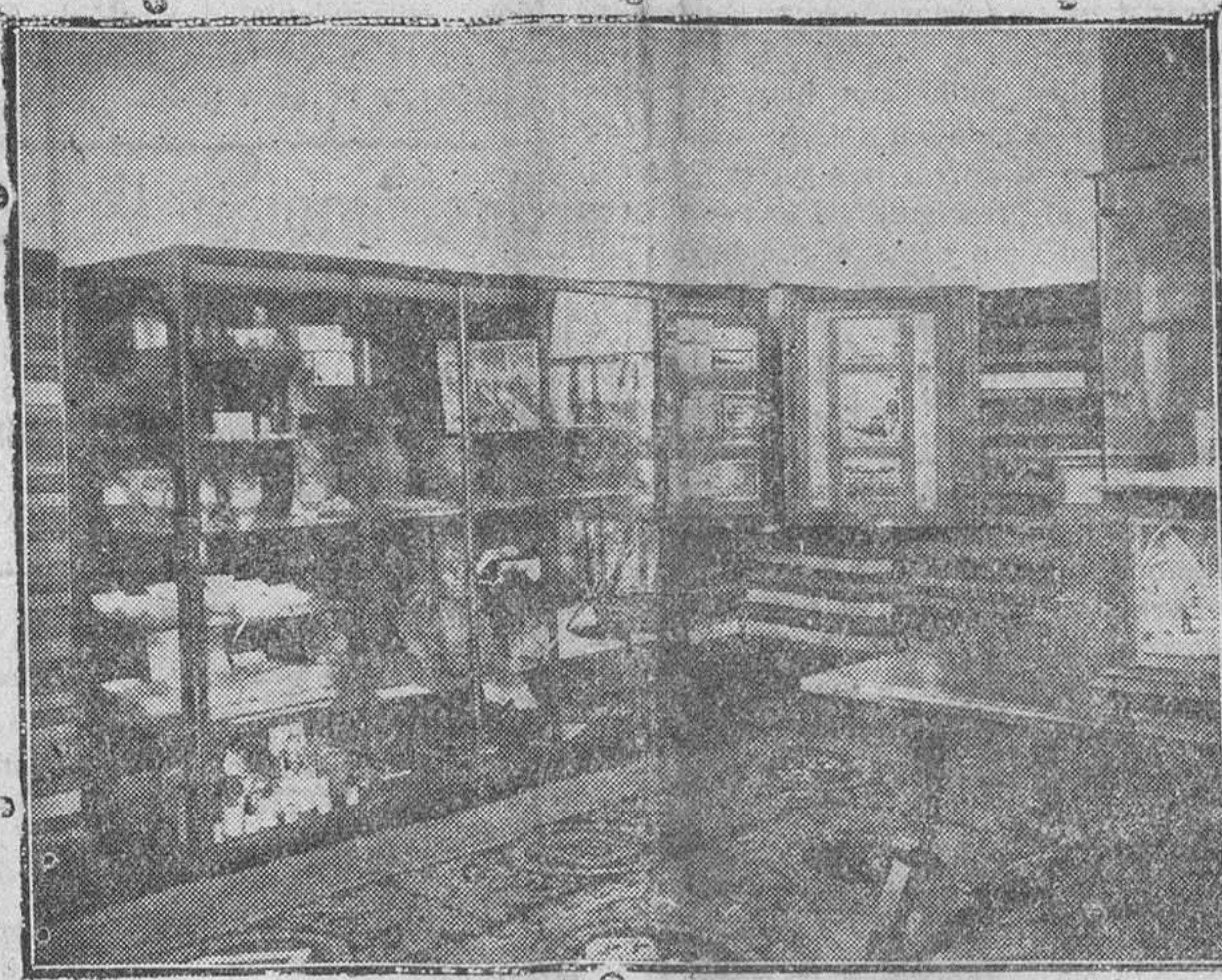
Instalación de la Diputación de Burgos

Burgos pues, hay que declararlo, por doloroso que sea, no está bien representado, ni en ese pabellón ni en los