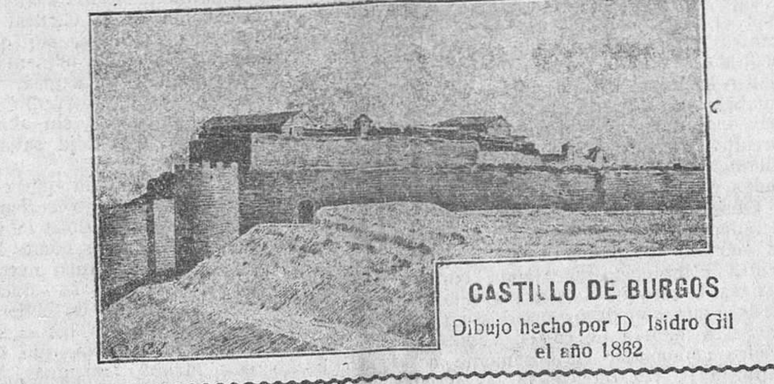
GASTILLO DE BURGOS. Dibujo hecho por D. Isidro Gil el año 1882

A los colaboradores espontáneos SE LES ADVIERTE QUE NO SE DEVUELVEN LOS ORIGINALES NI SE SOSTIENE CORRESPONDENCIA