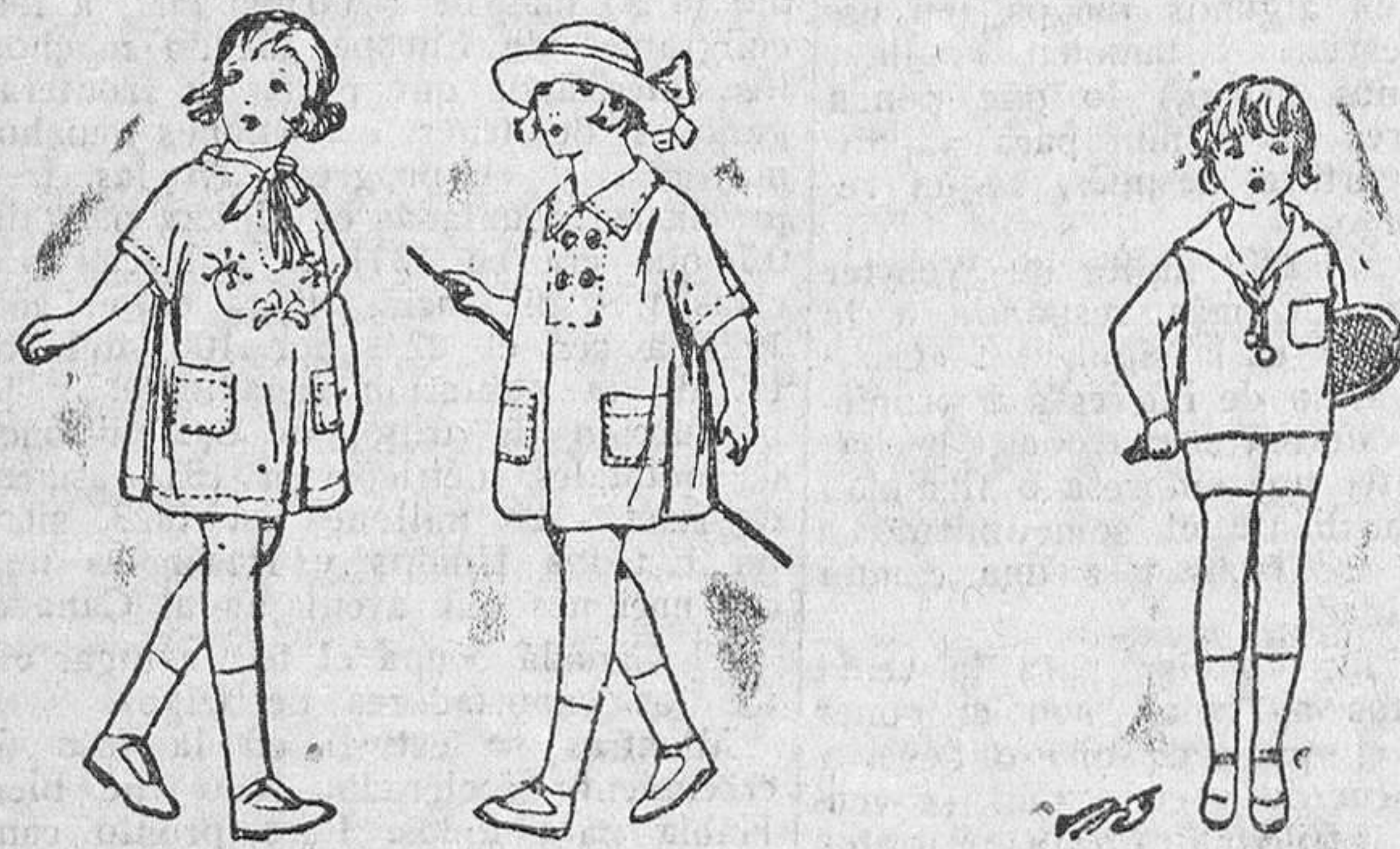
Vestiditos de niños de 3, 4 y 5 pesetas, Trajecitos de punto a 7, 8, 10 y 15 pesetas

Precio fijo verdad. Todos los artículos marcados.