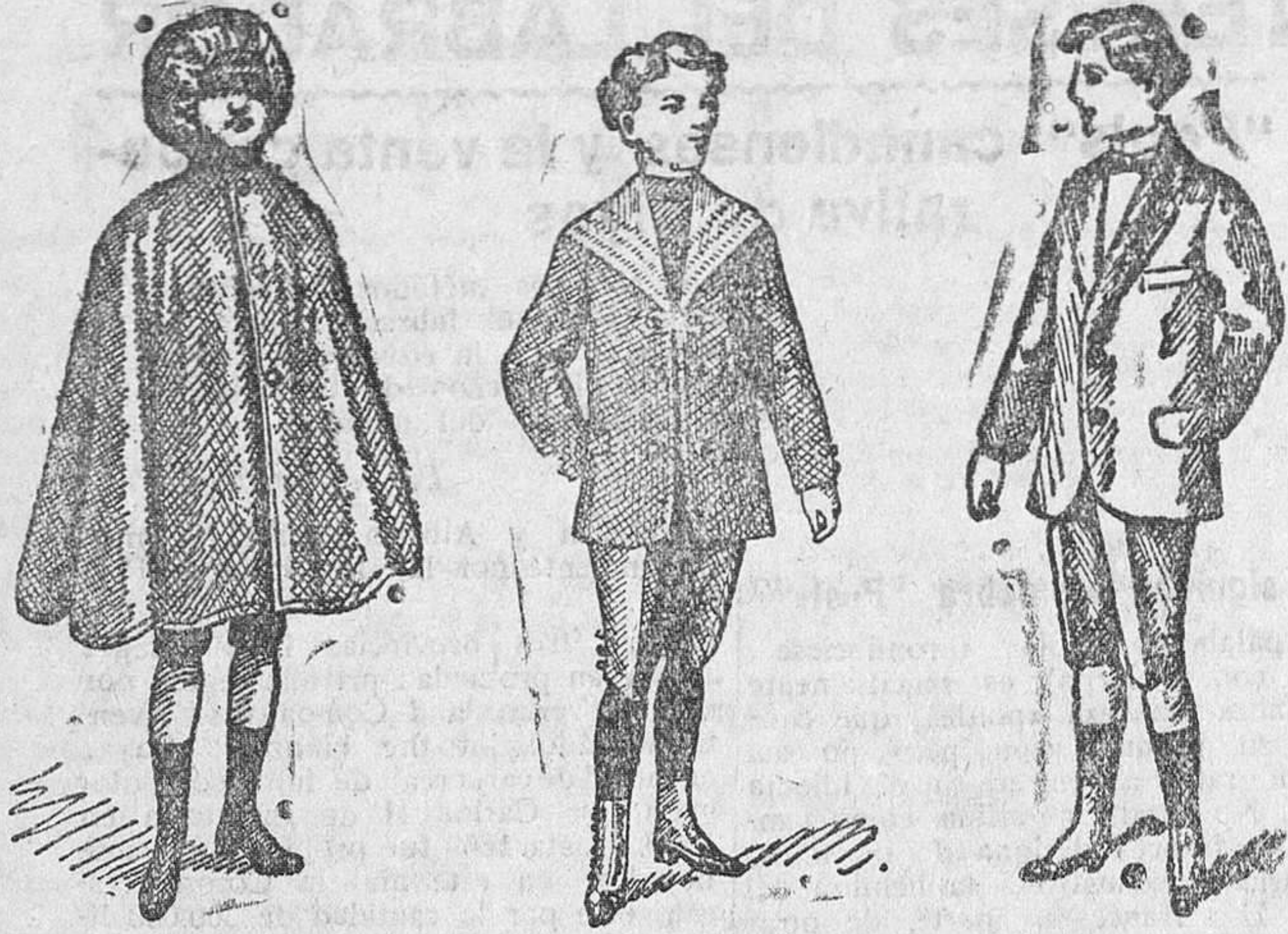
Capita impermeable a 8, 10 y 15 pesetas Trajecitos para niños diversidad de modelos, de 15 a 30 pesetas

Gran casa de tejidos, pañería y confecciones de caballero, señora y niños