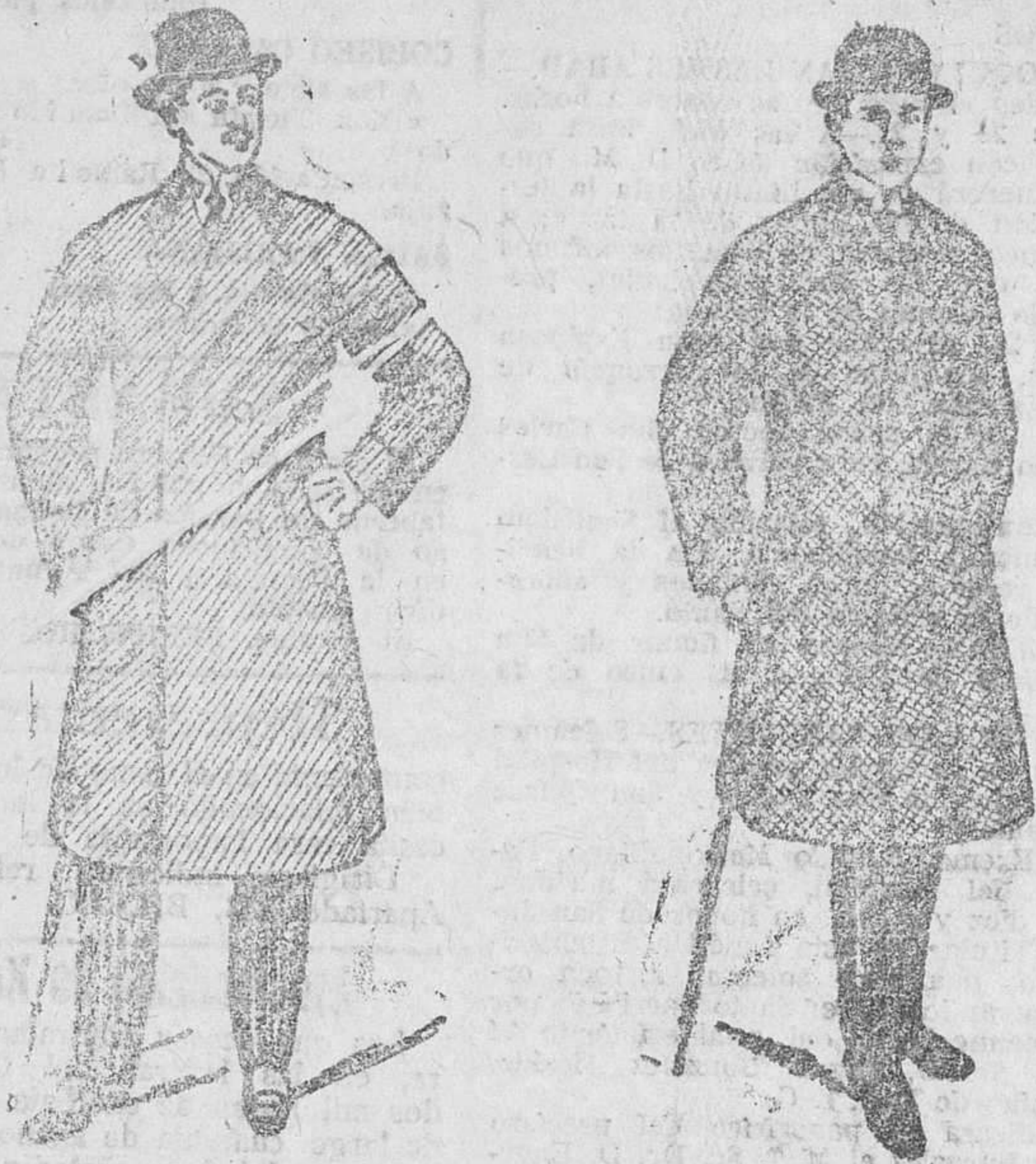
2.000 gabanes para caballero, a 40, 50, 60, 70, 90, 100 y 150 pesetas

Gran casa de tejidos, papelería y confeccionados de caballeros, señoras y niños