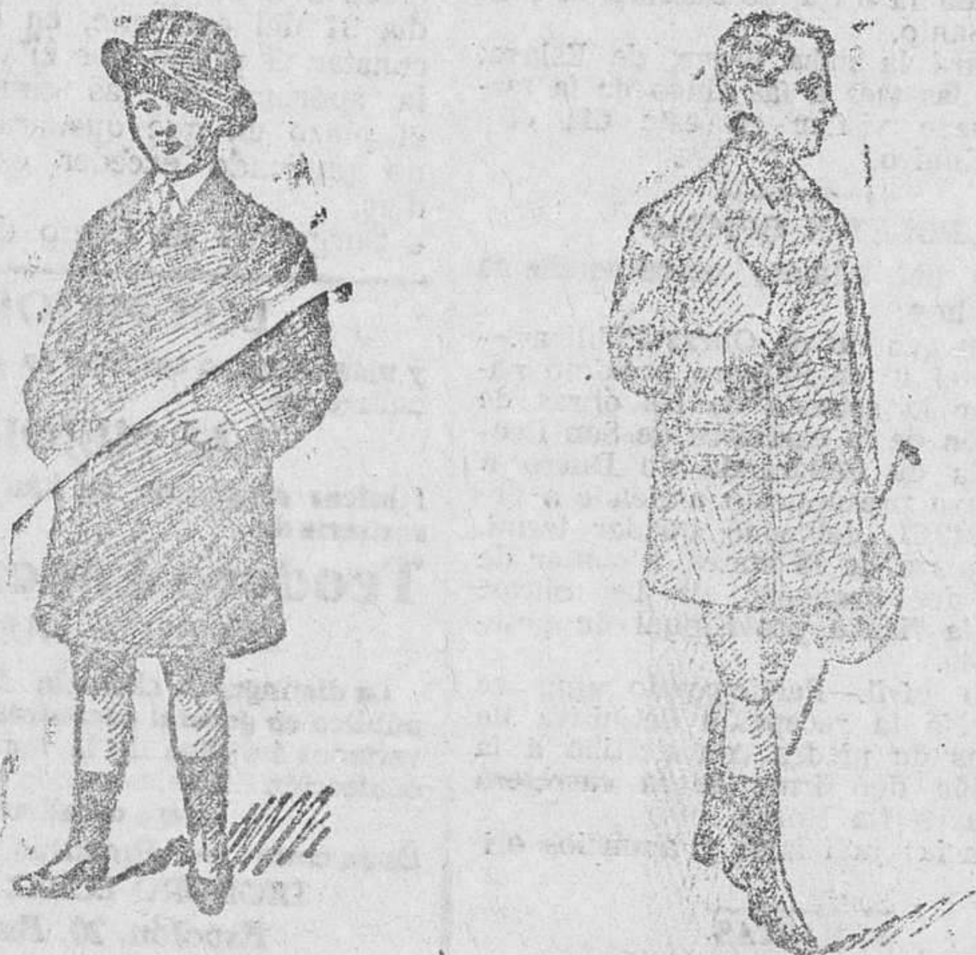
1.000 abrigos para niños, diversidad de modelos, a 16, 20 y 25 pesetas Precio fijo verdad. Todos los artículos marcados.