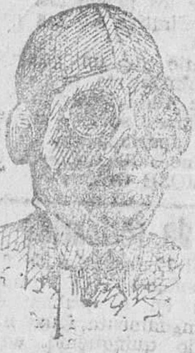
Pasamontañas de lana, a 4 y 5 pesetas. Gafas, a 3, 3'50 y 4 pesetas.