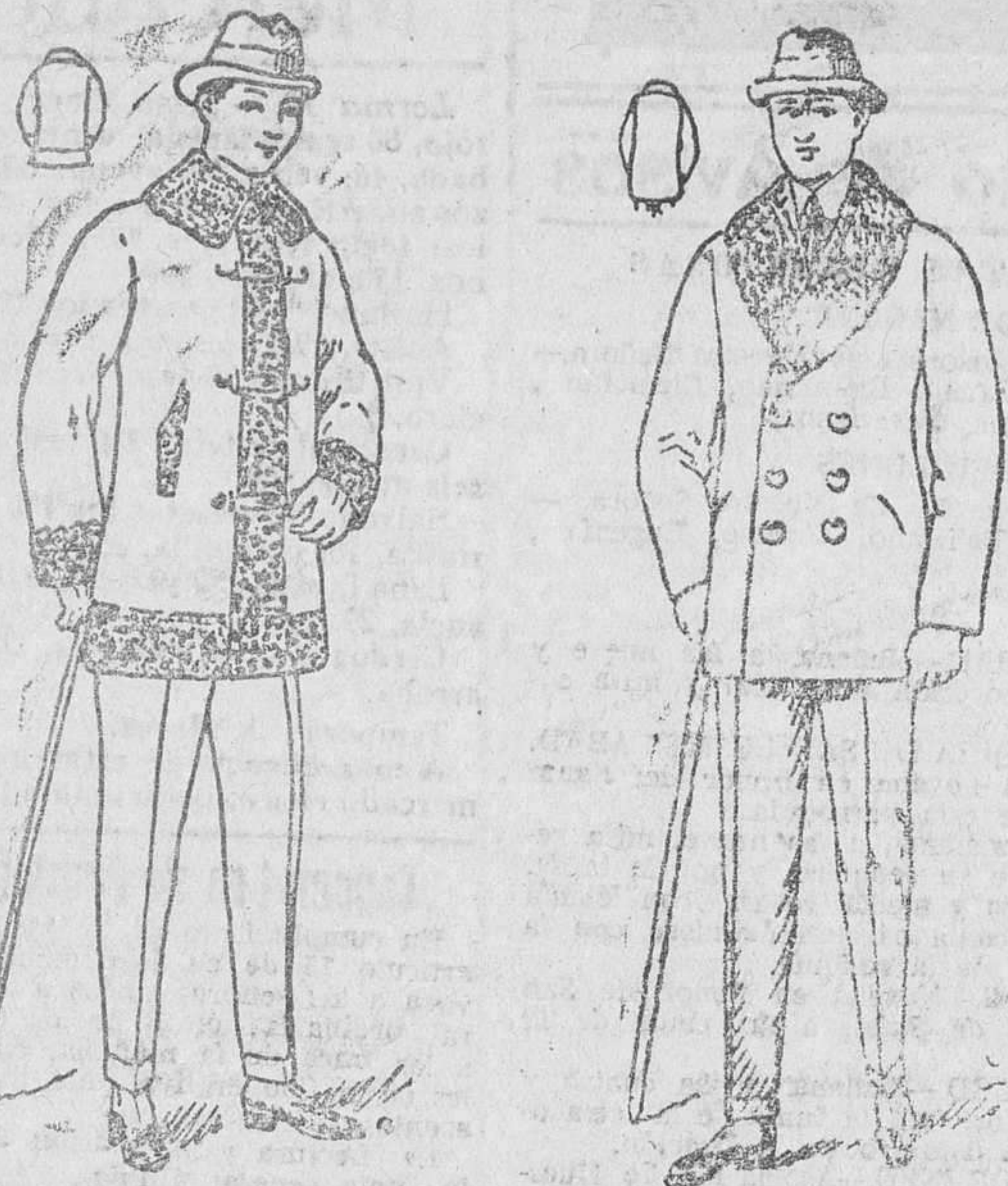
Pellizas de paño melton y castor, a 17, 20, 25, 30, 40, 60 y 100 pesetas

Gran casa de telidos, gaxetas y confecciones de caballeros, señas y niños