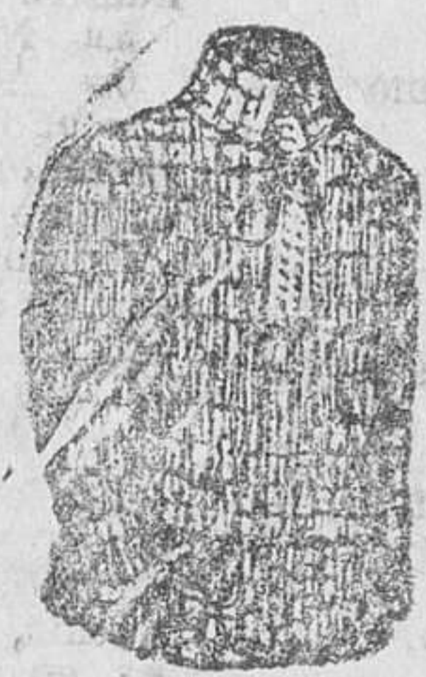
Jersey lana y algodón, a 4, 5, 6 y 7 pesetas.