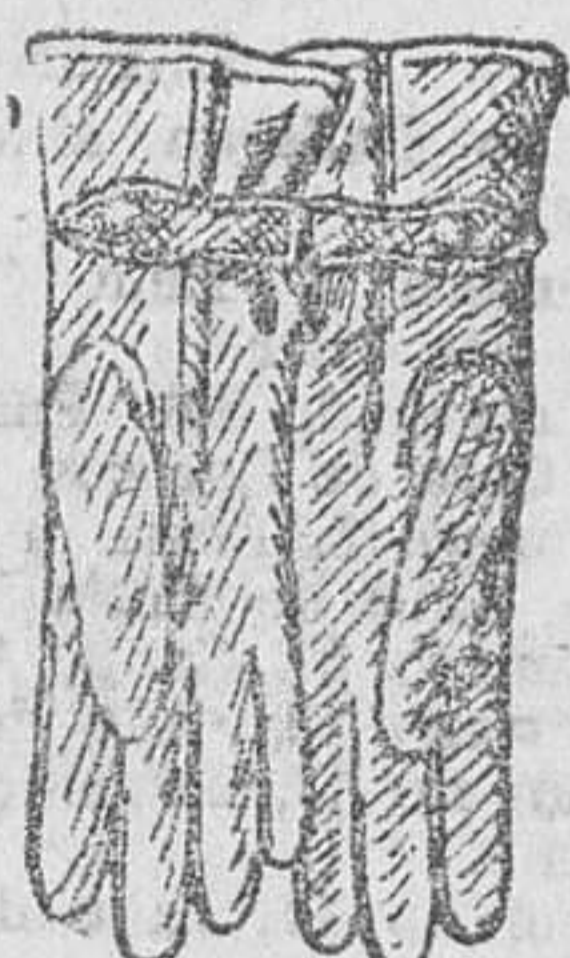
Guantes piel, a 8, 10 y 12 pesetas

Prepto fur verdaz. Todos los artículos mareados